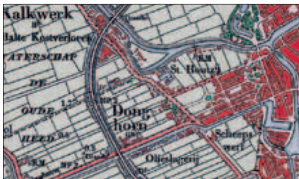
Topografische kaart, 1908.