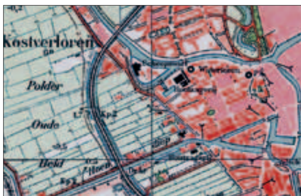
Topografische kaart, 1935