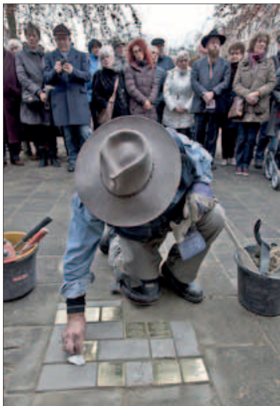
Gunter Demnig aan het werk in de Schilderswijk (8 december 2016).

Met zijn blauwe busje met cement, cirkelzaag en ander gereedschap trekt hij door de Schil-