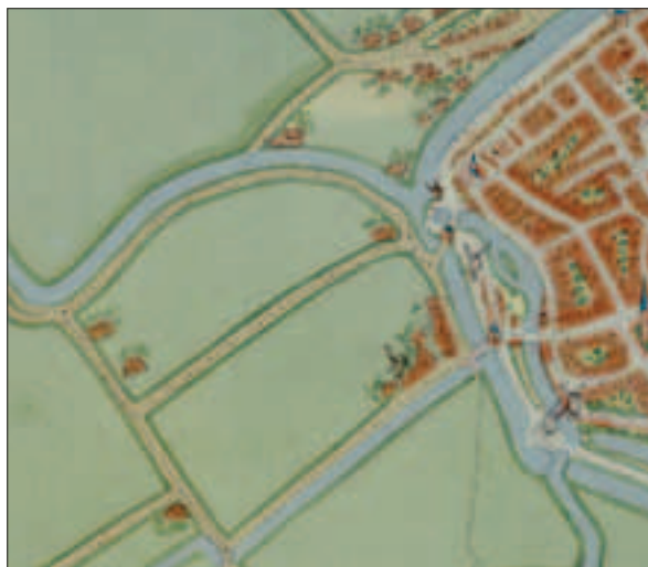
Fragment van Tabula Groeninghen (Jacob van Deventer, 1565).

Het gebied waarin nu de Schildersbuurt ligt, is tot het einde van de negentiende eeuw drassig grasland. Het eigenlijke leven speelt zich af binnen de stadswallen. Dat verandert als de overheid in 1874 toestemming geeft om de oude vestingwerken af te breken. Het is de aanleiding voor een grote stadsuitbreiding naar het westen. Er verschijnen nieuwe straten met een breed scala aan woningen, van eenvoudige arbeiderswoningen tot statige herenhuizen. In 1903 besluit de gemeente de straten te vernoemen naar Groningse schilders. Vanaf dat moment staat dit gedeelte van de stad bekend als de Schildersbuurt. Na de oorlog wordt het buurtschap Kostverloren deel van de stad Groningen. Kostverloren en de Schildersbuurt gaan samen de Schilderswijk heten.