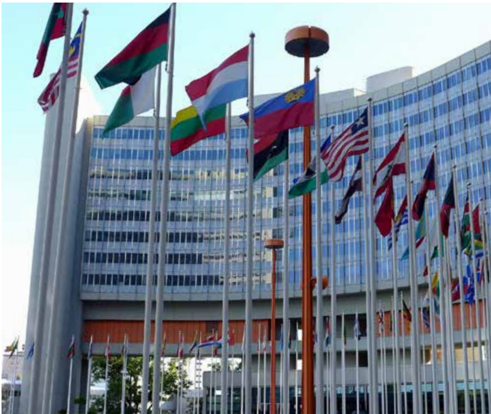
Figuur 1.4 Verenigde Naties.

Nu lijkt het wel of de hele wereld draait om economie en dat burgerschapsidealen als duurzame ontwikkelingsdoelen uitsluitend bestemd zijn voor dagdromers. In de echte wereld gaat het om geld verdienen. Economische groei lijkt niet te stoppen. Zonder groei geen welvaart en vooruitgang. Toch zijn er ook tegenbewegingen aan het ontstaan.