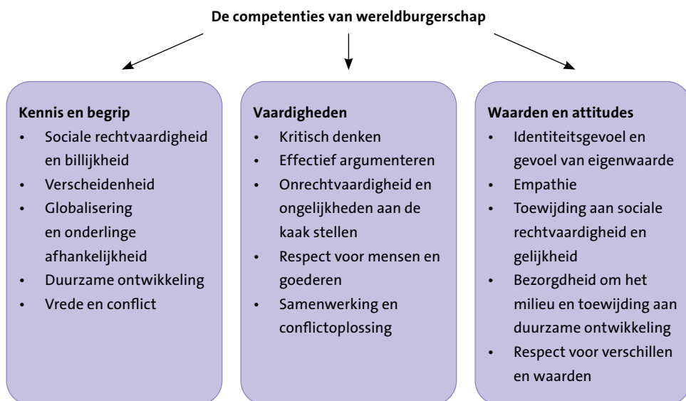
Figuur 1.3 Oxfam-competenties.