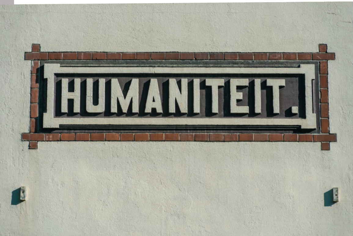
Opschrift aan de Dienstwoning Humaniteit in Veenhuizen