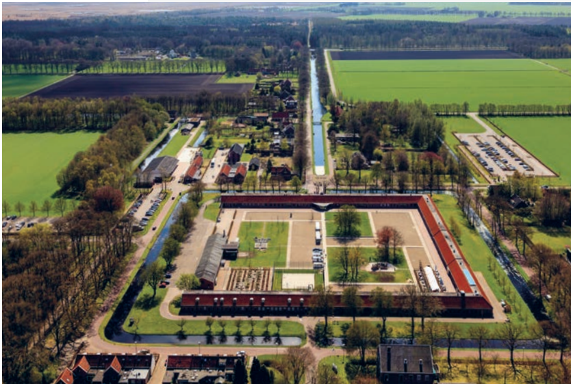
Luchtfoto Tweede Gesticht

WEINIG LANDSCHAPPEN IN DE LAGE LANDEN ZIJN NIET MEE GEVORMD DOOR MENSEN. MAAR WEINIG LANDSCHAPPEN ZIJN ZÓ INGRIJPEND DOOR DE MENS VORMGEGEVEN ALS DE KOLONIËN VAN WELDADIGHEID IN NEDERLAND EN BELGIË. ALLEMAAL ZIJN ZE ANDERS, ALLEMAAL LIJKEN ZE OOK OP ELKAAR. HOE IS DAT ZO GEKOMEN? WAT IS HET VERHAAL?