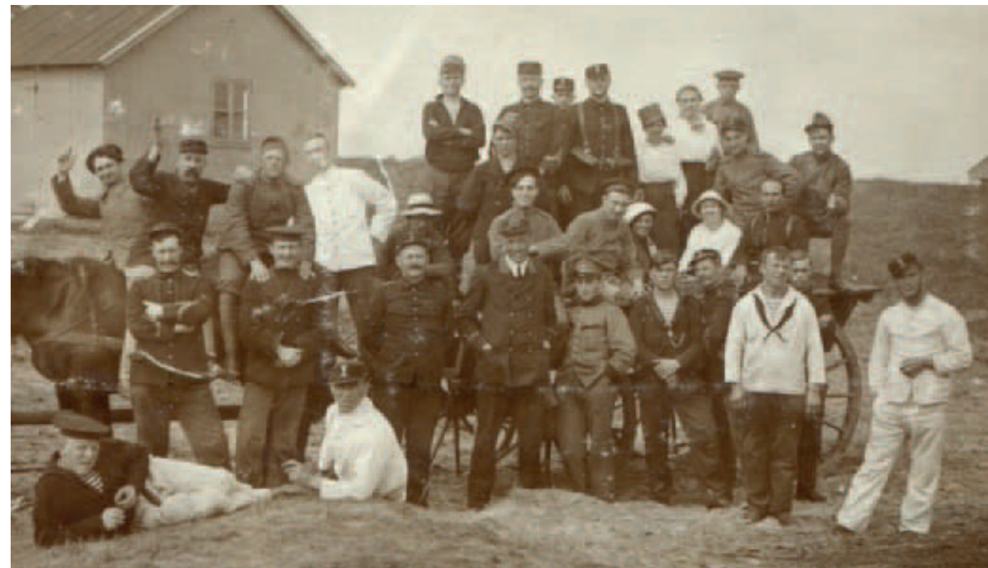
Gemobiliseerde militairen op Rottumeroog tijdens de Eerste Wereldoorlog.

Rottumeroog is vernoemd naar het wierdedorp Rottum, dat nu in de Groningse gemeente Het Hogeland ligt. In dit dorp stond ooit een klooster en het eiland was voor een groot deel in het bezit van dit klooster. Al sinds de late middeleeuwen wordt het eiland genoemd en bewoond.