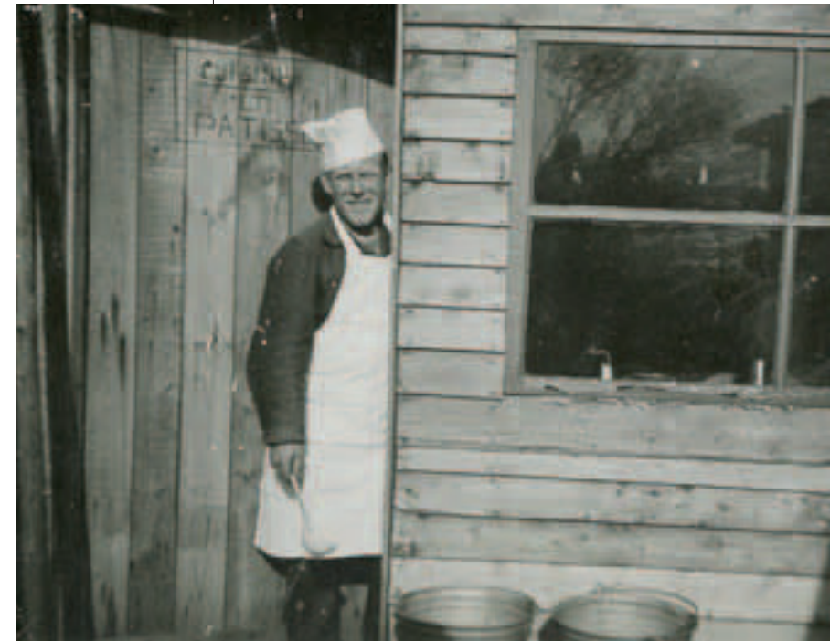
De keuken gemaakt van aangespoeld hout.