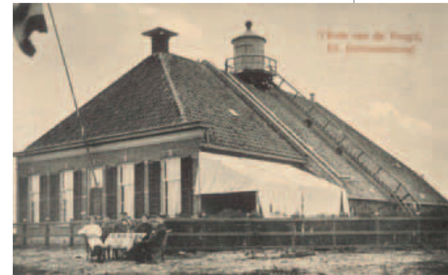
De voogdwoning in het begin van de 20 e eeuw.

Verder draagt de voogd zorg over de grote vogelkolonies op het eiland en zoekt hij naar eieren; een veelvoorkomende bezigheid. Toxopeus heeft voor al deze werkzaamheden ook een paar knechten in dienst.