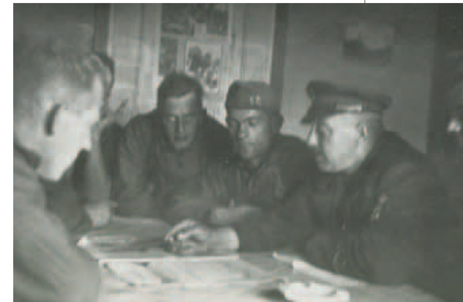
De tafel waaraan gehuild werd?

De zee is in januari 1940 volledig dichtgevroren. Men probeert een route uit te zetten naar het vasteland en komt