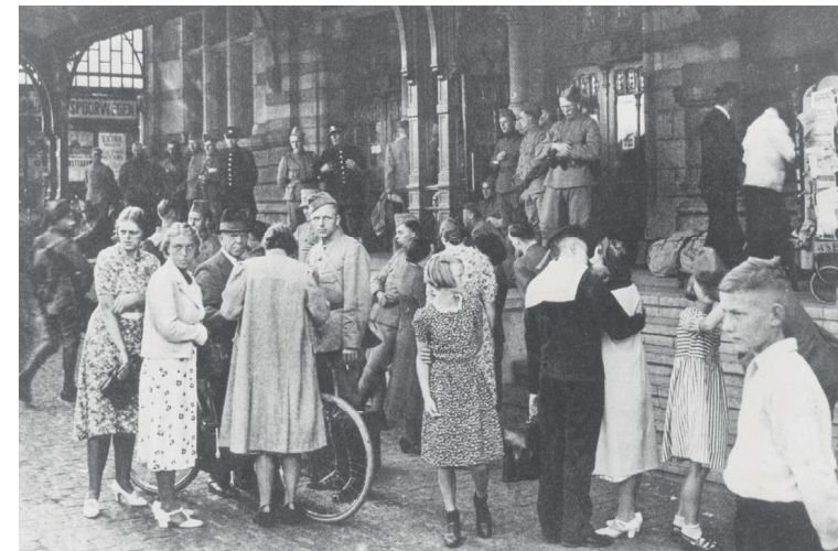
Soldaten nemen afscheid op het hoofdstation in Groningen.