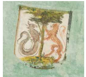
Detail 'Beschrijvinge van Schellingherlant' – 1602.