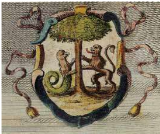
Detail van rechter bovenhoek van prent boven.