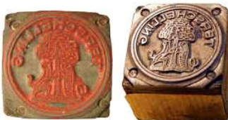
Gemeentelijke lak- en inktstempels zoals in gebruik tussen 1816 en 1963.