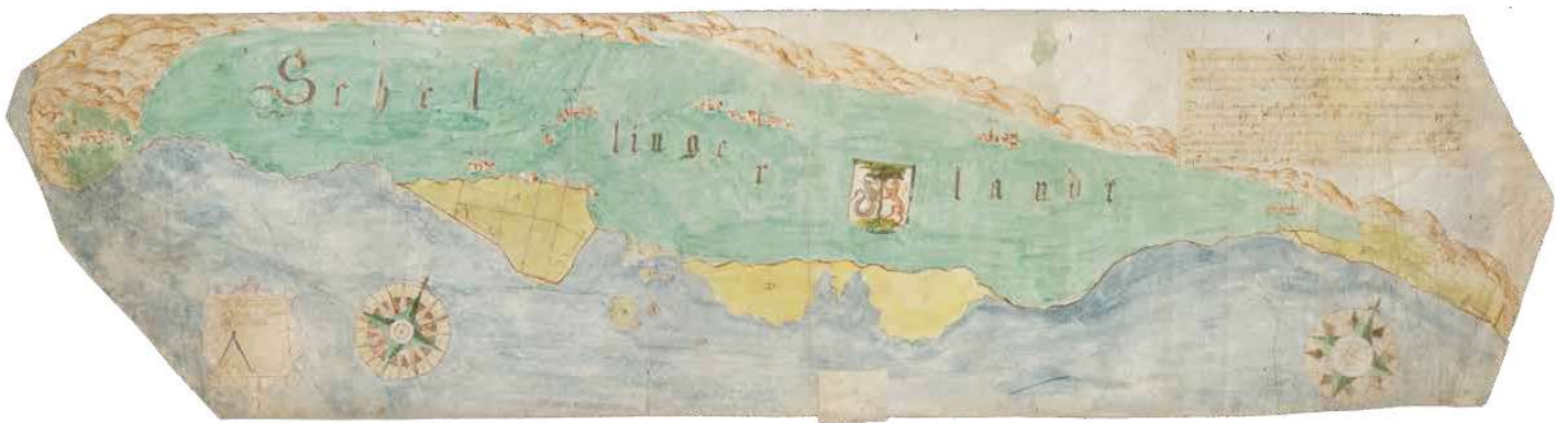
'Beschrijvinge van Schellingherlant' – 1602.