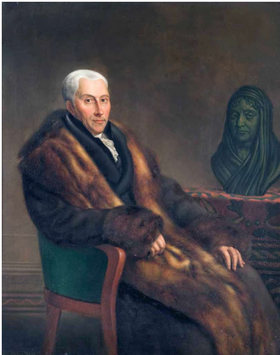
Gijsbert Karel van Hogendorp.

Ook de gematigde Oranjegezinde Gijsbert Karel van Hogendorp wordt op een zijspoor gezet. Het geeft hem de tijd om na te denken over hoe men de diverse groepen in het land en de machten in de staat in evenwicht kan brengen. Hij is niet haatdragend. Hij wil bovenal een nieuw Nederland waarin de partijtegenstellingen worden overbrugd. Op die uitgangspunten baseert hij het concept voor een grondwet.