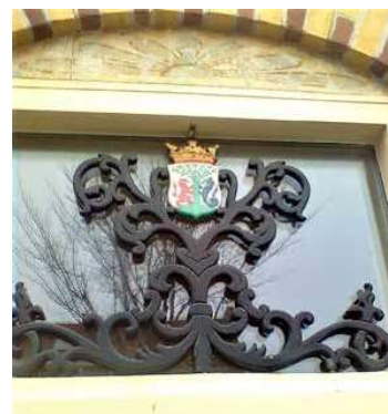
Snijraam, Oosterburen 43.