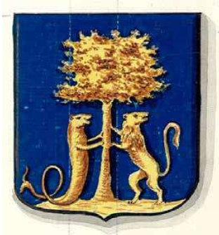
Wapen van Terschelling, 1816.