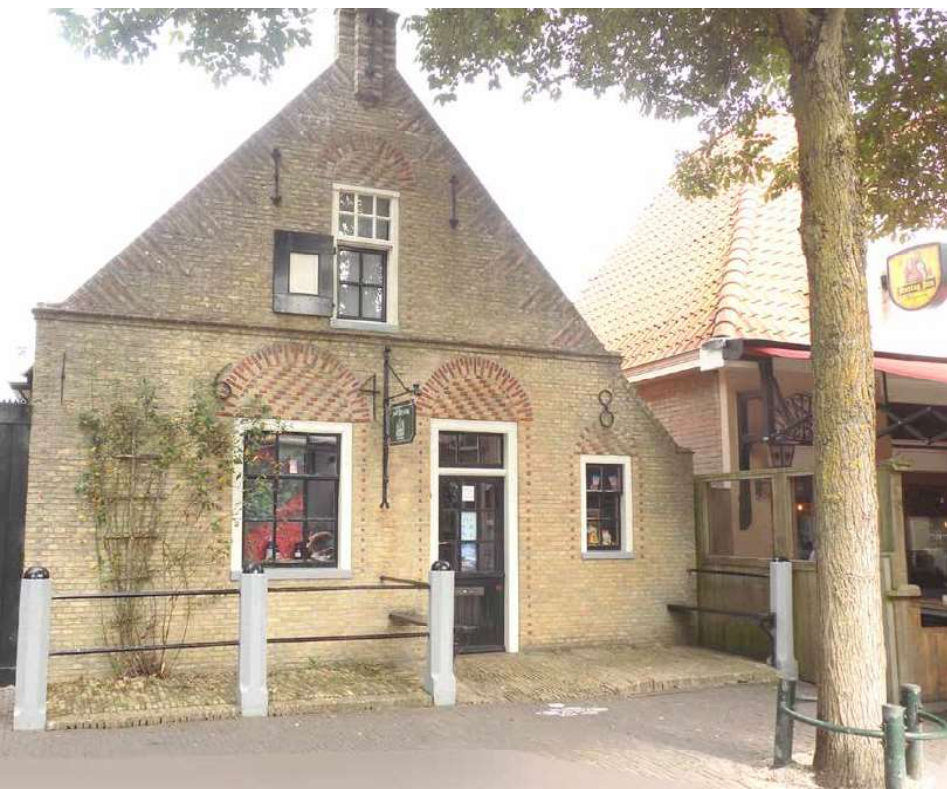
Gevel Oosterburen 23.

Onze route start bij een van de dertien rijksmonumenten die het dorp rijk is: Oosterburen 23. Een oud pandje met muurankers die het jaartal 1648 vormen. Vandaar lopen we in oostelijke richting de straat uit tot aan de Oude Terpweg, die naar de Strieper polder leidt. Uiteindelijk draait de route via het Oud Wagenpad en het Strieper kerkhof weer Midsland in en wordt de rondleiding afgesloten bij – en ín – de Meslanzer kerk. Het blijkt een wandeling van – afhankelijk van hoeveel je als gids vertelt – anderhalf à twee uur.