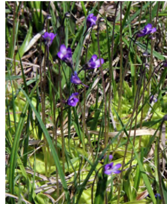
Twee zeldzame planten van kalkmoerassen in het Bevrijde Land: Vetblad is na een paar jaar verdwenen (juni 2013, links); Parnassia breidt zich nog steeds uit (augustus 2022, rechts).

Blog van 29 mei 2022 op https://schepping.org .