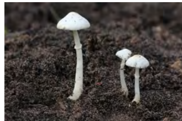
Parasolzwammen van het Parasolbosje: Grote parasolzwam (rij 1, links), Vaalroze parasolzwam (rij 1, rechts), Piekhaarparasolzwam (rij 2, links), Fijnschubbige parasolzwam (rij 2, rechts), Oranjebruine parasolzwam (rij 3, links), Spitschubbige parasolzwam (rij 3, rechts), Verkleurzwammetje (rij 4, links), Witte champignonparasol (rij 4, rechts).