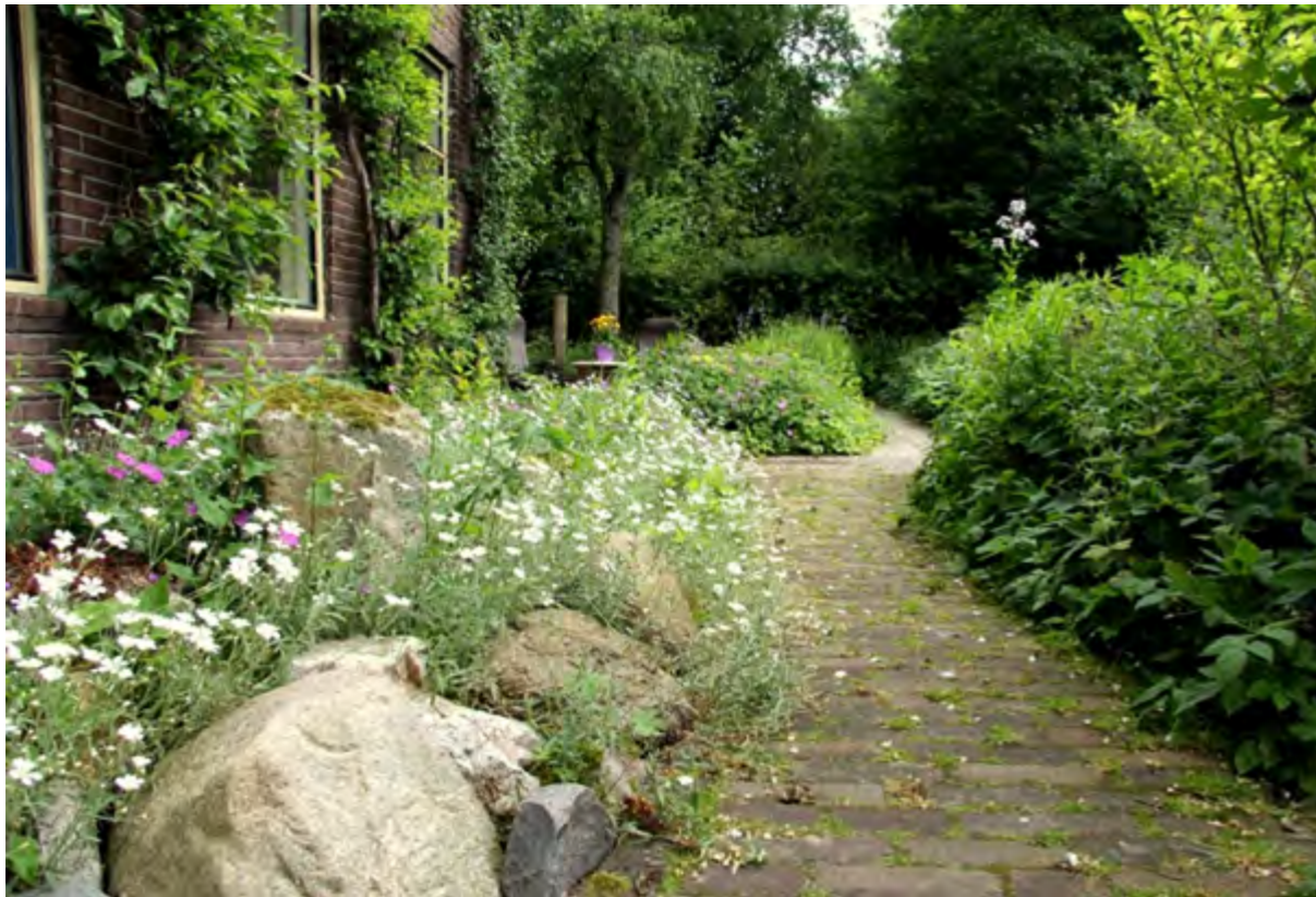
De voortuin met het Stenen Bruidsbed en leibomen tegen de zuidmuur (mei 2014).