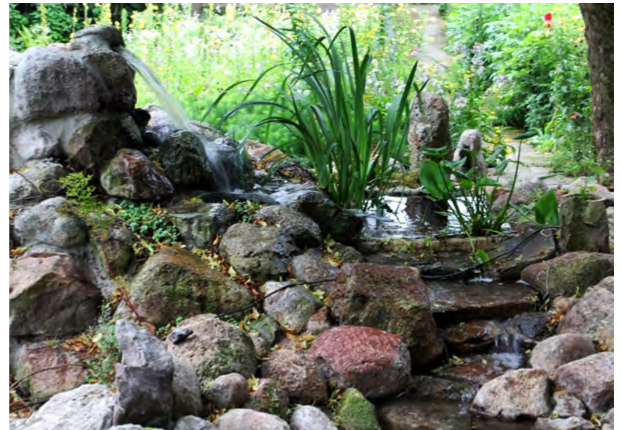
De waterval aan de oostkant van de Watertoren (boven) en de oorsprong van het beekje door de Puintuin aan de westkant van de Watertoren kort na de aanleg (onder, juli 2017).