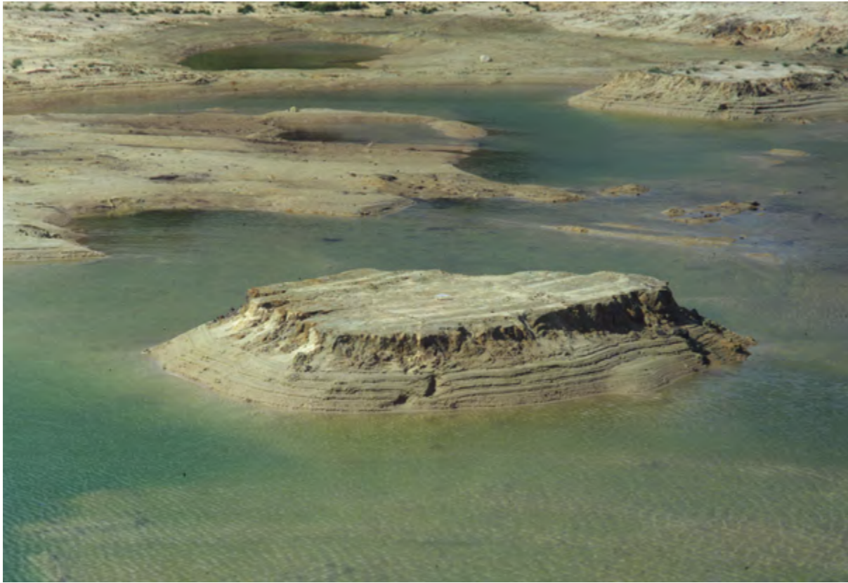
De Azuren Zomp is tot stand gekomen door scheppende arbeid op een maïsakker (augustus 1991).