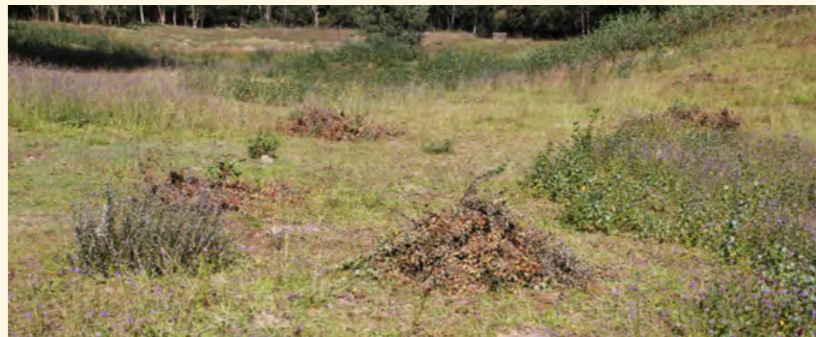
Het Bevrijde Land met hopen gerooide boompjes. Goed is te zien wat er nog moet gebeuren (mei 2022).

Gelukkig krijg ik bij de uitvoering af en toe hulp van anderen, vooral van Marieke.