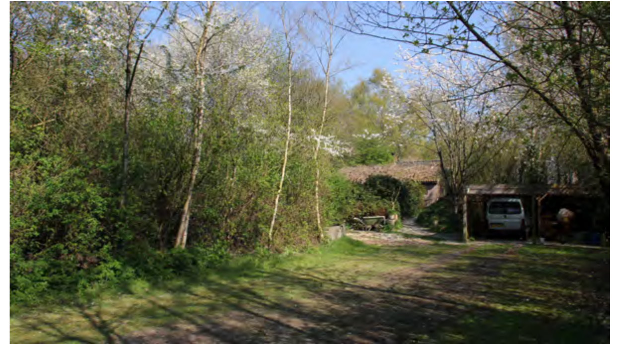
De parkeerplaats en carport omzoomd door bloeiende Zoete kers (april 2019).