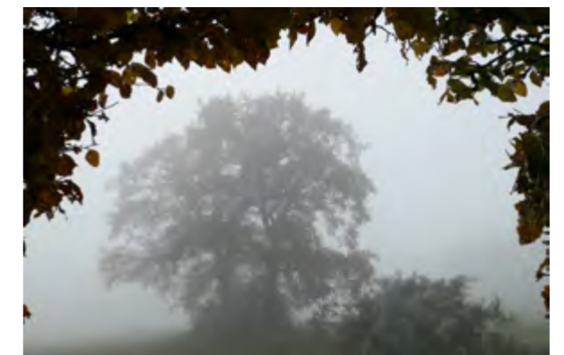
De heg voor het huis met het beukenpoortje in de winter (december 2012, boven). De buureiken aan de overkant van de weg, gezien door de poort in de beukenhaag, in verschillende seizoenen: winter (januari 2015), lente (april 2017) zomer (juli 2015) en herfst (november 2019).