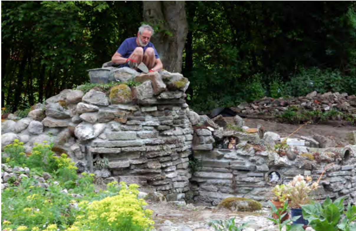
Metselend aan de Watertoren (mei 2017).

Zo gedacht, zo gedaan. Op de top van deze Watertoren heb ik een klein bassin geconstrueerd. Dit bekken kan via een ondergrondse flexibele buis worden gevuld met water dat met een elektrische dompelpomp uit de Lelievijver wordt opgepompt. Ik kan het bassin op twee manieren laten overstromen. De