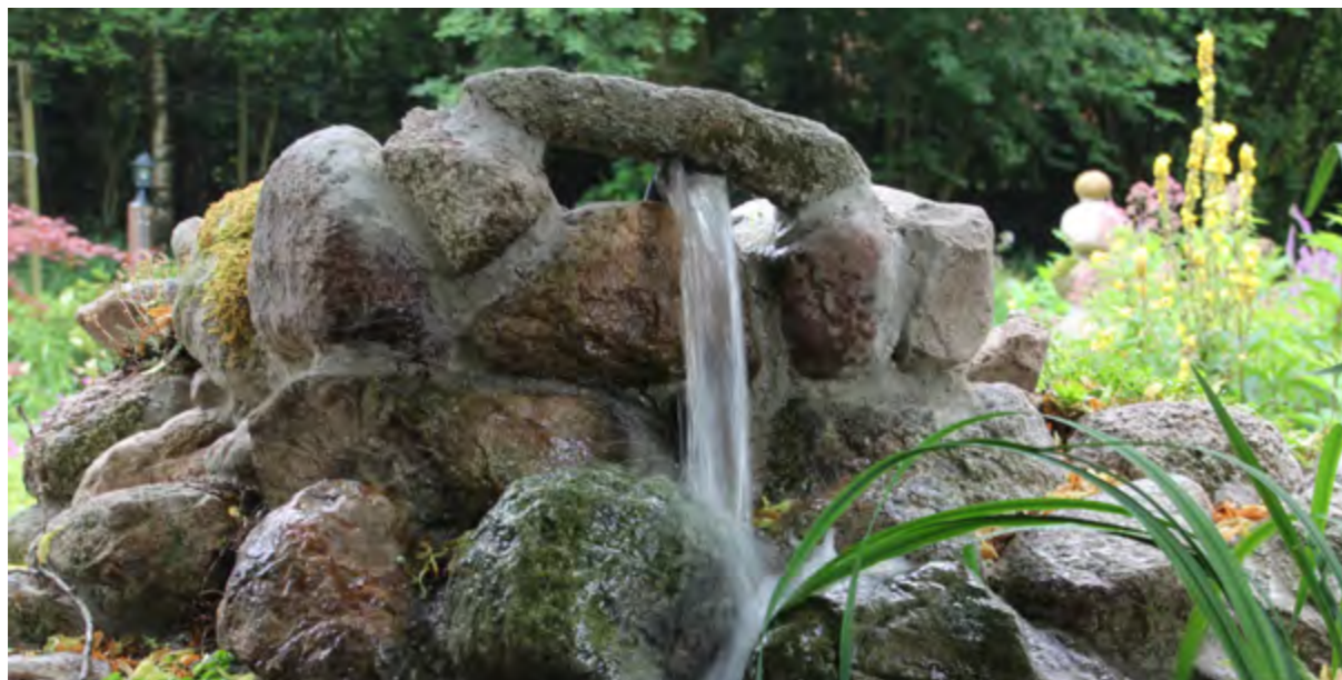
Het beekje door de Puintuin ontspringt op de top van de Watertoren (juli 2017).

kortste weg gaat via een luid klaterende, twee meter hoge waterval die vrijwel direct aansluit op de Lelievijver. Het water kan ook een langere weg afleggen via een beekje dat murmelend via stenen drempels een meter of tien door het vrijwel vlakke, schaduwrijke deel van de Puintuin meandert tot het terugvloeit in de vijver.