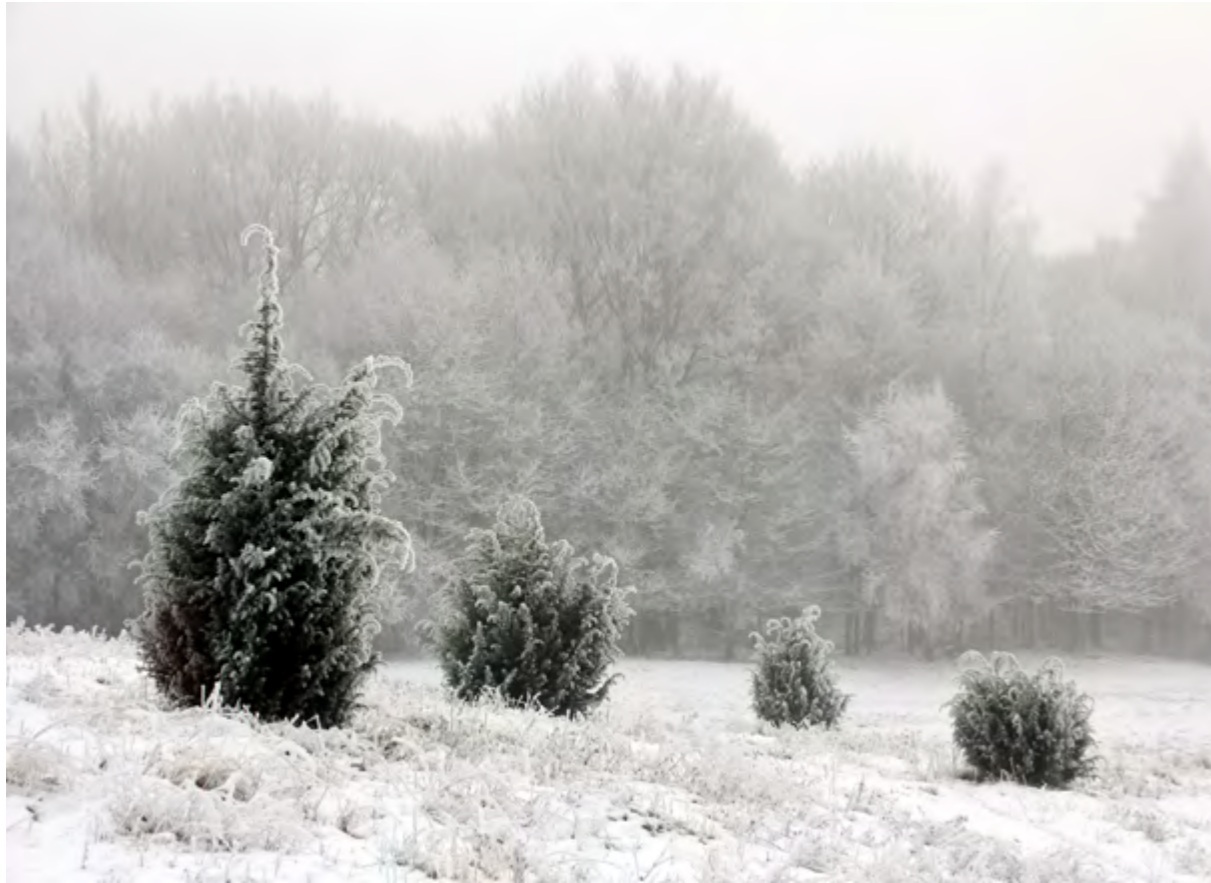
Berijpte jeneverbessen op de zuidhelling van Tao (januari 2017).

Spectaculair is de vestiging van Jeneverbes in het Bevrijde Land, vooral op de zuidhelling van Tao. De donkergroene struiken vallen van verre op en staan zo fraai opgesteld dat vrijwel iedere bezoeker aan Schepping ervan uitgaat dat ik ze heb aangeplant. De struiken zijn echter spontaan uit zaad gekiemd, de eersteling in 2003. Mogelijk zijn het nakomelingen van oude Jeneverbessen in het aftakelende struweel aan de noordkant van Schepping, dat beheerd wordt door Stichting Het Drentse Landschap. Daar heeft overigens nog geen verjonging door zaad plaatsgevonden.