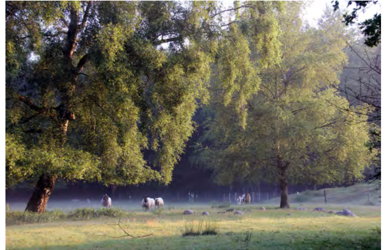
Schapenwei met Schoonebeeker heideschape (juni 2016).

Blog van 9 september 2021 op https://schepping.org .