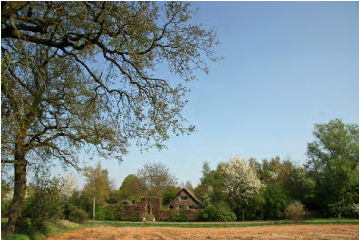
De woning achter de beukenheg vanaf het bouwland tegenover het huis (april 2009).