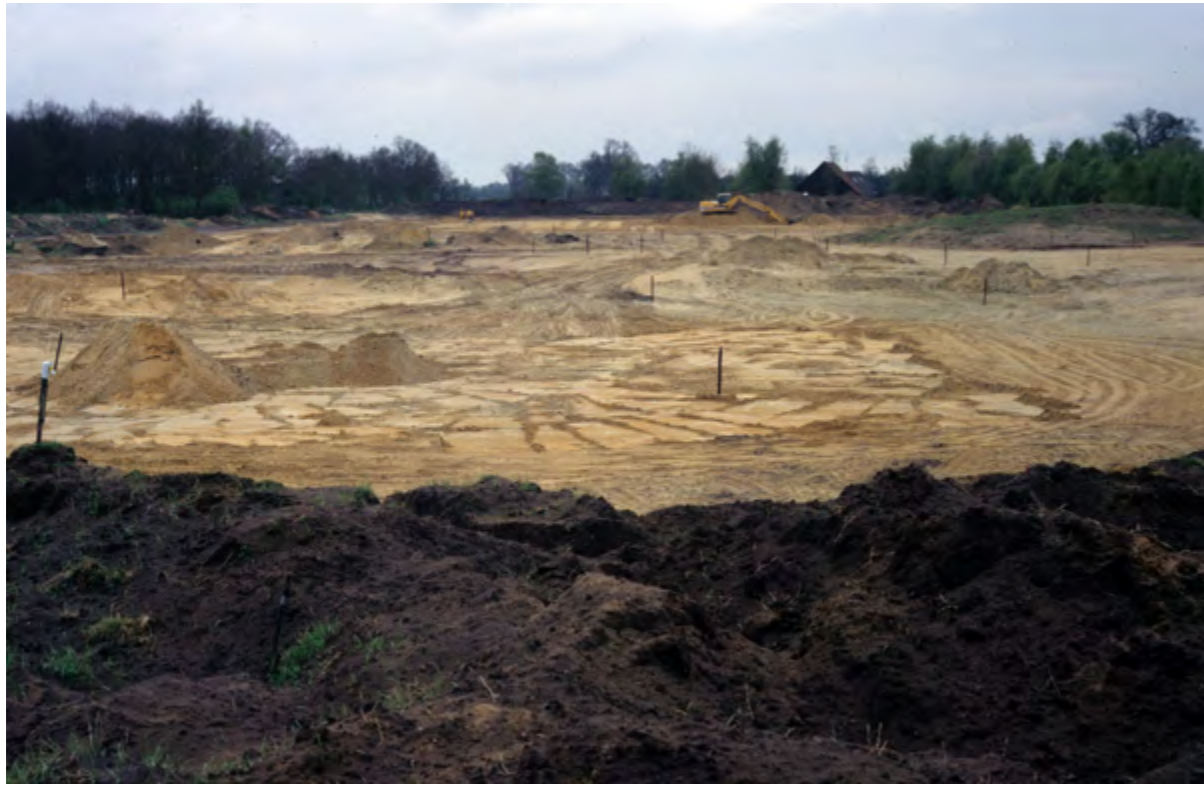
De eerste fase van de graafwerkzaamheden. De bemeste, humeuze bovengrond is rondom op wallen gedeponeerd (voorgond) en het bruikbare zand is grotendeels afgevoerd (mei 1991).