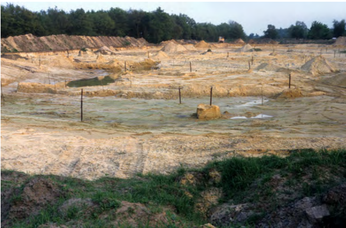
Een maand later vanaf vrijwel hetzelfde punt. Van onder het zand komt blauwgrijze keileem tevoorschijn en de eerste plas vult zich met grondwater. Op de palen in het terrein is aangegeven hoe diep er moet worden gegraven (juni 1991).