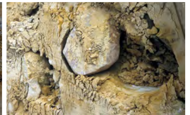
Op de zandvlakte ontstonden onder invloed van de wind fraaie ribbelpatronen en zandsculpturen (boven). Ondiepe leemplassen droogden op in krullen en barsten (midden). Bij het graafwerk kwam veelkleurige keileem aan de oppervlakte, rechts met zwerfkei (onder) (voorjaar 1991).