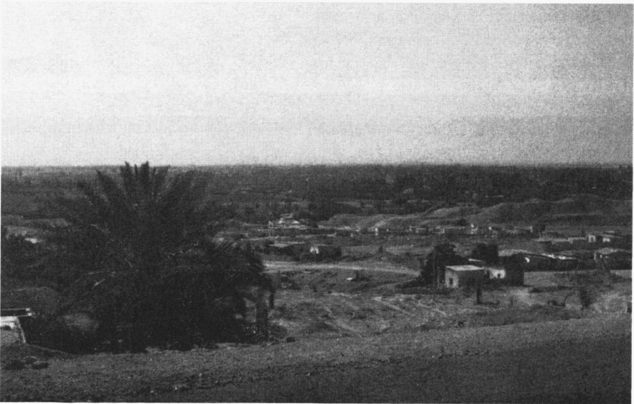
'Tell van Jericho'

In de negentiende eeuw kwam de Bijbelwetenschap tot grote bloei, terwijl de bijbelse oudheidkunde ook tot ontwikkeling kwam. Vandaar dat in 1865 door het Palestine Exploration Fund , gevestigd te Londen, opdracht werd verstrekt een volledig uitgewerkte kaart van Palestina te maken. Na een werk van zes jaar slaagde men erin 26 landkaarten uit te brengen van voortreffelijke kwaliteit.