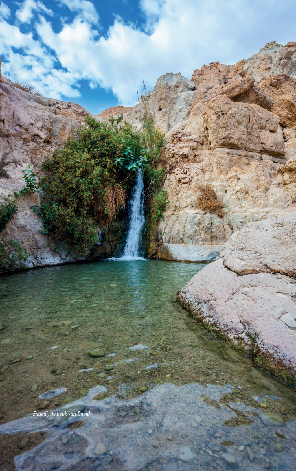
Engedi, de beek van David