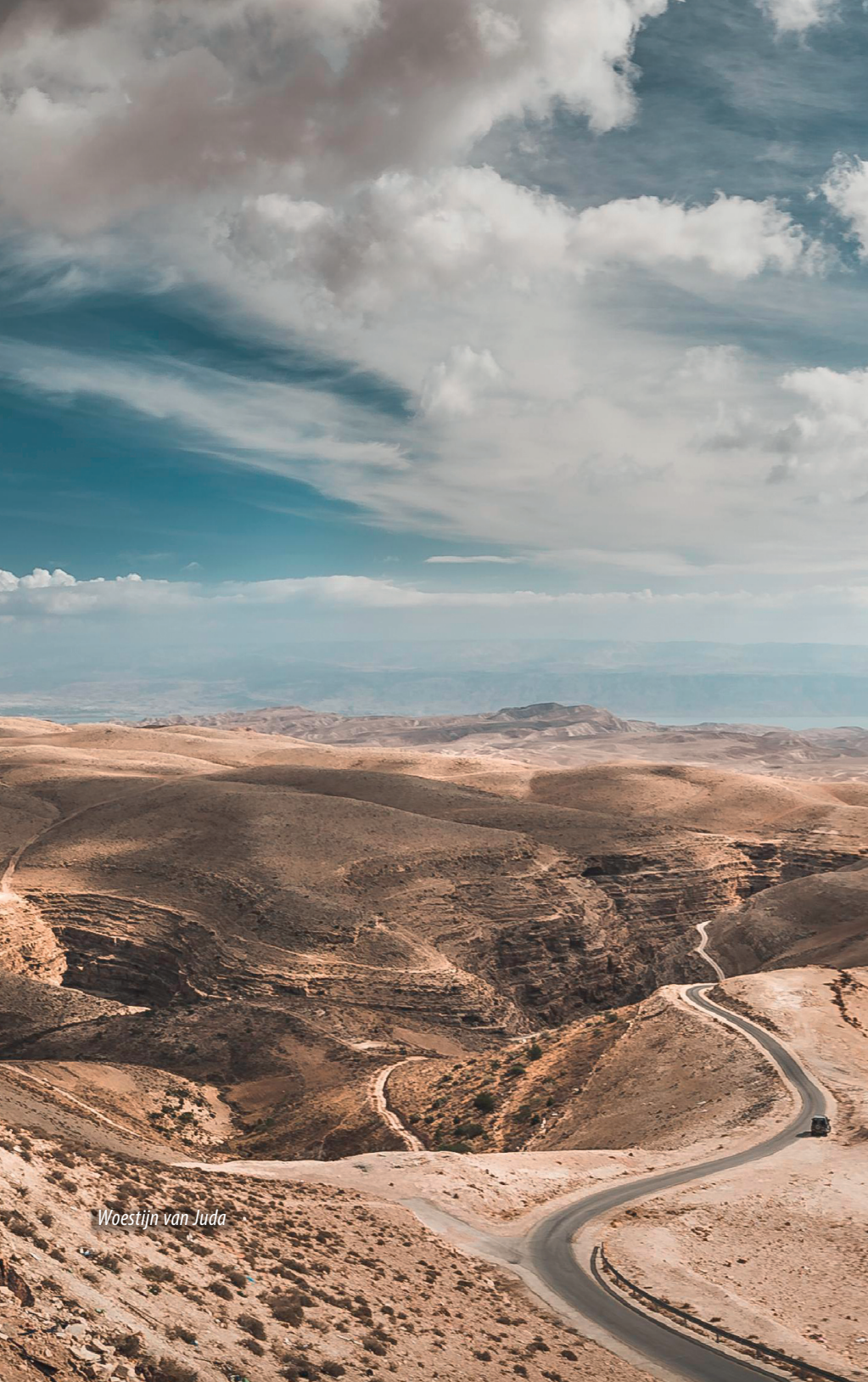
Woestijn van Juda