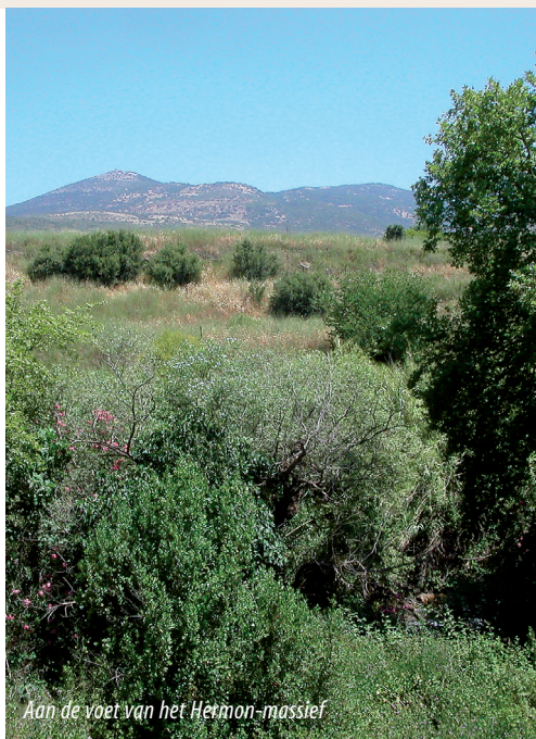
Aan de voet van het Hermon-massief

In dezelfde wintertijd als je op de Hermonhellingen op je ski's in de sneeuw kunt staan, kun je ook in badkleding waterskiën in de Golf van Eilat. Temperatuur- en neerslagverschillen zijn enorm. Als iemand vraagt wat de temperatuur in Israël is in mei moet je even doorvragen, anders zit je er zomaar 25 graden naast. Wat wil je ook, als je van 2200 meter boven zeeniveau op de Hermon afdaalt naar minus 400 bij de Dode Zee! De enorme verschillen in hoogte, temperatuur en regenval verklaren voor een deel ook de zeer uiteenlopende flora en fauna.