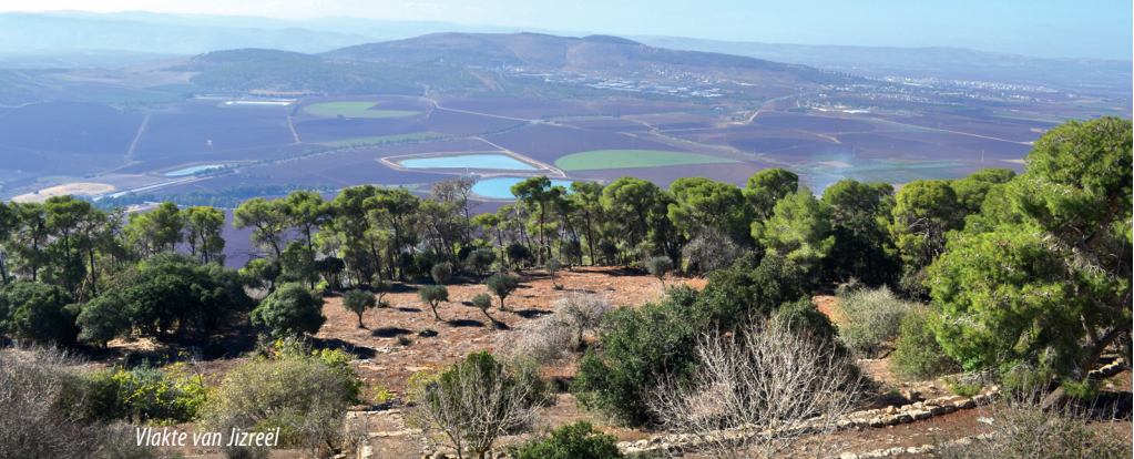
Vlakte van Jizre'el

In dit handboek vindt u weinig gegevens over demografische en economische zaken. Niet dat die niet van belang zouden zijn. Maar ze zijn zo veranderlijk in dit gebied, dat de data al onbruikbaar lijken voordat ze zijn gedrukt. Maar wie even de moeite neemt om naar de website van het Nederlandse Ministerie van Buitenlandse Zaken te surfen – www.minbuza.nl – vindt ruimschoots actuele informatie, inclusief nuttige consulaire gegevens.