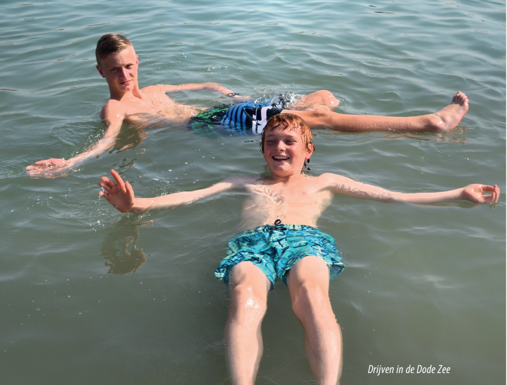
Drijven in de Dode Zee