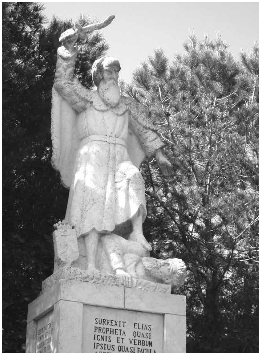
Het beeld van Elia bij het klooster van Muhraqa op de berg Karmel.