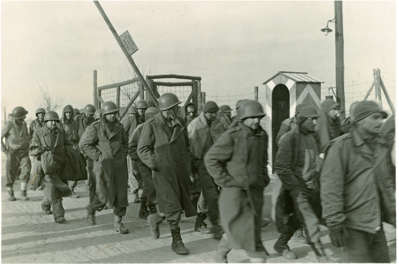
Gevangen Amerikaanse militairen arriveren in Stalag IV-b Mühlberg. In dagboeken van Nederlandse krijgsgevangenen wordt geregeld de aankomst van groepen Britse en Amerikaanse militairen gemeld, zelfs tot in het voorjaar van 1945!