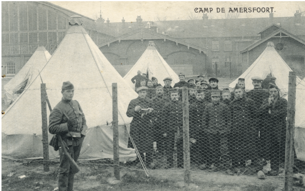
Tienduizenden militairen van diverse nationaliteiten belanden tijdens de Eerste Wereldoorlog in interneringskampen in het neutrale Nederland.

Tijdens de Eerste Wereldoorlog (1914-1918) interneerde het neutrale Nederland enkele duizenden militairen van beide zijden in het conflict. Deze Duitse, Engelse, Franse en Belgische militairen bezaten, zoals de term al aangeeft, niet de status van krijgsgevangenen maar van geïnterneerden. Het verschil tussen beide termen had te maken met de verhouding tussen de betrokken partijen of landen. Een land dat neutraal is, heeft de verplichting militairen van een oorlogvoerende staat te interneren als zij het grondgebied van dit land betreden. Gedeserteerde of anderszins in Nederland belande buitenlandse militairen werden dan ook door het Nederlandse leger geïnterneerd. In totaal zijn in de jaren 1914-1918 circa 36.000 buitenlandse militairen in Nederland vastgezet. 4