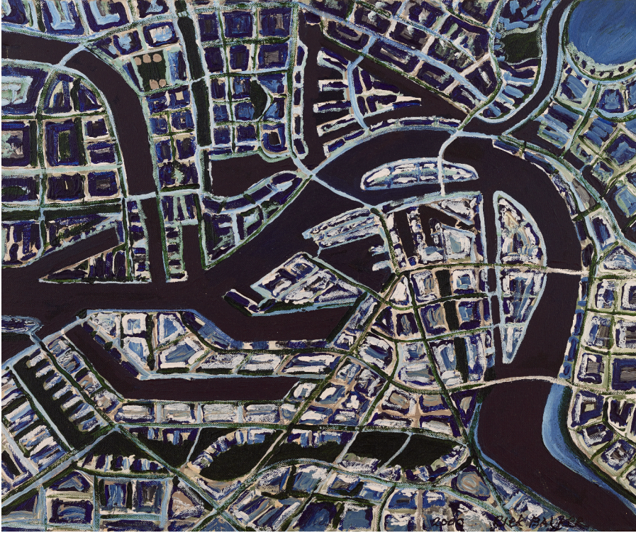
Kart Rotterdam, 2000