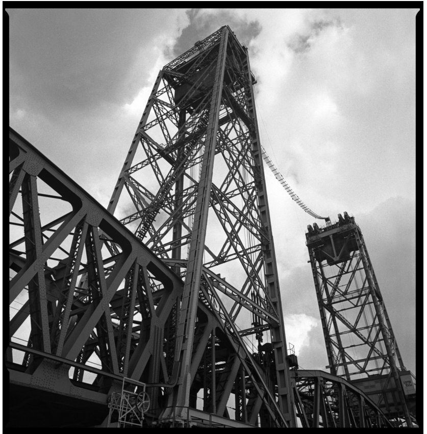
Ondanks de realisatie van de spoorwaaier besluit het gemeentebestuur de hef te behouden Foto: Arty Groenewald, 1967