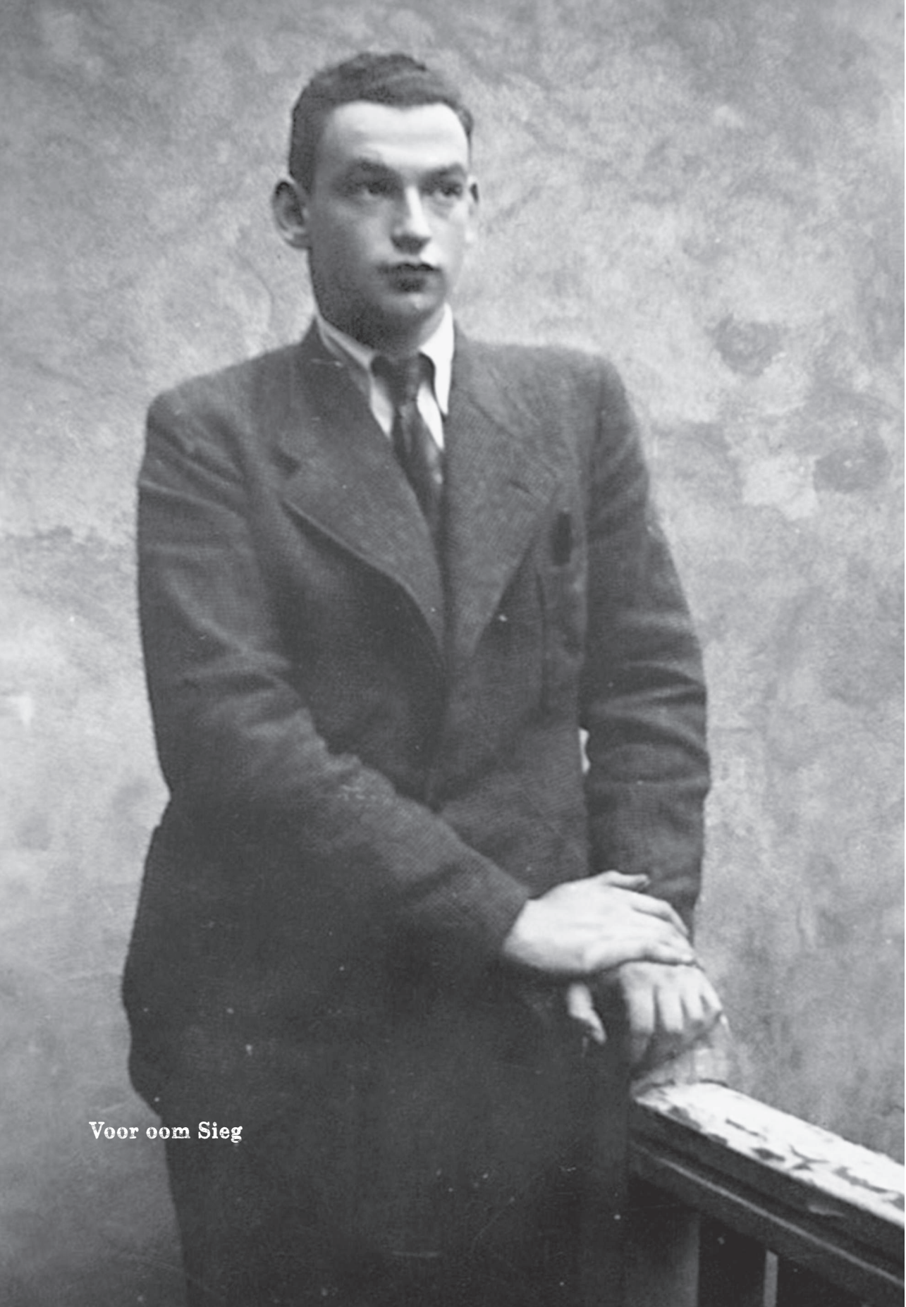
Voor oom Sieg