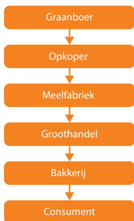
Figuur 2 De bedrijfskolom van bakkersproducten