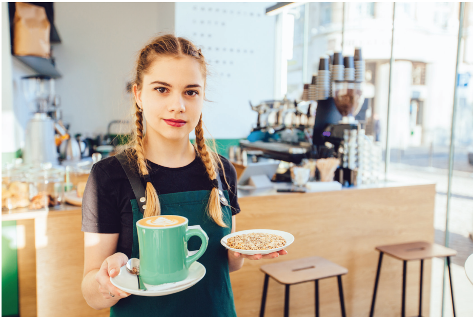
Het voorraadbeheer in horecabedrijven is bewerkelijk. Een van de factoren waarmee je rekening moet houden is het risico op bederf (foto: Shutterstock/Iryna Inshyna).

Ieder bedrijf streeft naar financiële voorspellingen die zo realiteitsgetrouw mogelijk zijn. Fouten in calculaties kunnen leiden tot probleemsituaties. Er wordt dan bijvoorbeeld veel te veel geld geïnvesteerd in voorraad ten opzichte van de verkoop. In het slechtste geval kunnen onjuiste voorspellingen leiden tot het faillissement van de onderneming.