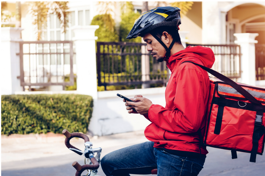
In enkele jaren tijd is het distributieonderdeel in de meso-omgeving van Nederlandse afhaal- en bezorghoreca fors veranderd.