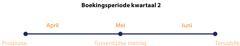
Figuur 3 De tijdslijn van een boekingsperiode kent drie meetmomenten: prognose, tussentijdse meting en terugblik

De drie financiële overzichten (balans, winst-en-verliesrekening en liquiditeitsoverzicht) worden opgesteld voor een boekingsperiode. In een boekingsperiode bestaan een prognose, een tussentijdse meting en een terugblik op de drie financiële overzichten.