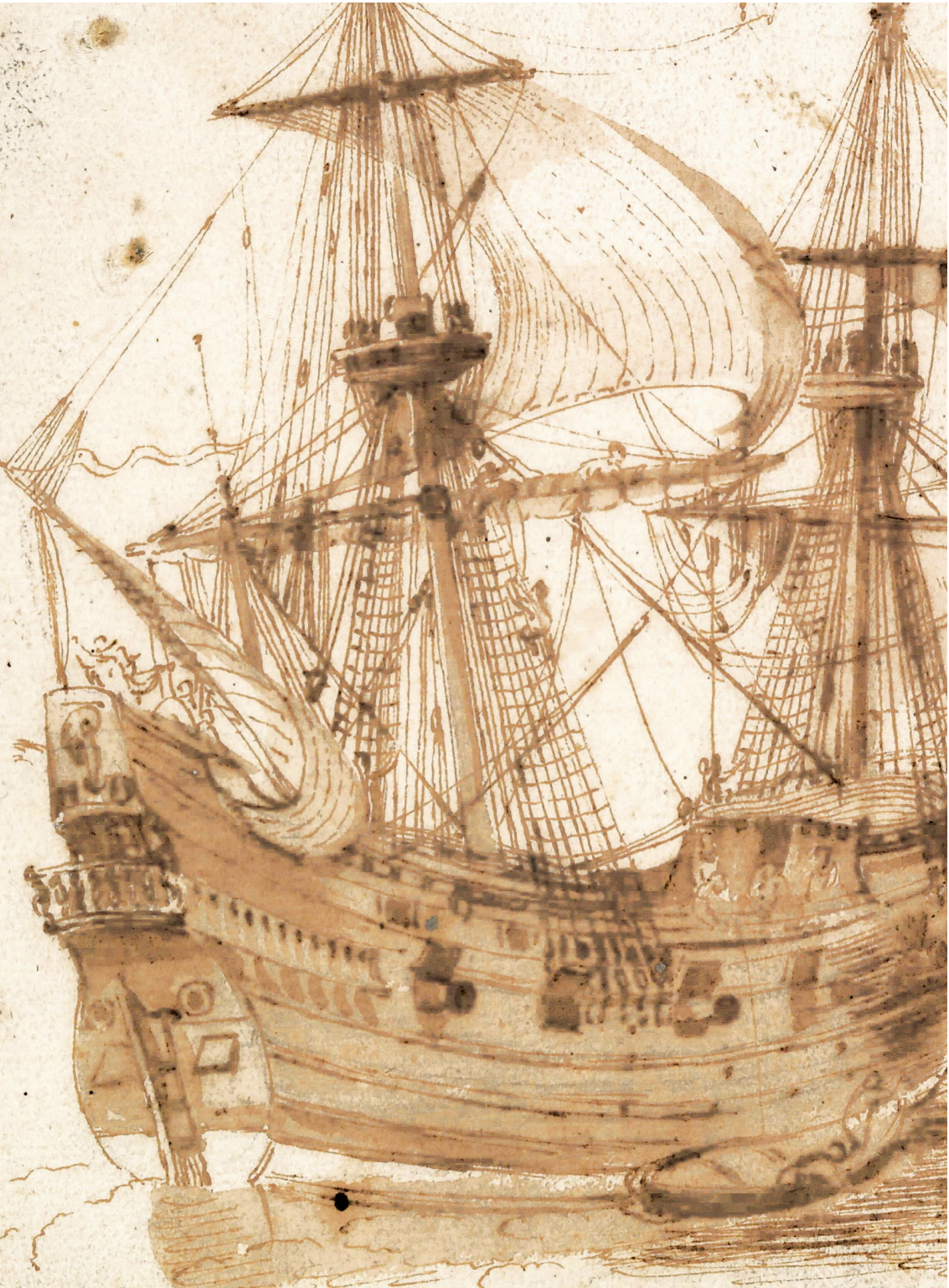
Een gewapende koopvaarder, vergelijkbaar met 'De Pauw' van Reinier Pauw. Pentekening van Hendrik Cornelisz Vroom, 1600.