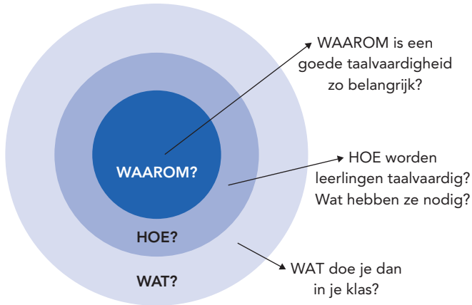
Figuur 1 De gouden cirkel (Sinek, 2009)

kunt doen om je taalonderwijs te versterken. Je leert daarvoor de zeven basisprincipes kennen en hoe je stap voor stap je lessen kunt versterken.