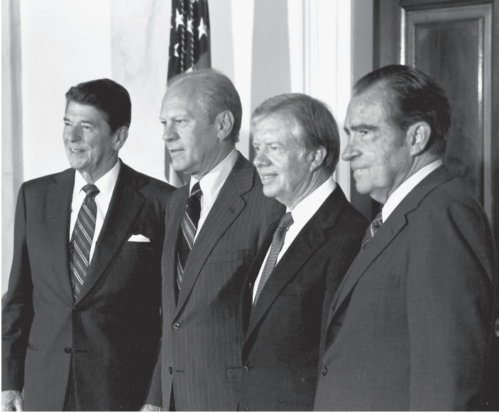
President Reagan met de ex-presidenten Ford, Carter en Nixon, poserend voor hun reis naar de begrafenis van Sadat in 1981.

harnas, al dan niet door moordenaarshand – maar liefst een kleine achttien procent. Dat betekent niet per se dat zij postuum niet van betekenis waren, dat werden zij soms zelfs juist dóór hun dood, maar slechts dat zij geen actieve pensioentijd meer hadden. Voor alle presidenten die hun ambtstermijn overleefden gold en geldt dezelfde vraag: hoe vul ik mijn leven als gewoon burger in? Iedere normale sterveling moet al op zoek naar een zinvolle levensvulling na de pensionering, wanneer de routine van een betaalde baan en de werkomgeving, waarin vriendschappen zijn ontstaan, successen worden gevierd maar ook frustraties voorkomen, wegvallen. Die uitdaging is nog vele malen groter als dit een pensioen na het presidentschap betreft. Moderne presidenten staan vierentwintig uur per dag ‘aan’, dragen de verantwoordelijkheid voor een supermacht en worden ook nog eens gezien als de leider van de vrije wereld. Dat duurt tot klokslag twaalf uur op de dag van de inauguratie; na de eedaflegging van hun opvolger valt alle macht en verantwoordelijkheid in één klap weg. Wég is de machtspositie,