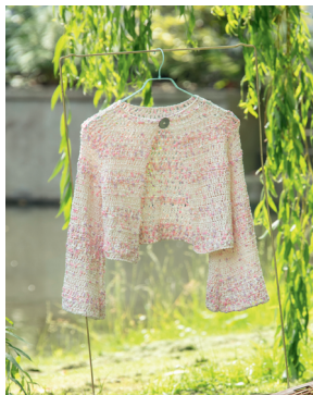
34 JULI Vestje van Splash!