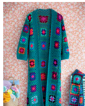
74 NOVEMBER Granny-vest