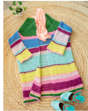
56 SEPTEMBER Gestreept lang vest