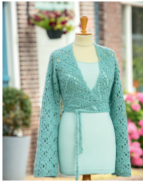
28 JUNI Pluizig wikkelveestje