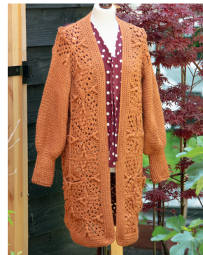
66 OKTOBER Reliëf gehaakt vest