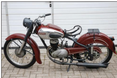
Sparta 200 cc