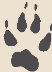
Dit is zijn pootafdruk