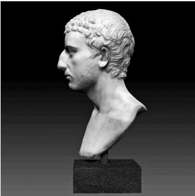
Borstbeeld waarvan gedacht wordt dat het Flavius Josephus verbeeldt

Ik ben van niet onaanzienlijke afkomst, want ik stam uit een oud priestergeslacht. Ieder volk heeft zijn eigen criterium voor een edele geboorte, bij ons is de verbondenheid met het priesterschap het zekere bewijs van een eervolle afstamming. Mijn voorouders waren geen gewone priesters. Zij voerden hun afkomst terug tot de eerste van vierentwintig priesterafdelingen – op zichzelf al een zeer bijzondere onderscheiding – en daarin tot de meest vooraanstaande clan. Bovendien ben ik van moederszijde van koninklijke afkomst, want de nakomelingen van Asomonaeus, van wie zij afstamt, waren zeer lange tijd hogepriesters en koningen van ons volk. 1