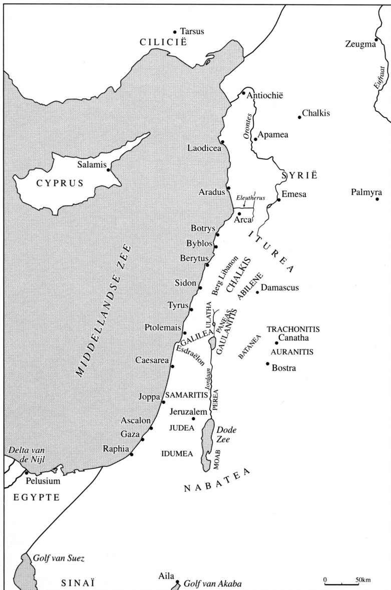
Het oostelijke Middellandsche Zeegebied