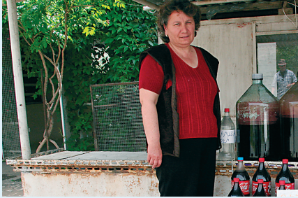
Areni-wijn te koop in Coca-Cola-flessen, vooral bedoeld voor chauffeurs uit het islamitische Iran.