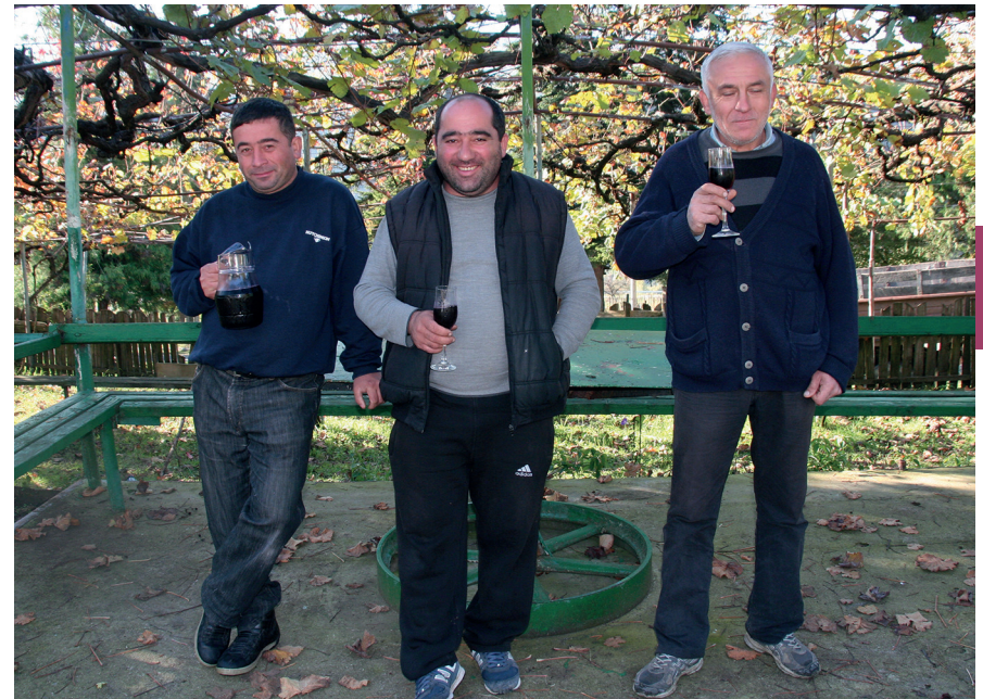
Georgiërs stellen het zeer op prijs wanneer je hun zelfgemaakte wijn proeft.