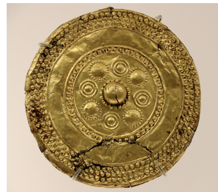
In de oudheid stond goudbewerking in Colchis op een hoog ontwikkeld niveau, veel is bewaard gebleven en permanent tentoongesteld in het Georgisch Nationaal Museum (Tbilisi).

Al een eeuw later krijgt de kerk in Georgië een autonome status waardoor ze kan uitgroeien tot een nationale Georgische kerk waarin de Georgiërs zelf de belangrijkste rol gaan spelen in de heiligenlevens. De bisschop van Mtscheta heet voortaan katholikos en die is nog altijd het hoofd van de