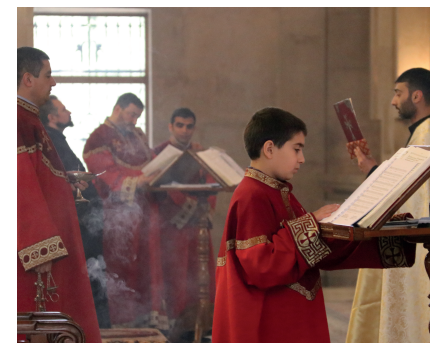
Jerevan kent een keur aan Armeens-apostolische kerken waar je regelmatig de heilige mis kunt bijwonen.

Kort voor de Haghtanak-brug kun je vanaf de Masjtots naar rechts de Gregorius-de-Verlichter-straat in slaan. Hier vind je een grote concentratie aan stadsparken, waarvan het Theaterpark het prettigste is. Niet zo ver hiervandaan ligt aan de Tigran Mets Avenue een enorm monument van een strijder met een vervaarlijk zwaard in de hand zittend op een paard. Dit is generaal Zoravar Andranik , die in 1918 de Turken versloeg bij het plaatsje Sardarapat. Achter hem zie je de Sint Gregorius-de-Verlichter-kathedraal opdoemen, de grootste kathedraal van Armenië. Deze is gebouwd ter ere van het 1700-jarig bestaan van het Armeense christendom en is in 2001 in gebruik genomen. In de kathedraal is het veel lichter dan in andere Armeens-apostolische kerken. Reden is het grote aantal ramen dat de kathedraal rijk is. De kerk is vernoemd naar de Armeense heilige Sint-Gregorius, wiens relikwieën in deze kathedraal zijn ondergebracht.