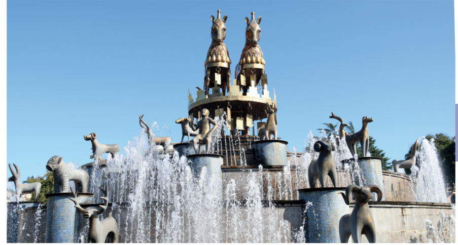
Deze fontein in Koetaisi-centrum verwijst naar de 'gouden jaren' van het Colchis-tijdperk.

De belangrijkste bestemming in Imeretië is de hoofdstad Koetaisi, aan de rivier de Rioni . Na Tbilisi en Batoemi is Koetaisi de grootste stad van Georgië. Al in de tijd van het oude koninkrijk Colchis vervulde Koetaisi een spilfunctie. Nadat koning Bagrat III in de gouden eeuw West- en Oost-Georgië had verenigd, riep hij Koetaisi tot hoofdstad uit. Zijn opvolger, David de Bouwer, Georgië's beroemdste koning, werd in deze stad tot koning gekroond. Maar later riep hij Tbilisi uit tot nieuwe hoofdstad van zijn rijk en dat zou deze stad met de nodige onderbrekingen tot op de dag van vandaag blijven. Om de historische rol van de stad te benadrukken werd op initiatief