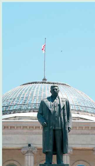
Tot 2010 stond op het Stalinplein in Gori nog een metershoog standbeeld van Josif Stalin.