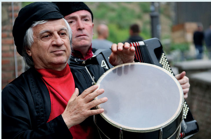
Georgiërs zijn een muzikaal volk, overal in het land kom je straatartiesten tegen.