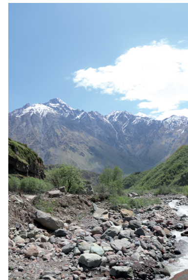
Een vergezicht in Chevi dat aan Rusland grenst.

De Georgische militaire weg bereikt de Russische grens in de regio Chevi, waar ook de op twee na hoogste bergtop van Georgië ligt: Kazbek . Deze geniet al bekendheid in de klassieke oudheid dankzij de legende over Prometheus; de held van het verhaal wordt op een gegeven moment namelijk vastgeketend aan een berg in de Kaukasus en dat zou de Kazbek zijn geweest. De Georgiërs kennen een eigen versie van deze legende waarin niet Prometheus maar de Georgische Amiranani de hoofdrol speelt. De hellingen van deze 5047 m hoge berg zijn erg steil. Kazbek is geliefd bij alpinisten, mede omdat de berg relatief dicht bij Tbilisi ligt. Men beklimt de berg meestal vanuit het zuidoosten via de Gergeti-gletsjer waarbij de Bethlemi-hut een belangrijke overnachtingsplaats is.