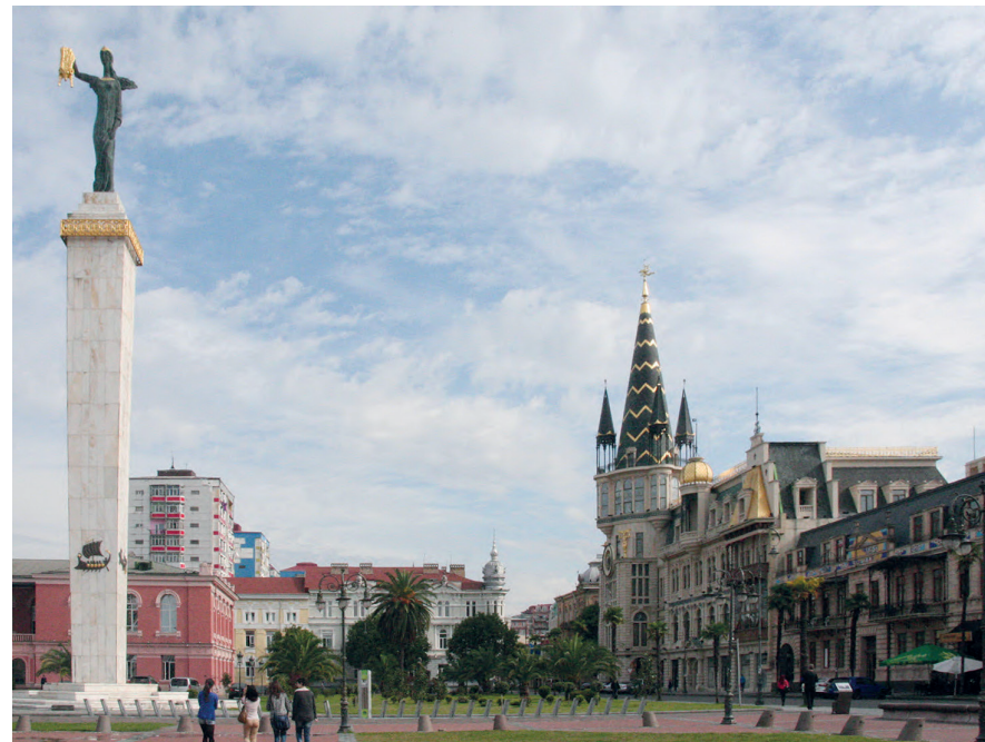
Het Europaplein met het goudkleurige standbeeld van Medea met het Gulden Vlies in de handen.