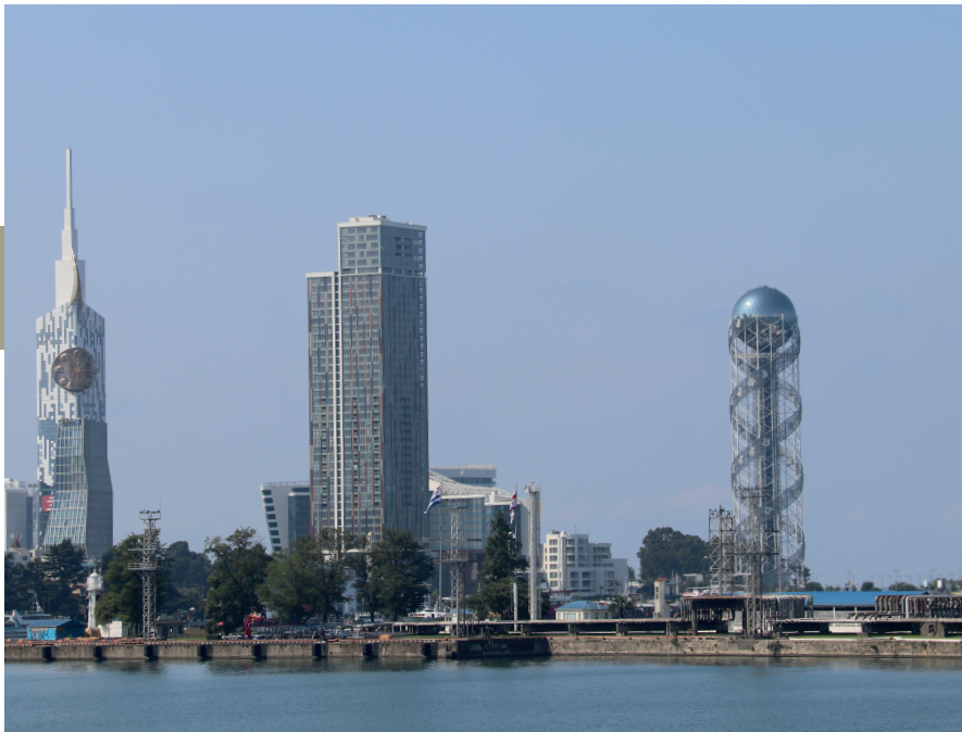
De hypermoderne skyline van het extravagante Batoemi.