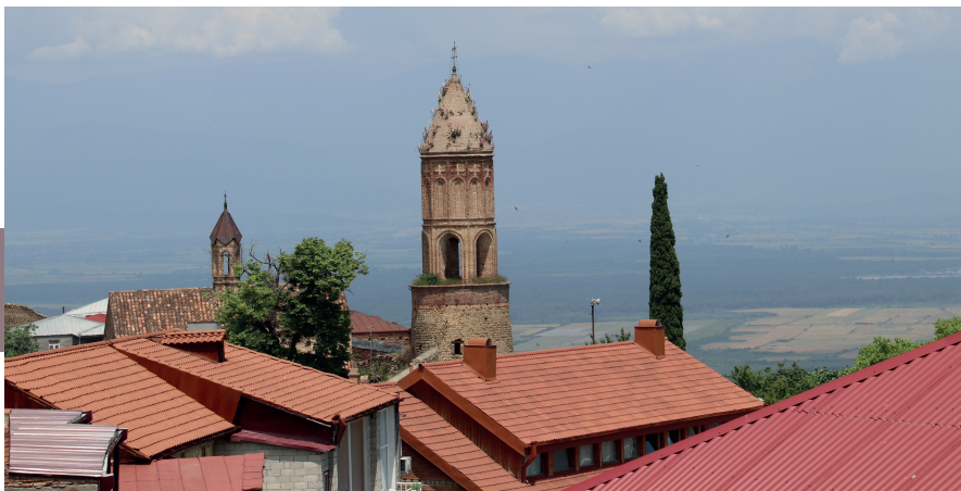
Signaghi maakt op afstand een Toscaanse indruk.