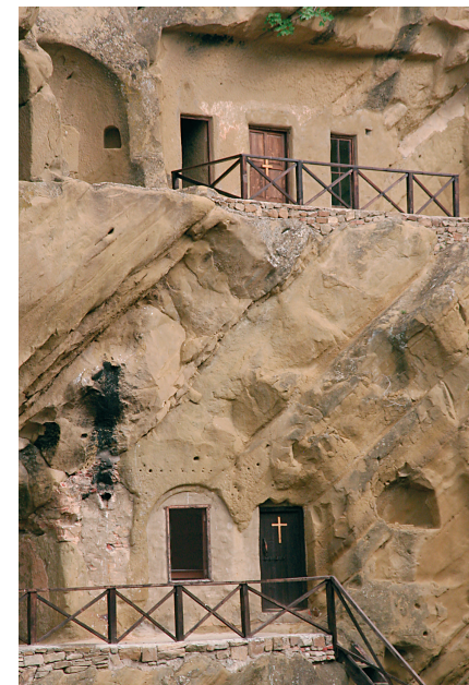
Grotwoningen in het Lavra-klooster.

➤ PIROSMANI-HUISMUSEUM & NIKO PIROSMENI STAATSMUSEUM . Geopend: di.–zo. 10–17 uur.