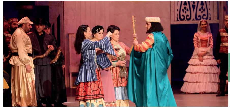
De uitvoering van een Armeense opera in de Armeense taal.

De succesvolste 20ste-eeuwse Armeense schilder, Martiros Sarjan (1880–1972) is vooral bekend geworden om zijn veelkleurige landschappen. Een van zijn leerlingen is de geliefde Minas Avetisjan (1928–1975), die onder meer (veelkleurige) historische doeken heeft geschilderd met thema's als de Armeense genocide. Net als veel andere kunstenaars ondervond Avetisjan grote problemen met de communistische machthebbers vanwege het heersende socialistisch-realisme. Zij zijn onder meer verantwoordelijk voor het in brand steken van zijn studio, waarbij veel van zijn werk verloren is gegaan. Andere kunstenaars kozen er daarom voor uitsluitend underground te werken. Pas sinds de Armeense onafhankelijkheid kunnen schilders weer alles maken wat ze willen zonder te worden lastiggevalen door de autoriteiten. Vooral in Jerevan zie je een grote opbloei van schilderkunst. Er zijn meerdere kunstgalerieën en verschillende kunstmarkten in de open lucht.