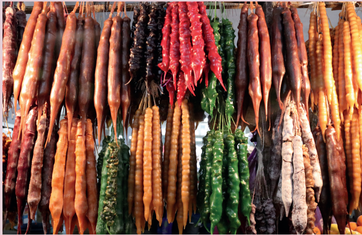
Tsjoertchela – in druivensiroop gedrenkte en aan een touwtje geregen noten, ook wel de Georgische snickers genoemd.