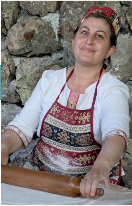
Armenië kent een kleinschalige economie waar oude ambachten nog springlevend zijn.