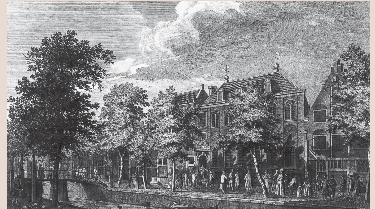
Armeense kerk gaat uit in Amsterdam (gravure 1788).

Veel Armeniërs vluchten al in deze periode naar Europa of Azië en er ontstaat een belangrijke Armeense diaspora. Achterblijvers vormen een christelijke minderheid in een moslimomgeving. Het westelijke deel wordt deel van het Ottomaanse Rijk, het oostelijke wordt Perzisch. Dat de Armeniërs er in deze eeuwen toch in slagen hun eigen culturele identiteit te behouden, is vooral