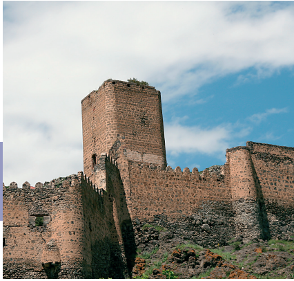
Het 9de-eeuwse Chertvisi-fort torent boven de Mtkvari-rivier uit.