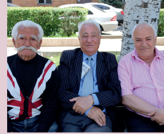
Nadat ze vaak tientallen jaren in Rusland hebben gewerkt, kiezen veel gepensioneerde Armeniërs ervoor om hun laatste jaren in hun geboorteland door te brengen.

Keuterboertjes en herders vormen samen met kleine handelaars de ruggengraat van de huidige Armeense economie, die sinds het uiteenvallen van de Sovjet-Unie een ware metamorfose heeft ondergaan. Het hoog geïndustrialiseerde, maar grondstofarme Armenië bleef toen abrupt verstoken van energiebronnen en grondstoffen uit de andere Sovjetrepublieken. Doordat ook de enige kerncentrale in het land, Metsamor, buiten werking werd gesteld vanwege een verwoestende aardbeving in het noorden van het land, kwam de Armeense economie in een vrije val terecht. En mede doordat het land in oorlog raakte met buurland Azerbeidzjan vanwege Nagorno Karabach, werd het land vrijwel volledig van de buitenwereld geïsoleerd. De economie kenmerkte zich toen door torenhoge inflatie, achterstallige lonen en betaling in natura. De schaduw economie was heer en meester en de verschillen tussen arm en rijk werden extreem. Aan de ene kant had je de rijke en machtige oligarchen die leefden in weelde, terwijl de ruime meerderheid van de bevolking onder de armoedegrens terechtkwam. Ook de corruptie