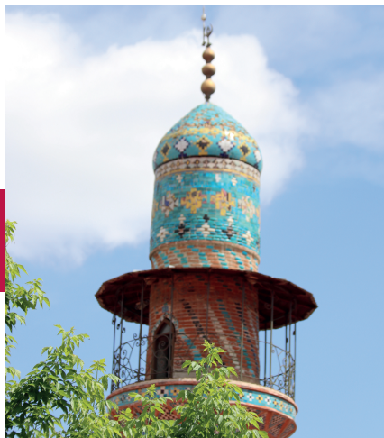
De minaret van mooi gerestaureerde Blauwe Moskee in Jerevan.