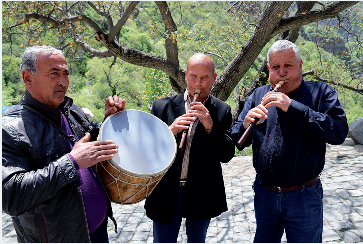
Overal in Armenië kom je straatmuzikanten tegen, van wie er in ieder geval een persoon de doedoek bespeelt.