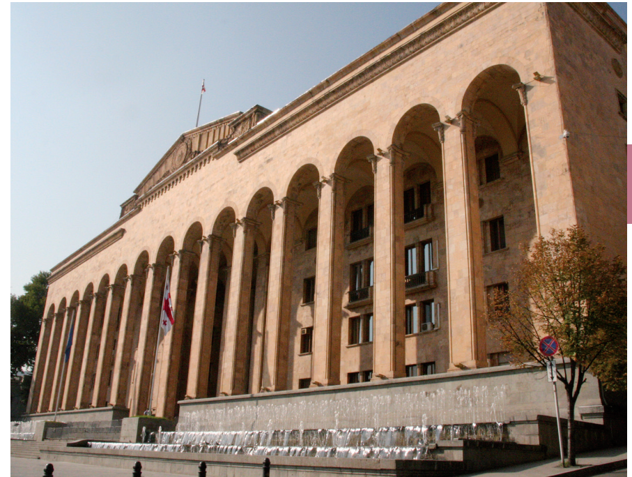
Het voormalige Georgische parlement aan de Roestaveli Avenue.

De grens tussen Oud-Tbilisi en het 19de-eeuwse stadscentrum loopt over de bij de rivier de Mtkvari startende Baratsjvili-straat, die overgaat in de Poesjkin-straat en eindigt op het Vrijheidsplein, het Tavisuplebis Moedani. Vanaf dit plein start de belangrijkste straat van Tbilisi, de Roestaveli Avenue. Je vindt in dit stadsdeel veel neoclassicistische gebouwen met daarin kantoren, luxe winkels en uiteenlopende restaurants. Het waren de Russen die dit stadsdeel in de 19de eeuw zo hebben vormgegeven, beginnend bij het Vrijheidsplein dat aanvankelijk Jerevan-plein heette en onder het communisme Lenin-plein. Op de plek waar nu het Monument van Vrijheid en Overwinning staat (met op de top een bronzen beeldje van Sint-Joris en de draak) pronkte tot 1990 nog het standbeeld van Sovjetleider Vladimir Lenin.