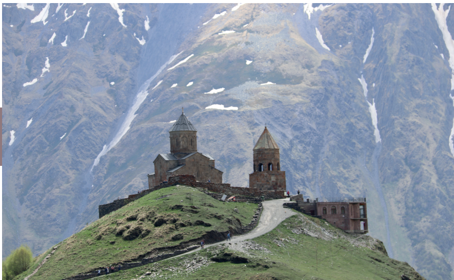
De 14de-eeuwse Tsminda Sameba-kerk in Gergeti ligt op 2170 m hoogte.

de andere veelal vervallen kloosterkerken en -gebouwen zijn ook fresco's te zien. Overigens kost het al snel 40 minuten om over de steile weg naar het klooster te lopen, maar deze inspanning wordt beloond met een werkelijk fantastisch uitzicht over het als een verlaten woestijn aandoende landschap, dat deels in Azerbeidzjan ligt. Kijk wel heel goed uit voor slangen, die je hier overal tegenkomt (ook al onderweg naar de kloosters).