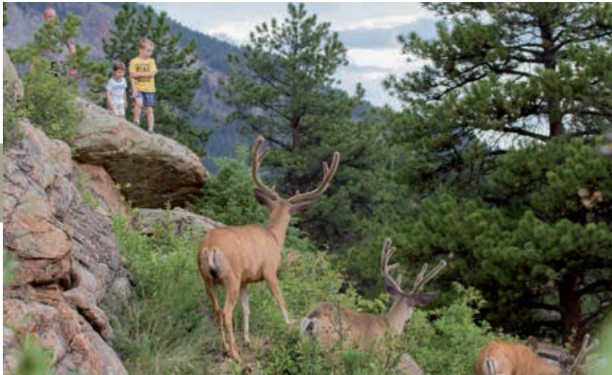
Veel herten zijn hun natuurlijke schuwheid kwijt.

werd ingenomen. Twaalf jaar later kwamen de Spanjaarden terug en namen opnieuw bezit van New Mexico. Het conflict tussen het Amerikaanse leger en de Apache en Navajo mondde uit in deportatie van de natives en is de geschiedenis ingegaan als de Long Walk (zie kader p. 188).