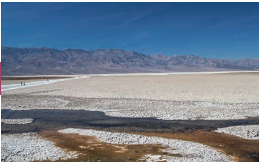
Badwater, Death Valley: met 87 m onder de zeespiegel het laagste punt van het land.