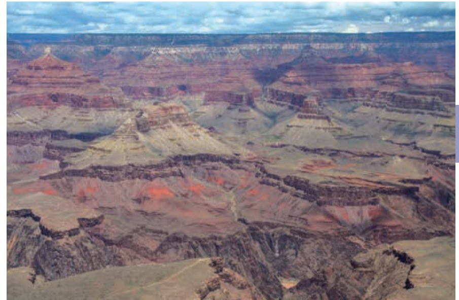
Bright Angel Trail, naar de bodem van de Grand Canyon; je kunt goed zien dat er een wirwar van kloven is ontstaan.