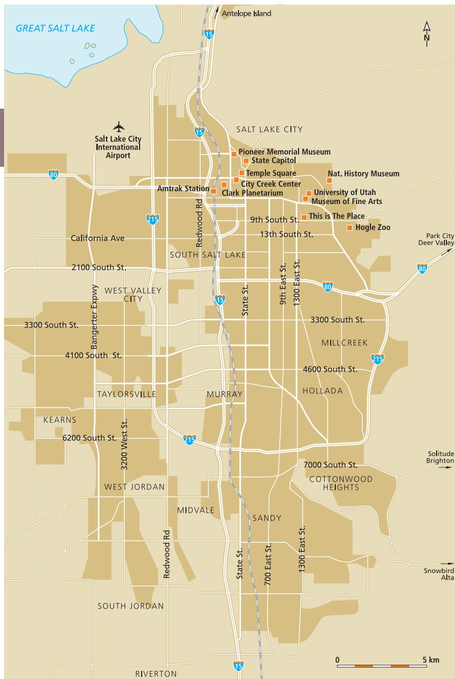
Salt Lake City