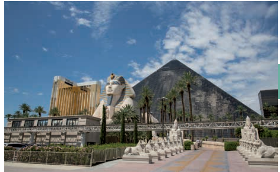
Niet ver van de woestijn misstaan de piramide en de sfinx van Luxor niet.

Het Mandalay Bay heeft ruim 3300 kamers. Een grote attractie achter het hotel vormt het Shark Reef Aquarium, waar je in een tunnel grote haaien, roggen en groene zeeschildpadden ziet. In kleinere aquaria leven koraalduivels en kleinere haaiensoorten. In zoetwaterbassins leven krokodillen en reptielen, in de Jungle leven zoetwatervissen als piranha's, een komodovaraan en een tijgerpython. Touchscreens geven achtergrondinformatie over de dieren. Aan het eind van de Strip staan The Cosmopolitan of Las Vegas en het duur-