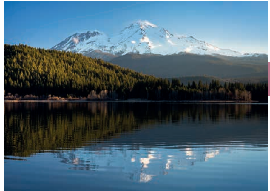
Mount Shasta (4322 m), met links Shastina, weerspiegeld in het Lake Siskiyou.

De Sacramento en de American River komen samen in Sacramento , de drukke hoofdstad die gebukt gaat onder een door grote broer San Francisco uitgeroepen slecht imago. Mocht je hier toch belanden, dan kun je er heus je tijd aangenaam doorbrengen.