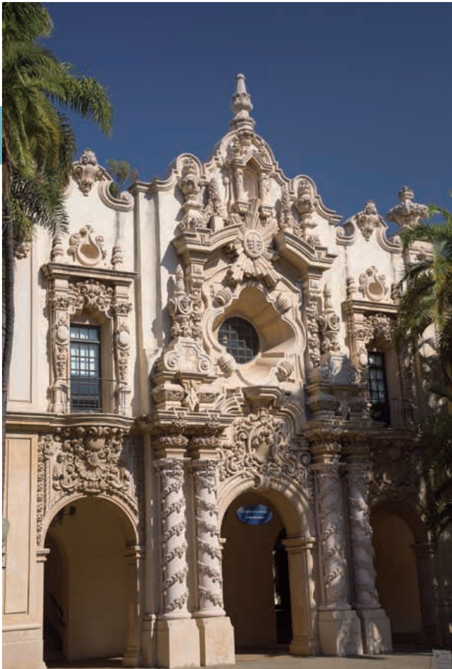
Spanish Colonial Revival, waarin wordt teruggegrepen op bouwelementen van de Spanjaarden, Balboa Park, San Diego.

in de VS opgang maakten. Vooral de laat-19de-eeuwse victoriaanse hoogtij-dagen zijn terug te vinden in San Francisco's Nob Hill. Voornamelijk in het Financial District en Yerba Buena zie je er tussen de moderne hoogbouw nog de bouwwerken uit het vroege skyscraper -tijdperk. Daarbij werd gekeken naar de aartsvader van de wolkenkrabbers Louis Sullivan (1856–1924). Zijn bouwstijl wordt sullivan-esque genoemd.