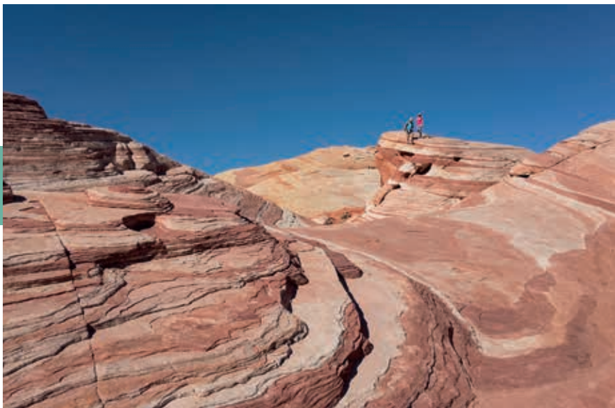
Fire Wave in het Valley of Fire State Park

In het natuurgebied Red Rock Canyon , 30 km ten westen van Las Vegas, zijn geologische tijdvakken af te lezen aan het roodbruine zandsteen en de grijze kalksteenmassa's. Er gaat een toeristische route van 20 km langs de mooiste plekken. Calico 1 en 2 en daarna Calico Tank – in 1902-1912 een steengroeve ten behoeve van San Francisco – zijn de beste plekken om voor foto's en wandelingen uit te stappen. Geregeld zijn er georganiseerde wandelingen en lezingen van de park rangers.