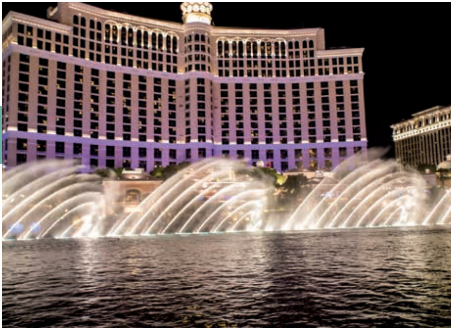
Fonteinshow voor het Bellagio; op het hoogtepunt rijst het water ruim 70 m op, maar nog altijd is het complex erachter veel hoger.

Ridders van de Ronde Tafel kom je tegen in Excalibur . Op muren, glas, maar ook tijdens toernooien, zie je koning Arthur in zijn legendarische kasteel Camelot, dat je via een ophaalbrug betreedt. In het middeleeuwse dorp lopen narren en goochelaars. Wie een dinnershow bijwoont, eet er met zijn handen.