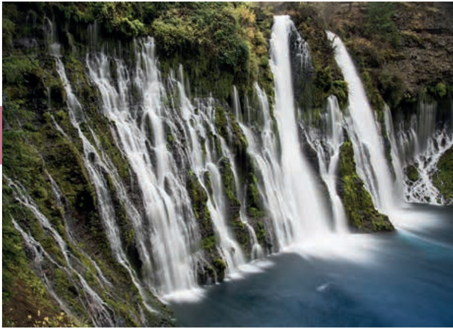
De Burney Falls zijn te zien in het McArthur-Burney Falls Memorial State Park.

die van diverse zijden goed te bekijken. Het gebied wordt als State Park beschermd en heeft kampeergelegenheid.