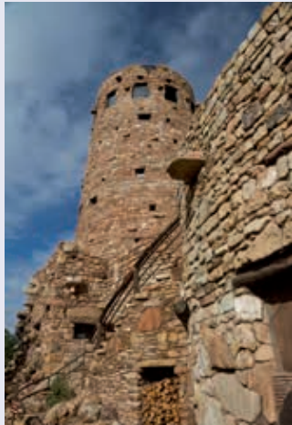
Desert View Watchtower, Grand Canyon. Een stalen constructie zorgt voor stevigheid, het steenwerk dat ervoor is geplaatst geeft een historische uitstraling.