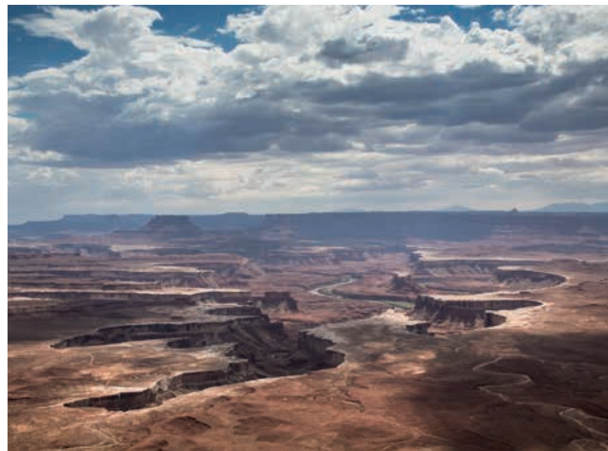
De Rim Road daalt af tot aan de lagere canyonwanden van het Canyonlands National Park.

Vulkanische krachten zijn medeverantwoordelijk voor de karakteristieken van het parklandschap in het centrale zuiden. Kolossale basaltblokken en oude kraters zijn terug te vinden in het Zion National Park. Ook komt lava in andere verschijningsvormen voor. De harde toplaag van kalksteen in het Bryce National Park zorgt voor de typische pilaarvormen. De opeenvolgende plateaus, afkomstig uit verschillende tijdvakken, worden ook wel aangeduid als Grand Staircase. Van deze natuurlijk gevormde trap vormt de Grand Canyon (Arizona) de eerste tree, het Zion National Park de tweede en Bryce National Park de laatste tree, respectievelijk uit de geologische periodes trias, jura en krijt.