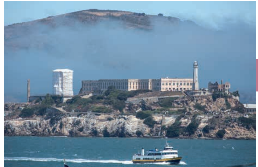
De roemruchte voormalige gevangenis Alcatraz.

Meestal al weken van tevoren zijn de excursies naar Alcatraz Island volgeboekt, dus als The Rock op je wensenlijstje staat, boek dan tijdig. De mythe van 's lands beruchtste gevangenen op het eilandje dat je vanuit zoveel hoeken ziet, blijft tot de verbeelding spreken. Hier zaten Al Capone, Baby Face Nelson en veel andere gevreesden. Het rotseiland was domein van pelikanen ( alcatraz in het Spaans) toen de Spanjaarden het ontdekten. Van halverwege de 19de eeuw tot 1933 had het Amerikaanse leger er een basis en van 1934 tot 1963 was er de beruchte en zwaarbewaakte federale gevangenis met in 450 cellen zware criminelen. In 1962 slaagden drie gevangenen erin uit de gevangenis te ontkomen. Nooit is opgehelderd hoe de ontsnapping heeft kunnen plaatsvinden en of de mannen inderdaad levend het vasteland