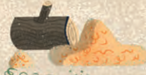
HARS Om het lichaam mee te bedekken nadat het gevuld is