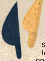
VUUR- STENEN MES Speciaal om het lichaam open te snijden