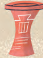
PALMWIJN Om het lichaam te wassen nadat de organen verwijderd zijn