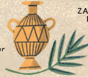
PARFUM EN OLIE Om de huid lekker te laten ruiken