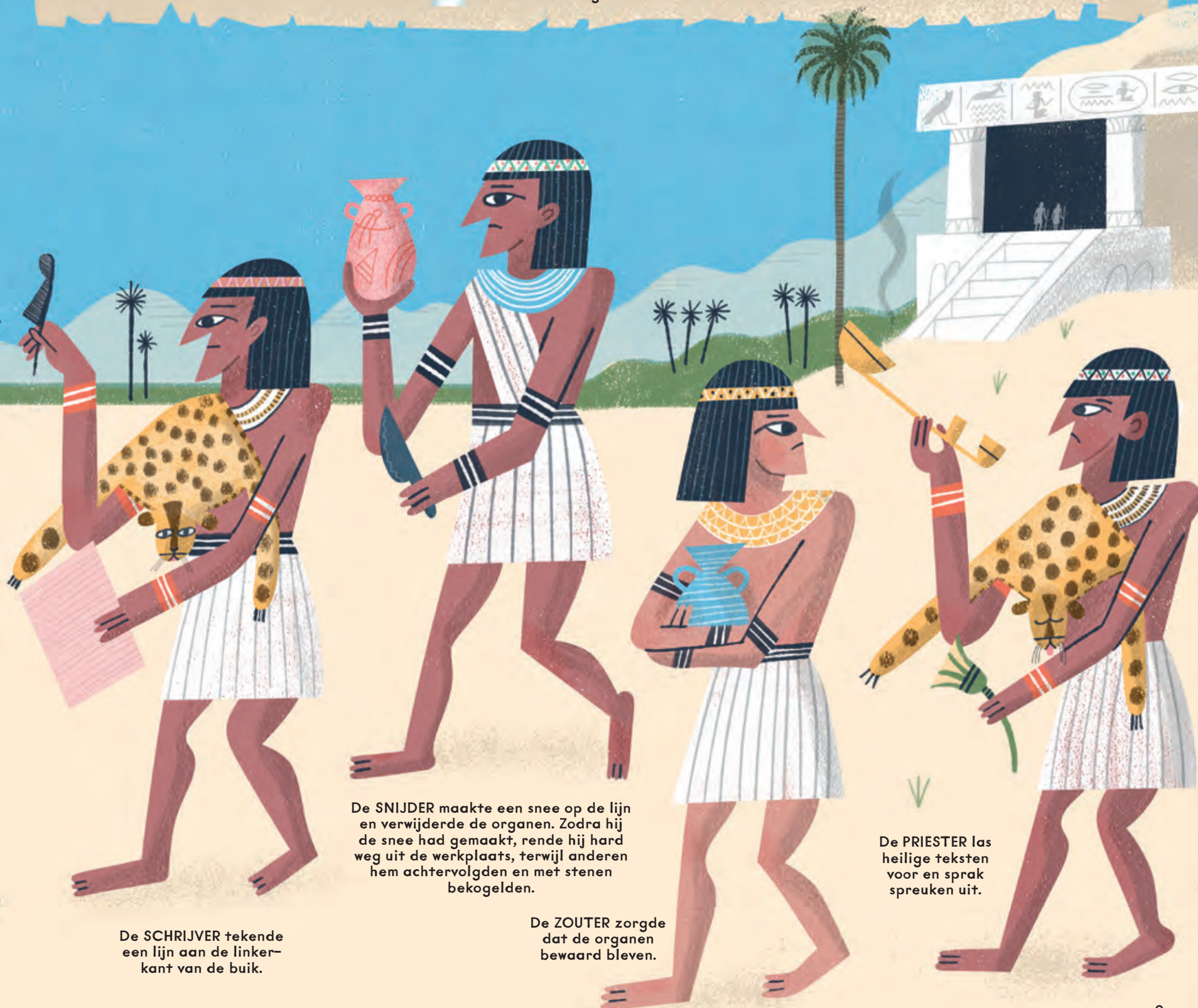
De SCHRIJVER tekende een lijn aan de linker- kant van de buik.