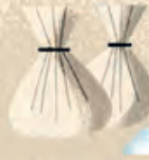
NATRON Een natuurlijk zout dat vocht opzuigt en vet afbreekt