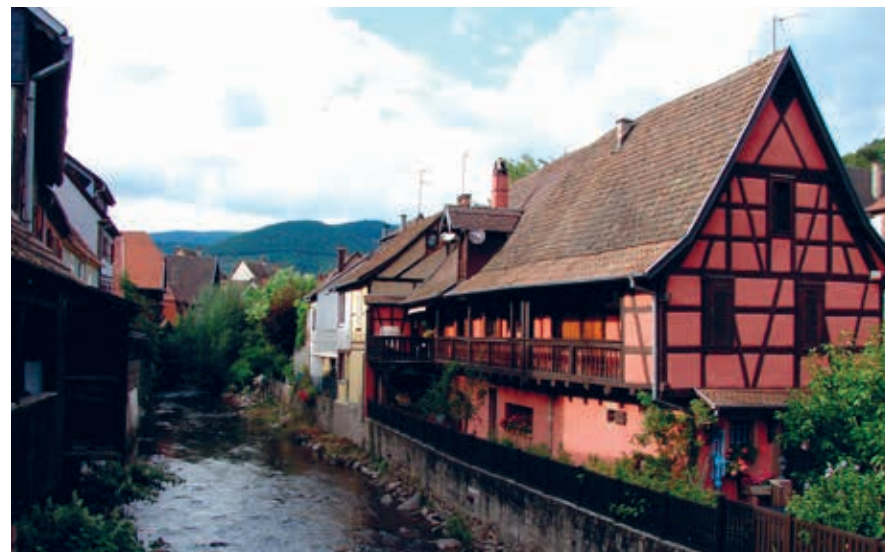
Het fotogenieke Kaysersberg ligt in het dal van en is gebouwd op de oevers van de rivier de Weiss.

Charme dankt het niet in de laatste plaats aan de Weiss, die door de plaats stroomt. De pont fortifié , een 15de-eeuwse versterkte brug, heeft kantelen en schietgaten. Daar vlakbij aan de Rue du Général de Gaulle ligt een patriëershuis dat aan de 16de-eeuwse eigenaar van een zilvermijn toebehoorde. Hier is het Musée Historique , met een verzameling kostbare kleinoden die een beeld van de geschiedenis schetsen. Romeinen noemden de strategische doorgang hier, tussen Gallië en het Rijnland, Caesaris Mons; heel wat keizers later heet het dus nog steeds Kayersberg. In 1353 trad de welvarende stad toe tot de Decapolis, het tienstedenverbond. De wijnbouw kreeg in de 16de eeuw een extra impuls met wijnstokken uit het Hongaarse Tokaj, waarheen onder keizer Maximiliaan nogal wat veldtochten werden onder-