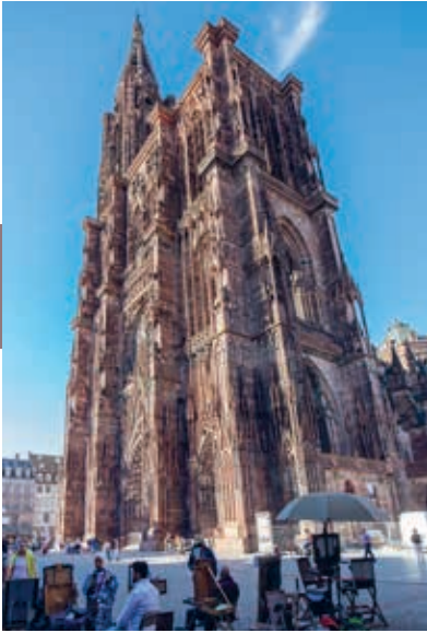
Souvenirs aan de voet van de kathedraal.