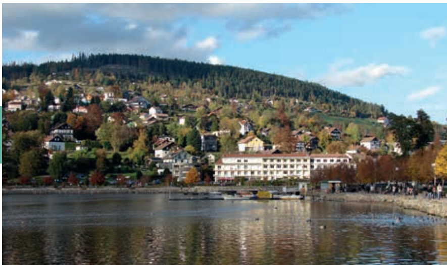
Gérardmer in oktober.

de la Schlucht gaat een steil pad naar de top van de Hohneck (1363 m). Het panorama is verbluffend, bij helder weer is zelfs het Zwarte Woud te zien. De Gazon du Faing is een mooi uitgangspunt voor wandelingen. Start bij de brug van Rudling voor een route van 12 km langs de Auberge du Gazon du Faing. Volg voor een langere wandeling de Route des Crêtes vanaf de Col du Louschbach (978 m), langs het Lac Blanc en Lac Noir en de fermes-auberges Lac du Forlet en Seestaettle.