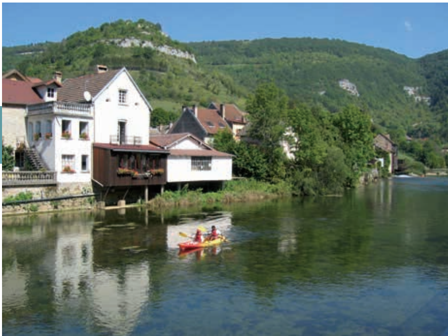
De Loue bij Vuillafans, geboorteplaats van de moordenaar van Willem van Oranje.