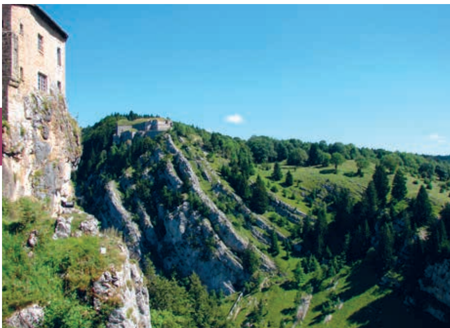
Vanaf het terras van het Fort de Joux (Doubs) is de plooiing van de aardkorst goed te zien. Tussen de rots met het Fort de Joux en de rots met het fort op de achtergrond loopt een cluse.