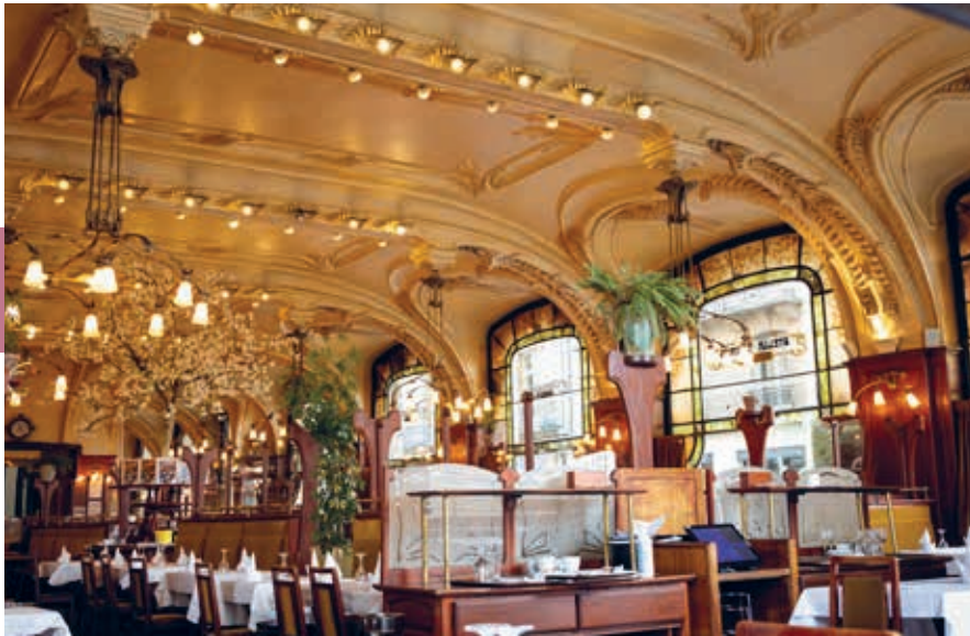
Brasserie L'Excelsior, klassieke favoriet in art-nouveaustijl.

van Jacques Gruber. De kortste route terug naar de Place Stanislas voert vanaf de Cours Léopold langs de neogotische basiliek Saint-Epvre.