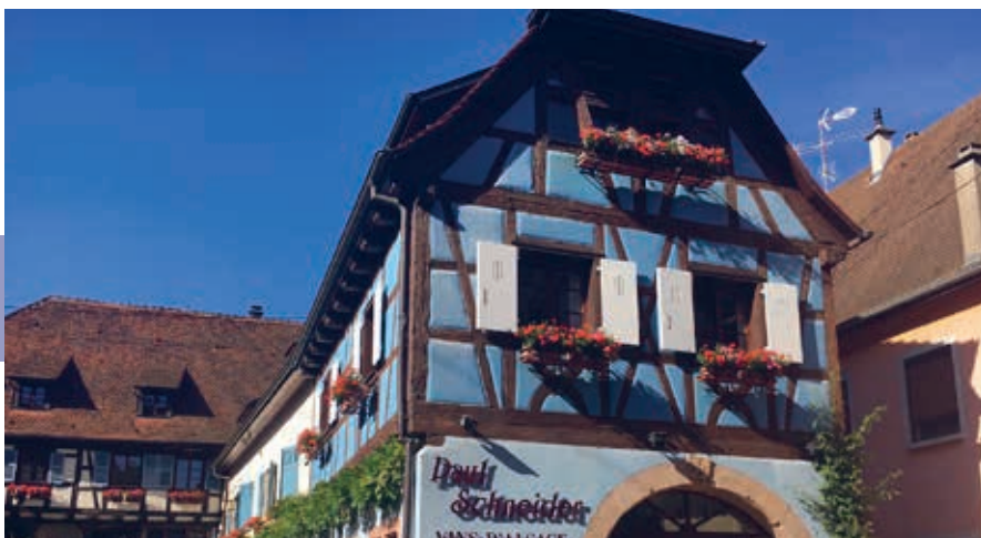
Eguisheim is met Turckheim en Munster een van de fotogeniekste plaatsjes van de streek.

Op de website van het toeristenbureau staat een reeks wandelvoorstellen, van informatieve korte rondjes tot uitgebreidere routes door de wijngaarden van Riquewihr, Beblenheim, Bennwihr, Hunawihr, Mittelwihr en Zellenberg. Vanuit Riquewihr kun je bovendien te voet naar Kaysersberg; naar keuze door de wijngaarden of de steilere route over de Vogezenuitlopers.