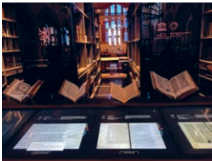
De modern geoutilleerde Bibliothèque Humaniste in Sélestat, met een enorme collectie 16de-eeuwse humanistische geschriften.

Het middenrijk strekte zich uit van het huidige Nederland tot Noord-Italië en van de Rhône tot de Rijn. Na de dood van Lotharius werd het onder zijn zonen verdeeld: Noord-Italië ging naar Lodewijk, Bour-