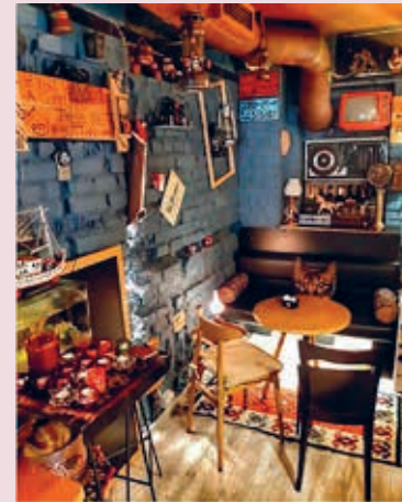
Interieur van Lounge 18 Grade.