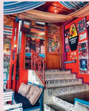
Interieur van Nouvelle Vague.