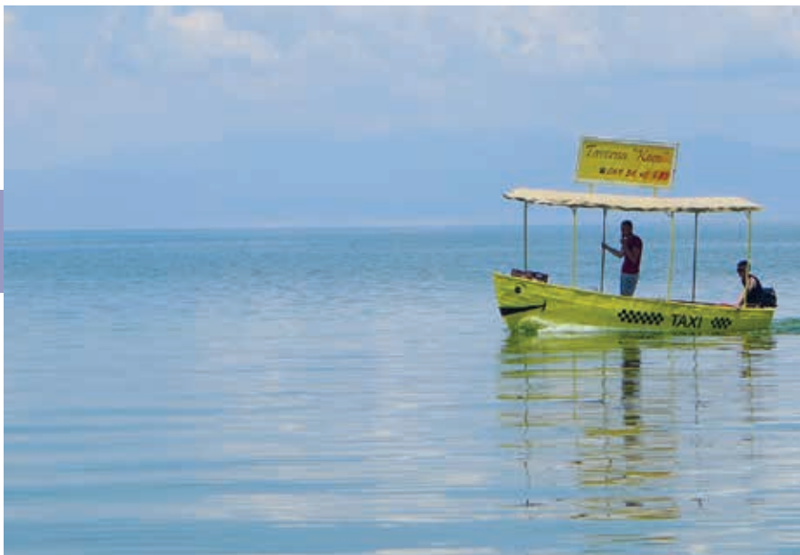
Watertaxi bij Tushemisht op het spiegelgladde Meer van Ohrid.

en de reeks van vijf of zes herenkapsalons in pijpenlaatjes naast elkaar aan de Rruga Kajo Karafili. In 2021 heeft het stadsbestuur geïnvesteerd in de podiumkunst, met het grote Odeonplein tussen hotel Enkelana en het water. Het gebied ten oosten daarvan is het vrolijkste deel van de stad. In sportcafé Visit Pogradec kun je sup-boards, kayaks en mogelijk fietsen huren. Ook in het westelijk deel van de stad, aan of bij de Rruga Kajo Karafili, zit een fietsverhuurder.