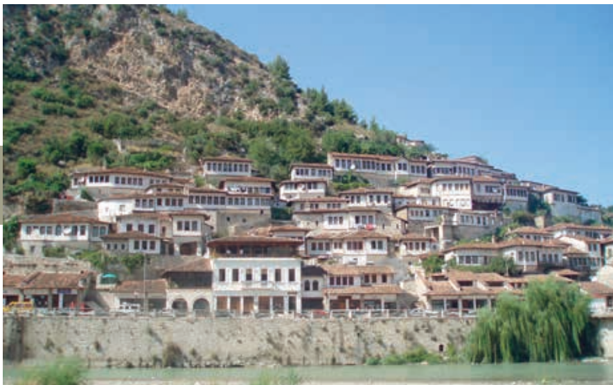
Berat wordt ook wel de stad van duizend ramen genoemd.

Er zijn drie bruggen die de oevers van de Osum bij Berat verbinden. In het verlengde van de middelste, de Gorica-brug, die vroeger van hout was, gaat een leuk wandelpad de Mali Partizan op.