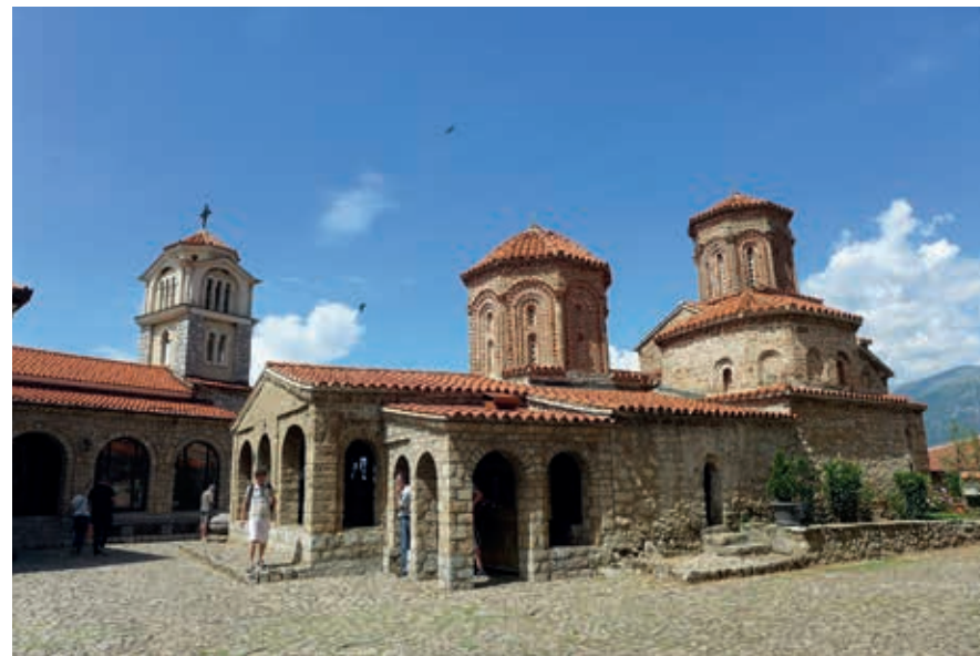
Het orthodoxe klooster van Sveti Naum, net over de grens met Noord-Macedonië aan het Meer van Ohrid.

Vanuit Pogradec is het nog geen half uur fietsen naar de grens met Noord-Macedonië (paspoort mee!). Net voor die grens ligt Tushemisht , een wat rommelig ogend plaatsje waar je een aantal goede visrestaurants vindt, sommige, zoals Xhili, met eigen forellenvijver. Als je de beroemde koran of belushkë uit het meer wilt eten, de ohridforel, is het handig dit 's morgens te laten weten. Bij Tushemisht ligt het park Drilon , waar ondergrondse bronnen opwellen en je bootjes kunt huren. Restaurant Vila Art, in dit park, was het vroegere zomerhuis van de familie Hoxha. Tushemisht werd ook gebruikt als locatie voor de film Zonja nga Qyteti (De dame uit de stad, 1976), een comedy van Kinostudio, de propagandafabriek van de communisten. De film vertelt het verhaal van een niet al te elegante vrouw met stadse manieren en praatjes, die zich na enig verzet overgeeft aan de charmes van het pure leven