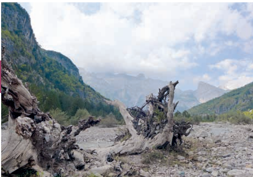
Uitzicht vanuit Theth op de Jezerçë (2694 m) in het uiterste noorden van Albanië. Alle sneeuw is hier in de zomer verdwenen.