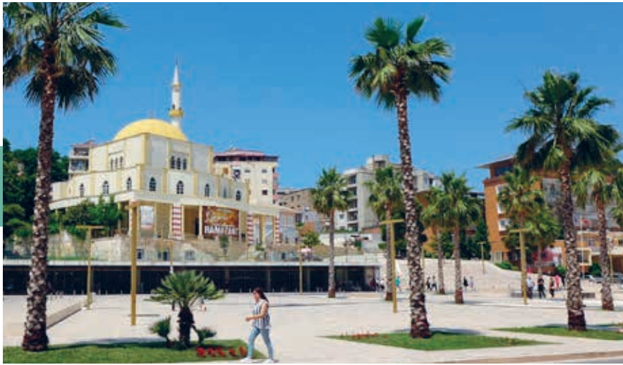
Het centrale plein van Durrës met de Grote Moskee.

Het interieur is sober, met veel wit stucwerk, spitse bogen en eenvoudig houtsnijwerk onder andere toegepast voor de mimber of m'mbar , het spreekgestoelte van de imam. Langs de helft van de grote benedenruimte voor de mannen loopt op de hogere verdieping een halfronde galerij voor de vrouwen. Je moet je schoenen uitdoen en vrouwen worden geacht hun haar onder een hoofddoek te verstoppert. Aanwezige gelovigen zullen hun welkom en goede intenties mogelijk uitspreken met het woord bismillah en zullen je graag vertrouwd maken met de gebruiken in de moskee en de geest van het bidden. Ga zolang er geen dienst is dus gerust naar binnen.