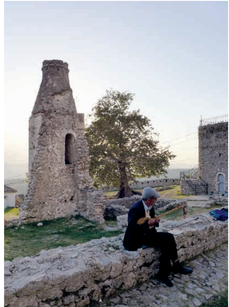
Muzikant bij de ruïnes van het kasteel van Krujë.

Succesvol maar niet onomstreden is het gebruik in Albanië van waterkracht. Grote installaties hiervoor werden vanaf eind jaren 60 gebouwd, destijds met hulp van de Chinezen, in de Drin bij Fierzë, Vau i Dejës en Kukës, waar enorme stuwmeren zijn ontstaan. Tegenwoordig is er nauwelijks meer een rivier of zijarm waar geen dammen te vinden zijn. Alleen de Vjosë, naar verluidt de laatste wilde rivier van Europa, is dankzij protesten van milieu-activisten en bewoners tot nu gespaard gebleven. Normaal kan waterkracht heel Albanië van stroom voorzien; in 2022 zorgde een grotere vraag gecombineerd met aanhoudende droogte er echter voor dat energie tegen hoge kosten moest worden geïmporteerd.