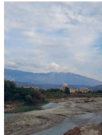
Uitzicht vanaf de voetbrug naar het oosten, waar je in de verte een replica van het Capitool ziet liggen.

De tocht naar de tekke is zwaar en volgens sommigen niet overal even mooi. Maar je hoeft daar niet per se naartoe voor een memorabele wandelervaring. Vanuit Berat worden ook tochten te voet of met een muilezel aangeboden