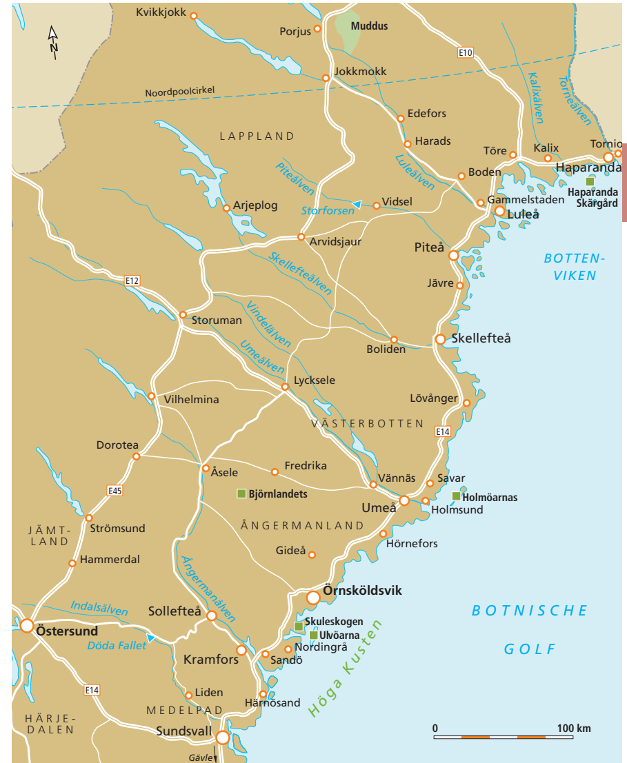
Kuststreek langs de Botnische Golf

Voor een erg leuke wandeling op het eiland Härnön, ten oosten van Härnösand, volg je de weg naar Smitingen, die uitkomt bij een breed, hagelwit zandstrand aan een baai. De zomerhuisjes en beachvolleybalvelden doen niets af aan de schoonheid van de plek. Rondom de baai liggen beboste heuvels. Volg het pad via het meertje Klubbsjön naar Härnöklubb, een schiereilandje met steile rotswanden. Op de top Klubberget is een uitzichtpunt met picknickplaats. Aan de waterkant is het gesteente gladgepolijst. De golven hebben hier prachtige ronde sculpturen uitgesleten en ketelgaten en grotten gevormd. Hier kun je een gemarkeerde route volgen tussen en onder de rotsen door (zie foto p. 360).