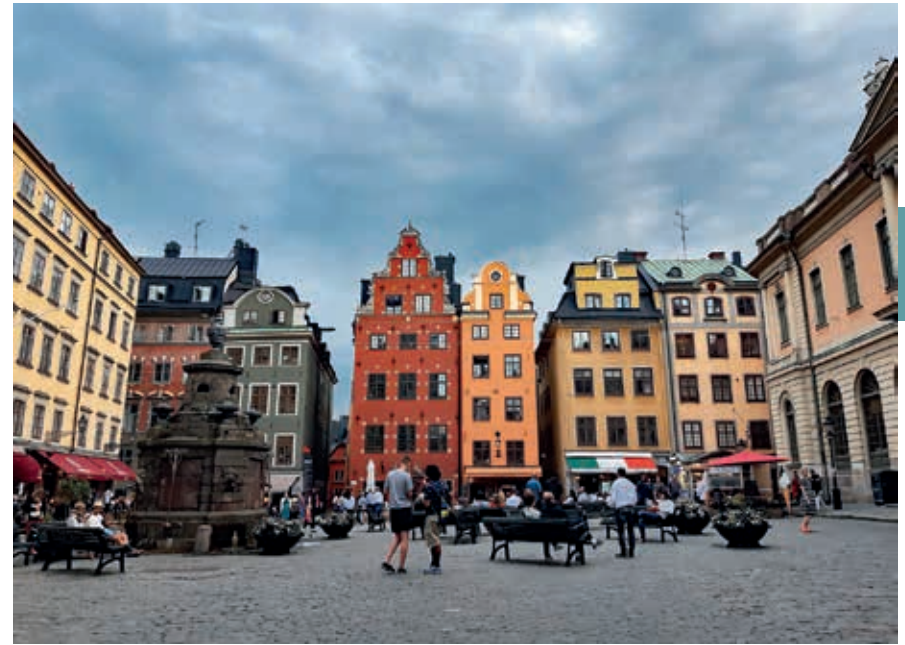
Gezellige terrasjes aan het Stortorget.

Aan de westzijde van Gamla Stan ligt het eilandje Riddarholmen. Het straatbeeld van Riddarholmen wordt vooral bepaald door statige paleizen die nu dienstdoen als overheidsgebouwen. Het is daardoor minder levendig dan Gamla Stan, maar de oude architectuur maakt een rustig wandelingetje over het eilandje zeker de moeite waard. Aan de voet van de toegangsbrug Riddarholmsbro staat het Riddarhuset. Dit wordt als een van de mooiste gebouwen van Stockholm beschouwd, met zijn Hollandse barokstijl uit de 17de eeuw. Wanneer je over de brug naar Riddarholmen loopt, zie je de Riddarholmskyrkan liggen. In deze kerk worden al sinds de Vasatijd leden van het koninklijk huis begraven. Slechts twee uitzonderingen zijn er gemaakt: koningin Kristina is begraven in de Sint-Pieter in Rome, en Gustaf VI Adolf werd in het Hagapark begraven. Verder naar het water toe staat het Wrangelskapaleis, waar Gustav III is geboren en waar zijn moordenaar in 1792 werd opgesloten.