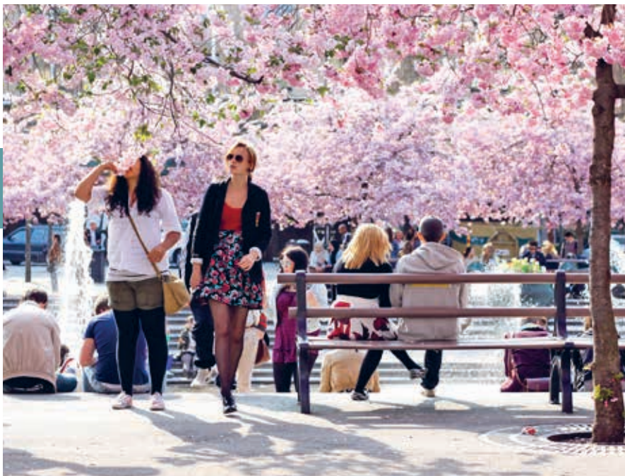
Lente in Kungsträdgården.

De Koninklijke Bibliotheek , in het park Humlegården, is een bezoekje waard vanwege de prachtige gewelfde gangen en ronde leeszalen uit de 19e eeuw. Al sinds 1661 is bij wet bepaald dat van elk boek dat wordt gedrukt of verspreid in Zweden, één exemplaar aan de bibliotheek gestuurd moet worden. Sinds een paar jaar geldt de wet ook voor audiovisueel en elektronisch materiaal, dus de collectie breidt zich in hoog tempo uit.