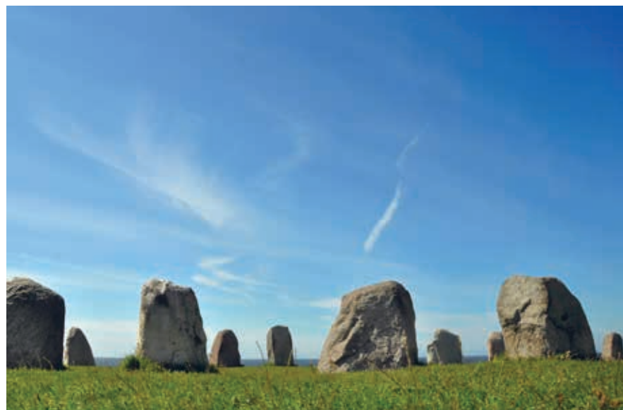
Ales Stenar bij Kåseberga in Österlen.

laire TV-serie Broen (The Bridge) . In het Ystad Studios Visitor Centre aan de Elis Nilssonsväg, kun je zien hoe de films gemaakt zijn. Opvallend zijn de prachtige bloembakken die in de zomer de straten en pleinen sieren. Er zijn veel kwekerijen in de omgeving. Een daarvan is Åberg Trädgård & Café , een bijna 150 jaar oude bezoekerstuin met kwekerij. Langs de kust ligt Sandskogen, het dennenbos dat op aanraden van Linnaeus is aangeplant in het duinzand. Hier zijn veel campings en vakantiehuisjes.