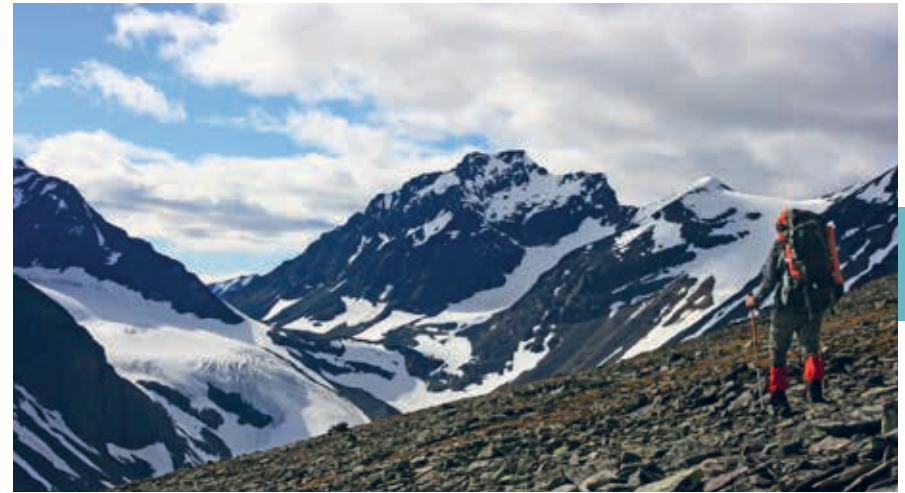
Tarfala, bij de hoogste bergtop Kebnekaise.

In dit boek worden de historische provincienamen aangehouden (zie de overzichtskaart op p. 8) en van zuid naar noord beschreven, beginnende