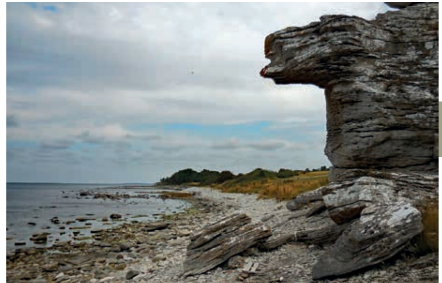
De klif Hoburgen op de zuidpunt van Gotland.

Gotland telt een verbijsterend aantal middeleeuwse kerken, waarvan er 92 gebouwd zijn tussen 1100 en 1350. De bouwstijl veranderde in de loop van die 150 jaar van kleine houten gebedshuizen tot stenen kerken met torens. Dat de kerkbouw abrupt stopte in 1350 wijt men aan het uitbreken van de pest, gevolgd door de bezetting door de Denen. Daarna was het gedaan met de rijkdommen van Gotland.