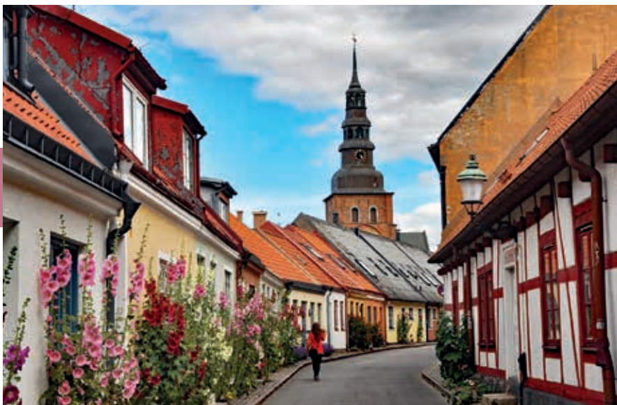
Lilla Västergaten in Ystad.