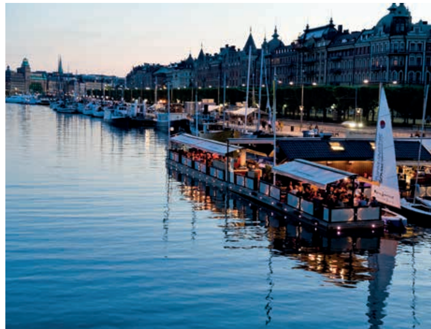
Dineren op het water aan Strandvägen, Östermalm.

De winkels concentreren zich rond het plein Stureplan. Sturegallerian is een overdekt winkelcentrum dat luxe en glamour uitstraalt, met zwartmarmeren vloeren en gouden versieringen. Het is ook een leuke plek om naar de bioscoop te gaan en aan te schuiven bij een straatbar, of te dansen in een van de populairste nachtclubs van Stockholm: Sturecompagniet.