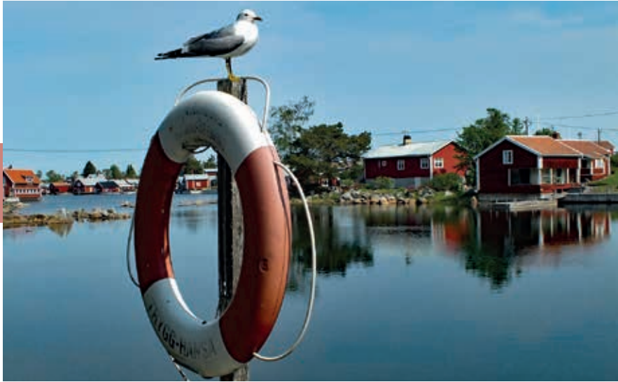
Het idyllische Hölick op het puntje van Hornslandet.