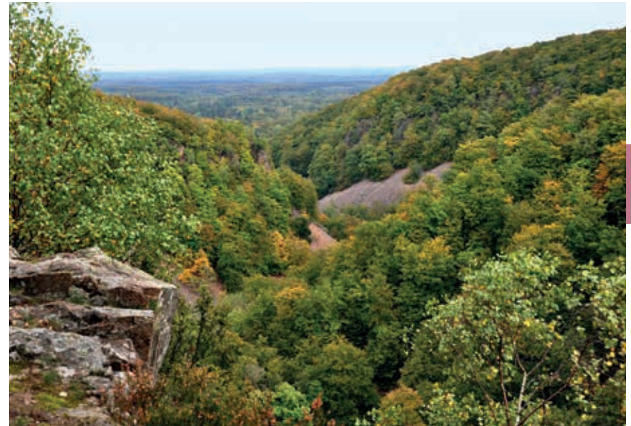
Uitzicht vanaf de berg Kopparhatten over de kloof Skärålid in Söderåsen.

De heuvelrug Söderåsen, 30 km ten oosten van Helsingborg, ligt langs de breuk die Skåne in tweeën deelde (zie p. 53). Geologisch is het een horst die 200 miljoen jaar geleden als een blok omhoog rees, terwijl het naastgelegen land juist daalde. Een van de vulkanen die toen actief waren in Skåne is de Rallaté, een heuvel vlak bij Skärålid. Een groot deel van Söderåsen is nu Nationaal Park, met als doel zowel de topografie als de vegetatie van dit karakteristieke horstlandschap te bewaren. Bij Röstänga aan de zuidkant