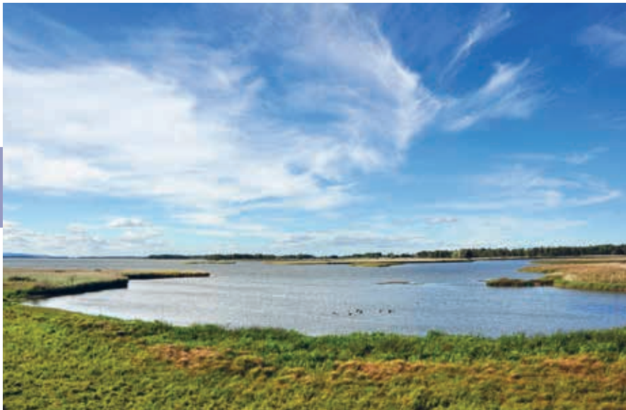
Store Mosse Nationaal Park.

Naturum en een forse uitkijktoren, waarin een expositie is over de flora en fauna van het park. Er is een korte wandeling speciaal voor kinderen uitgezet, 'het trollenpad' waarbij ze antwoord op allerlei vragen moeten zoeken, en er beginnen diverse wandelroutes die, deels over houten vlonders, door moeras, heidevelden en berkenbosjes lopen. De wandeling rondom het meer Kävsjön is 14 km lang, waarbij je onderweg nog meer observatiehutten passeert om vogels te bespieden (verrekijsers mee!). Aan de noordkant van het meer, bij Svänö, is ook een bezoekerscentrum. Vanuit het Naturum kun je meegaan op een rondwandeling met een gids. Nieuw is een wandeling op sneeuwschoenen, niet in de winter maar in de zomer, zodat je buiten de paden niet weg kunt zakken in het moeras. Reserveren kan bij het Naturum. Volgens vogelkenners is Store Mosse een van de topgebieden van Zweden. Behalve de broedende kraanvogels, kun je er roodkeelduikers, wilde zwanen, bokjes, korhanen en kemphanen waarnemen. In de omringende bossen komt de hazelhoen voor en veel uilen en spechten. Tot zo'n 50 jaar geleden werd er nog turf gewonnen in het park, zoals te zien is bij Horssjön. Er zijn ook overblijfselen uit de steentijd gevonden.