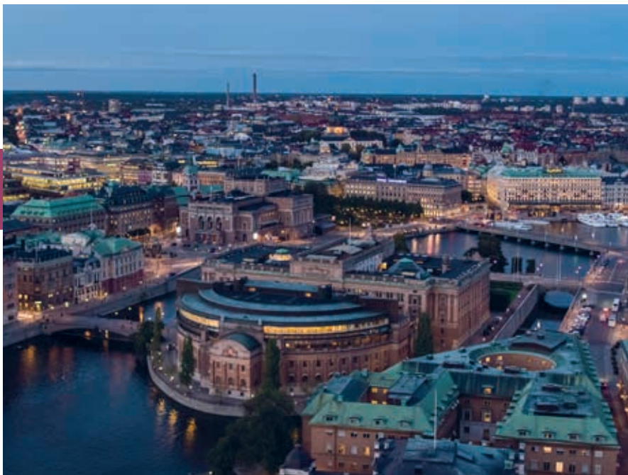
De Zweedse regering zetelt sinds 1905 in het Riksdagshuset (parlementsgebouw) in de wijk Gamla Stan midden in Stockholm. Alles wat zich afpeelt in de Kamer is openbaar, iedereen die dat wil kan de debatten en stemmingen bijwonen. In de zomer zijn er dagelijks rondleidingen met gids, in de winter alleen in de weekends (zie riksdagen.se).