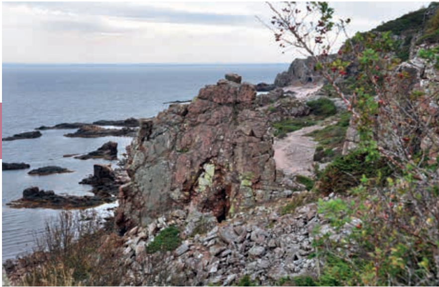
Hovs Hallar op het schiereiland Bjäre.