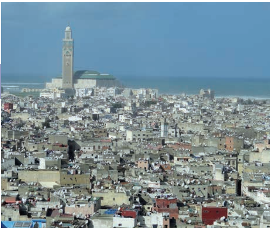
Casablanca met de Hassan II-moskee vanuit de lucht.

architect Prost werd de koubba gespaard. Dit ging ten koste van een deel van de medina en de stadsmuur, waardoor er ruimte vrij kwam voor de weg naar de haven. Twee andere wijken waaruit de stad aan het begin van de 20ste eeuw bestond, zijn inmiddels verdwenen: de mellah in het zuiden en zuidoosten van de stad en de wijk Tnaker bij de Bab Marrakech, waar boeren uit Doukkala in hutten en kleine huizen woonden. De benaming Tnaker is in de nieuwe stad behouden.