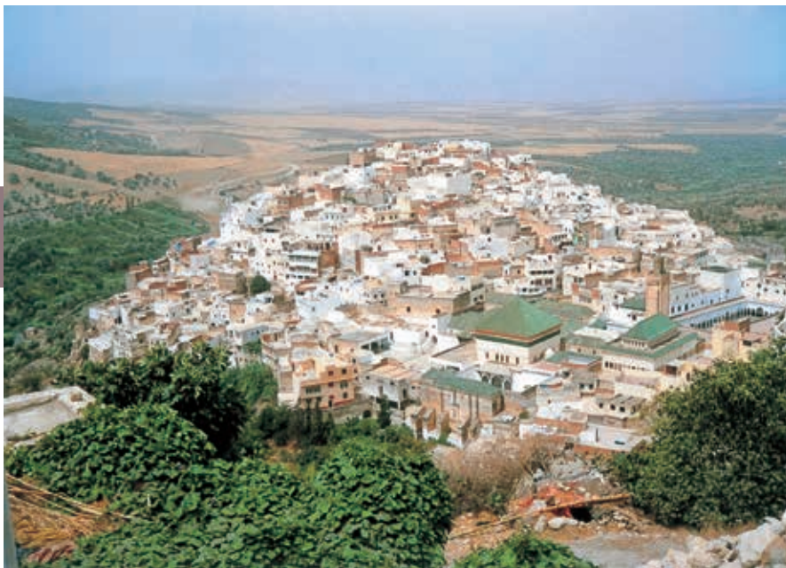
Moulay Idriss in de Zerhoun-bergen.