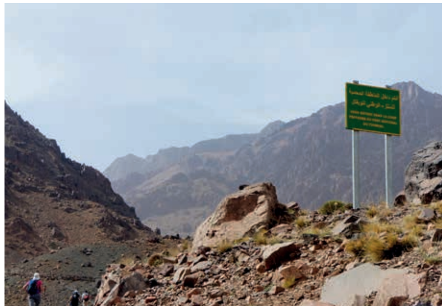
De Jbel Toubkal is de hoogste berg van Marokko en een geliefd gebied voor hiking.

Hierna stijgt de weg langs hoge rotswanden met scherpe haarspeldbochten boven elkaar naar het hoogste punt, de 2100 m hoge bergpas Tizi-n-Test. Deze bergweg in het schaars begroeide landschap is aangelegd door