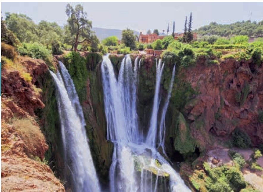
De watervallen van Ouzoud.

Abd-el-Moemene, de eerste sultan van de Almohaden, liet in Tin-Mal in 1153 uit dankbaarheid een moskee bouwen boven het graf van Ibn Toumart, aan wie hij zijn troon te danken had.