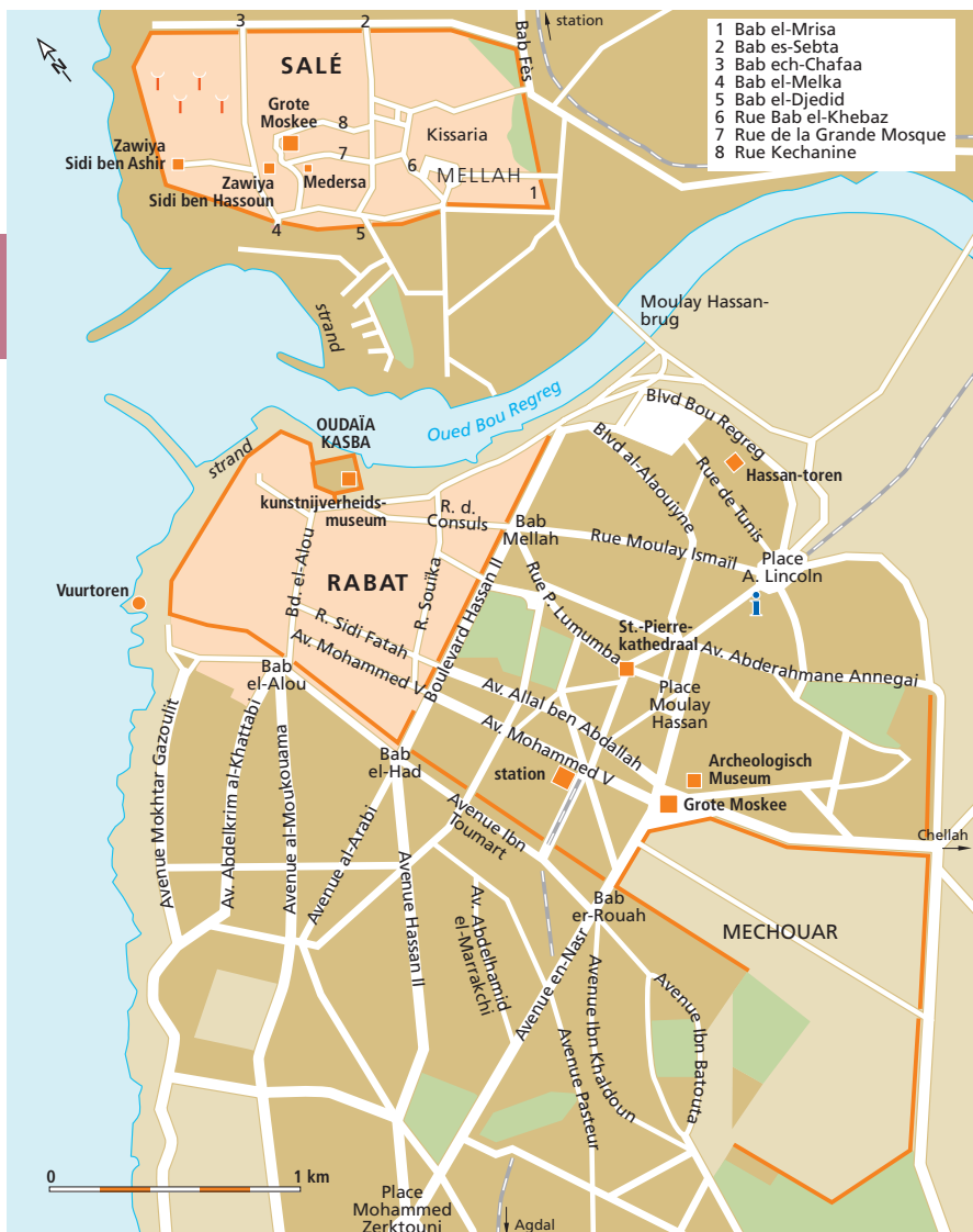
Rabat en Salé