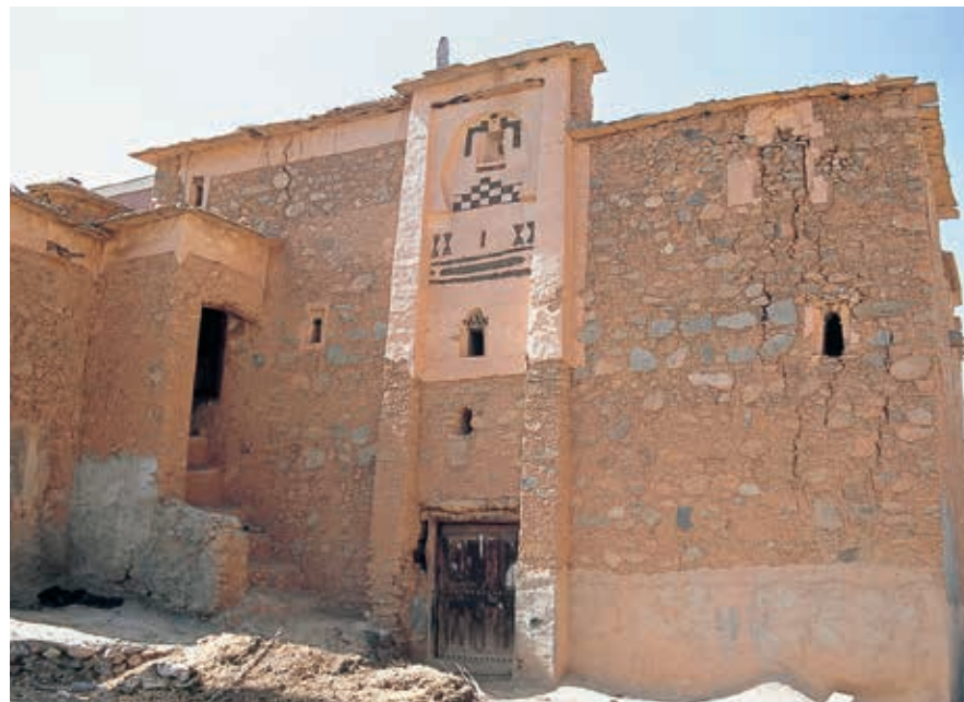
Traditionele geometrische versiering in de Vallei van de Ammeln.

Tafraoute ligt op meer dan 1000 m hoogte op een kruising van een door-waadbare rivierbedding ( meshra ) en een verkeersweg. Het stadje bestaat uit op rotsen gebouwde huizen, is omgeven door een vallei met dadelpalmen en ligt prachtig in het hart van de Anti-Atlas. Tafraoute zelf heeft geen in-teressante bezienswaardigheden – of het moet de bijzondere straatlantaarn in de vorm van een Berberfibula zijn. Een bezoek aan het plaatsje is vooral interessant vanwege de mogelijkheden tot het maken van wandelingen of rondritjes in de omgeving. Die omgeving is van een buitengewone schoonheid. De granietrotsen rond het stadje zijn geërodeerd tot fantasievolle vormen in roze en bruine kleuren. Ze vormen een grandioos decor voor