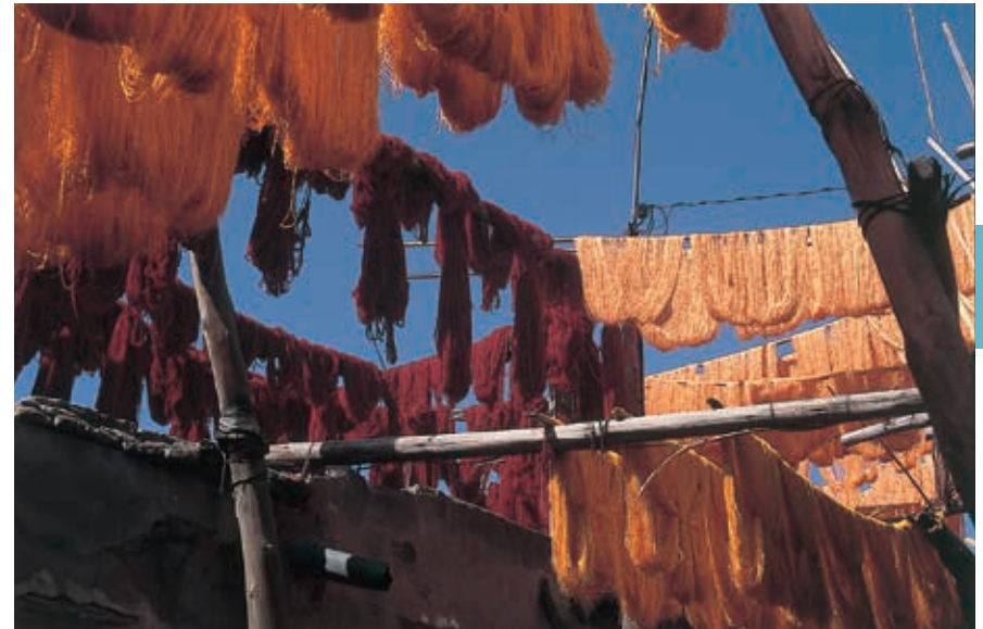
Geverfde wol hangt te drogen boven de straat in Marrakech.

Rabat en Salé zijn de tapijtcentra van Marokko. Twee keer per week (op maandag- en donderdagochtend) is in de medina van Rabat een tapijtmart. De overheersend donkerrode tapijten met centraal het medaillon uit Rabat lijken wat betreft kleur en motief op tapijten uit het Midden-Oosten en vooral Turkije. Het zijn de meest geliefde tapijten in Marokko. De tapijten