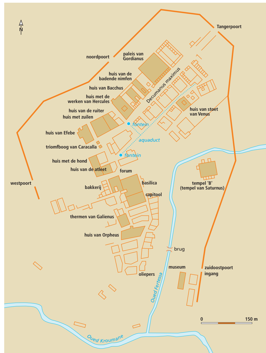
De opgraving van Volubilis

Volubilis beleefde zijn bloeitijd als hoofdstad van de Romeinse provincie Mauretania Tingitana in de 2de en 3de eeuw n.Chr., maar was al in de pre-Romeinse tijd een nederzetting van enige omvang. In de 1ste eeuw v.Chr.