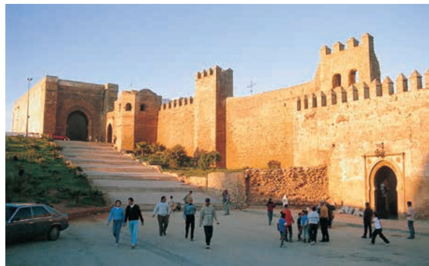
De muren van de Oudaïa-kasba aan de kust van Rabat.

Het centrum van Rabat is betrekkelijk overzichtelijk: de oude medina heeft een recht stratenpatroon en de ville nouvelle is er als een halve cirkel omheen gebouwd. Het toenmalige bouwplan hield rekening met behoud van de al aanwezige historische gebouwen, waardoor bezienswaardigheden als de