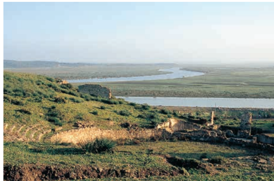
Landschap bij Lixus en Larache.

Even ten noorden van de Jardin Exotique staat het Musée Dar Belghazi , een uitgestrekt volkenkundig museum met een oppervlakte van 7000 m 2 . De collectie bestaat uit de verzameling authentieke kunstvoorwerpen van de familie Belghazi, aangevuld met hedendaagse reproducties. De zalen zijn thematisch ingericht, maar het geheel heeft het karakter van een rariteitenkabinet. De verzameling bestaat uit allerlei vormen van huisraad, voorwerpen uit de Arabisch-islamitische, Berberse én joodse materiële cultuur van