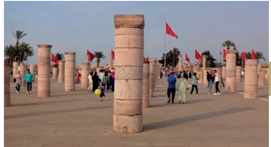
Ooit bedoeld als de grootste moskee van de wereld. Nu is de onvoltooide Hassan-moskee een bezienswaardigheid en uitwaaioplek in Rabat.

In de chaos die aan de komst van de Saadiërs als dynastie van Marokko voorafging, golden de shurafa, maraboets en soefibroederschappen als de enige autoriteiten in het land. De bekendste soefileider in de Sous en Haha was Al-Jazuli. Een door hem samengesteld soefihandboek werd in Noord-