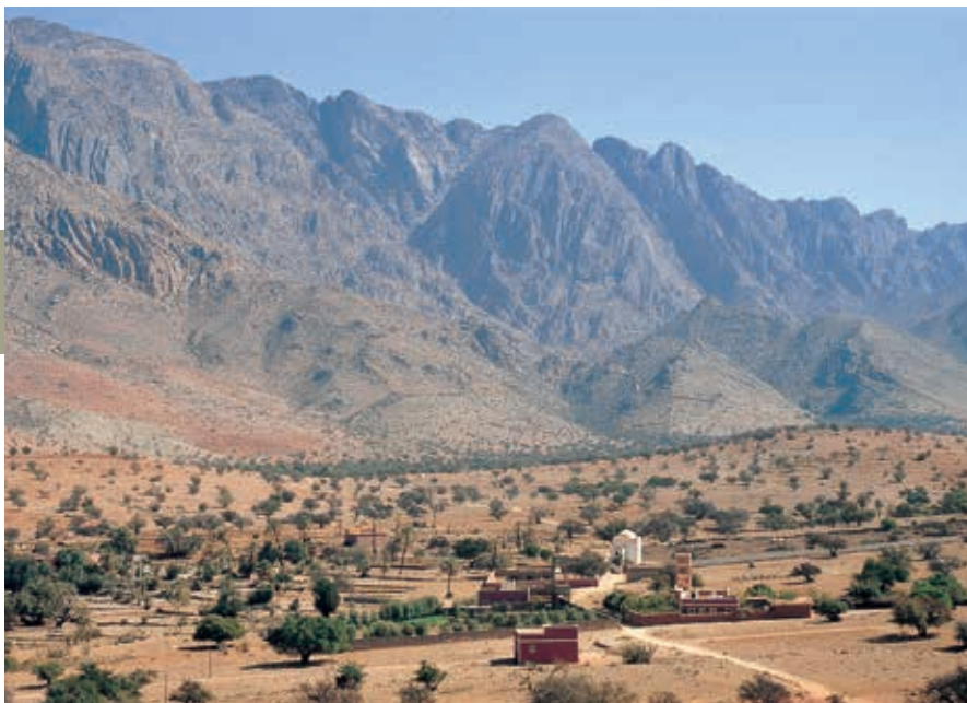
Een vallei in de Hoge Atlas ten zuiden van Marrakech.