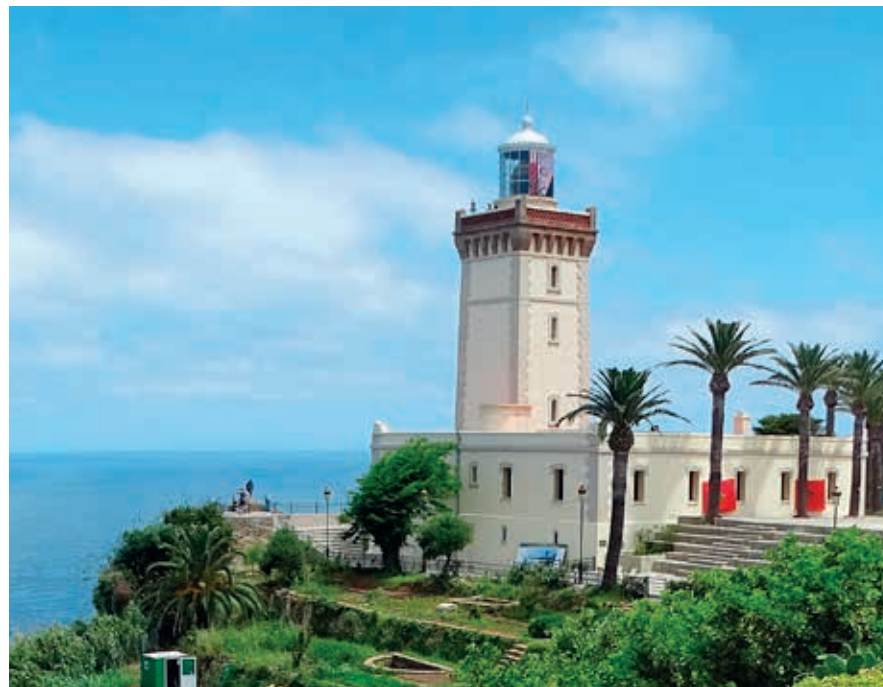
Na de zoveelste schipbreuk werd in de 19de eeuw op deze gevaarlijke kust een vuurtoren gebouwd.

> La Librairie des Colonnes, 54 Boulevard Pasteur, librairie-des-colonnes.com , sinds 1949 de ontmoetingsplaats voor schrijvers