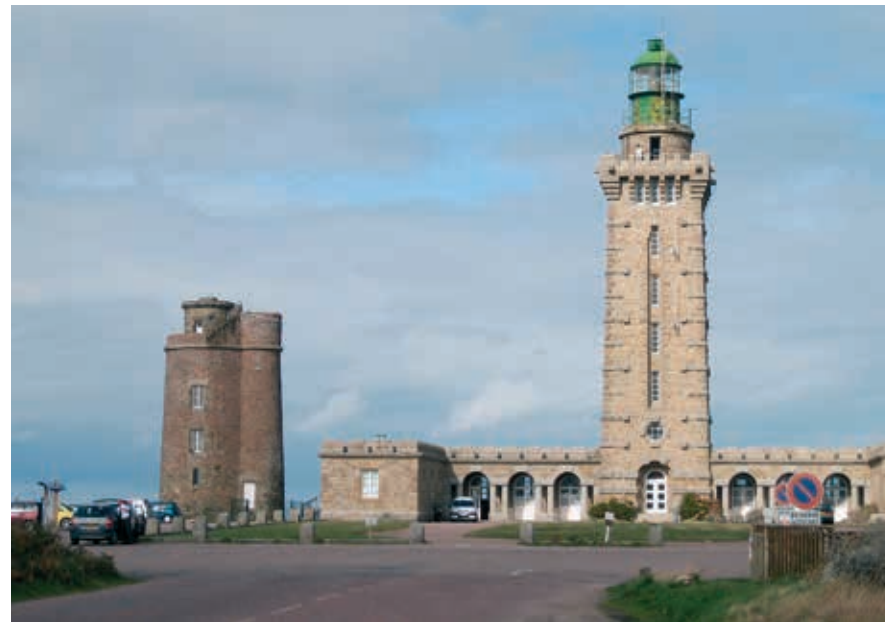
De oude en de nieuwe vuurtoren van Cap Fréhel.

Je bereikt het fort, ook kasteel van Roche Goyon genoemd, via een pad dat langs een menhir loopt, die 'de vinger van Gargantua' heet. De vesting, die in een park ligt, dateert van de 13de–14de eeuw en heeft ondanks diverse restauraties haar feodale karakter bewaard. Het fort is van het vasteland gescheiden door twee kloven met ophaalbruggen erover. Je kunt de muren,