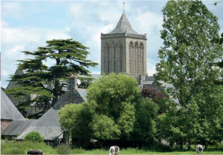
De abdij van La Lucerne.

toren van Michaël, de overwinnaar van Satan, bevindt zich 152 m boven zee. Rond de voet van de berg staan zware muren met schietgaten en halfronde torens. Het wad rond de Mont was in de loop der eeuwen flink angeslibd; er groeiden zoutplantjes en er graasden schapen. Alleen bij springvloed werd de berg nog geheel door water omspoeld, dat wil zeggen bijna geheel, want er lag een dijk die de verbinding met het vasteland vormde.