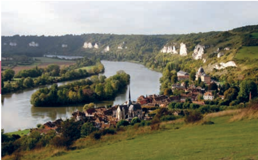
Les Andelys met uitzicht op de Seine en kasteel Gaillard.