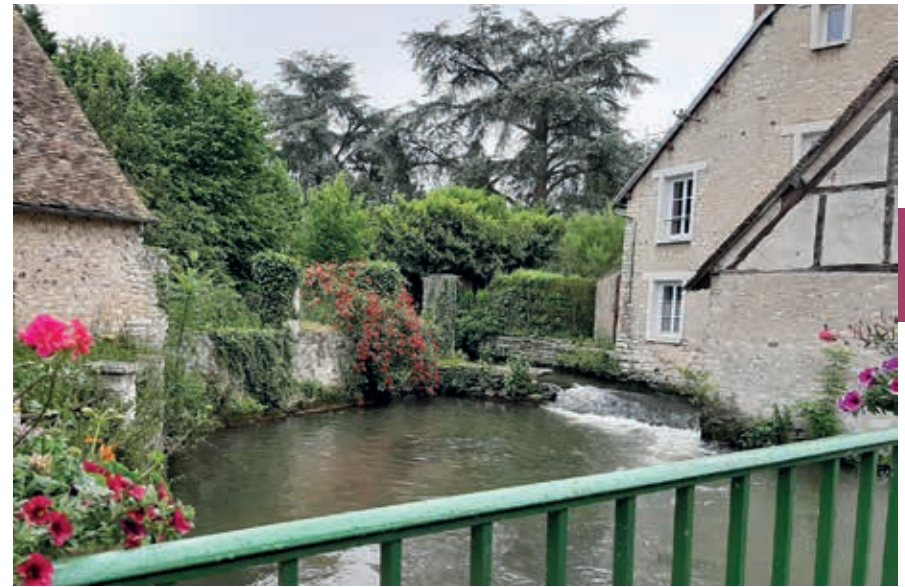
Langs de Eure.

De zuidgrens wordt gevormd door de Seine, die in Bourgondië ontspringt en 776 km verderop in het Kanaal uitkomt. De Seinevallei – waarvan het oostelijke deel in het departement Eure ligt – is met zijn mooie landschap en historische monumenten een aantrekkelijke toeristische bestemming. Centraal in de Seinevallei ligt Rouen, de hoofdstad van Normandië. Deze museumstad heeft een prachtig gerestaureerde oude binnenstad en trekt jaarlijks enorme aantallen bezoekers. De kathedraal, andere kerken en het justitiële paleis zijn hoogtepunten van gotische bouwkunst. Bijzondere middeleeuwse stra-