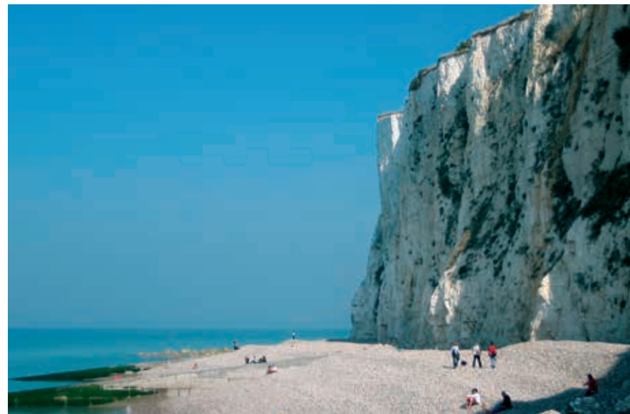
De Côte d'Albâtre bij Le Tréport.

Vlak bij de Place Carnot staat de Chapelle du Collège – van het jezuïetencollege – uit 1620, met een gevel van baksteen en beeldhouwwerk. Het meest de moeite waard zijn de zwartmarmen, met goud ingelegde graftomben van Hendrik van Lotharingen en zijn gemalin Catharina van Kleef.