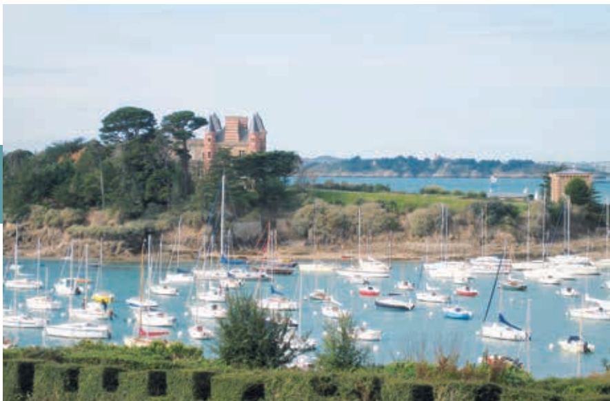
Het haventje van Saint-Briac met het kasteel.