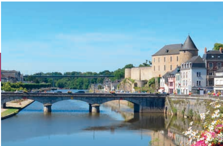
Zicht op het centrum van Mayenne, het departement dat hoort bij de regio Pays de la Loire.

Caen, de hoofdstad, werd aan het eind van de Tweede Wereldoorlog zwaar beschadigd. Gelukkig bleven de nog door Willem de Veroveraar gestichte abdijkerken gespaard.