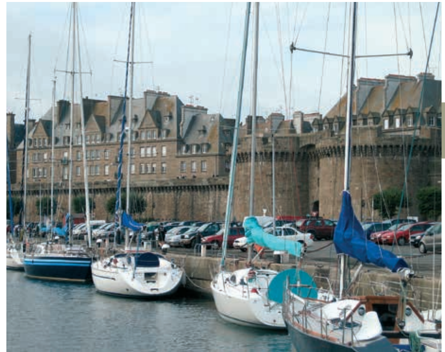
Jachthaven van Saint-Malo en de muren van de ville close.

De hele ville close is een bezienswaardigheid op zich. Het is een prachtige stad: statige granieten huizen, mooie winkelstraten met fraaie uithangborden, winkeltjes in de stadsmuren en de kathedraal, waarvan de spitse toren boven de huizen uitsteekt. In het koor is een mozaïek van Cartier die in 1534 neerknielt voor zijn tocht naar Canada. De gotische kerk heeft mooie vensters, zowel oude als nieuwe.