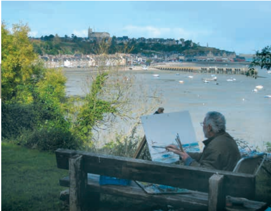
Zicht op Cancale, in het uiterste puntje van de streek.

koppen, een wirwar van liggende lichamen die uit de zee lijken te zijn aangespoeld, monsters met geopende muilen en volkse tafereeltjes, zoals dat van een man die zijn vrouw aan het haar trekt en tegen haar achterste schopt. Fouré maakte bij zijn werk gebruik van de natuurlijke vorm van de rotsen, maar helaas raken de beelden langzamerhand in verval.