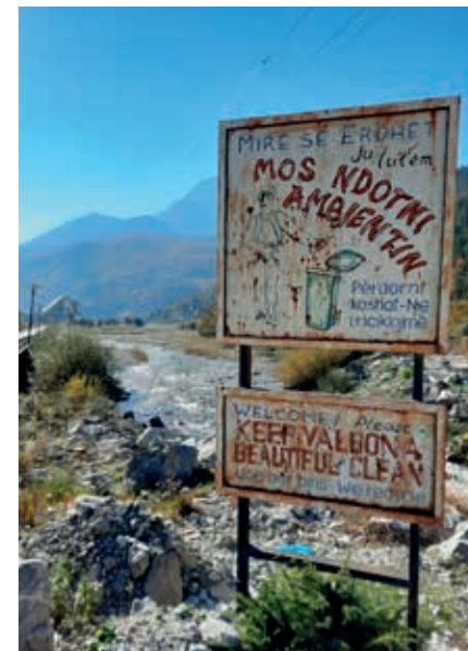
De lokale overheid doet een hoopvol beroep op wandelaars. Op de achtergrond het gigantische Valbona Resort and Spa.

Behalve naar Theth langs een deel van de Via Dinarica (zie p. 131) zijn er diverse mooie wandelingen vanuit Valbonë. Een uitdagende hike van in totaal rond 9 uur is die naar Maja e Rosit, of Rosni Peak (2524 m), pal aan de grens met Montenegro. De gemarkeerde route met fantastische panorama's begint aan de overkant van de rivier en loopt via Kukaj. Reken er niet op dat je bij het barretje onderweg iets kunt krijgen.