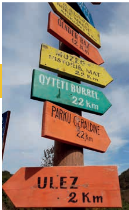
Bordjes voor de brug over de Mat bij het mooie Ulëz langs de SH6.

het verzet van een groep van enkele honderden inwoners de woede van de Italiaanse bezettingsmacht dusdanig op, dat deze de stad in 1943 zo goed als met de grond gelijkemaakt heeft. De communisten, die Burrel hielpen herbouwen, wilden voor de exploitatie van mijnen het afgelegen bergland ontsluiten met de aanleg van een spoor. Maar het spoor werd nooit voltooid, de mijnbouw bleef schamel, Burrel werd verlaten en het regime koos de plaats als verbanningsoord voor dissidenten. De gevangenis van Burrel, die ondanks protesten ook vandaag nog in gebruik is, werd een van de beruchtste gevangnissen in heel Albanië.