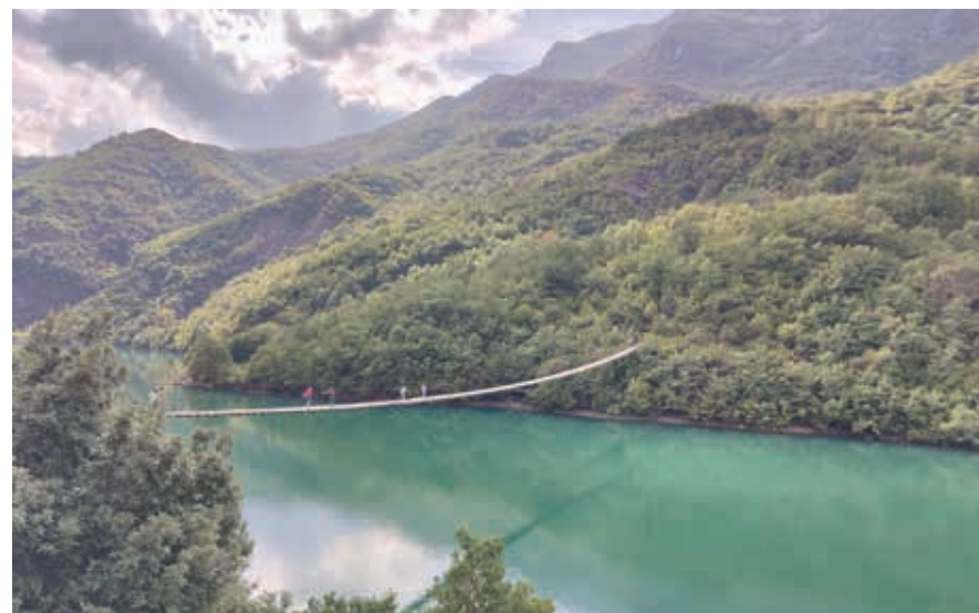
De Serinabrug, middelste van de drie houten hangbruggen over de Mat bij Shkopet, met een paar jonge avonturiers.

Hoewel je in Albanië makkelijk verwend raakt door het overvloedige natuurschoon, is toch ook de rit van Burrel over de SH6 naar het noordwesten weer vol verrassingen. Je ziet eiken, fluweelbomen, acacia's, varens en