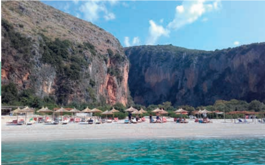
Hoe moeilijker te bereiken, hoe groter de beloning: een stelregel die zeker opgaat voor het strand van Gjiropë, ver van de weg tussen Dhërmi en Vuno.

waaraan ook Nederlandse architecten van Cityföörster hebben meegewerkt. Het gaat om accommodatie verspreid over een groep smaakvol gerestoreerde oude huizen, naar het voorbeeld van de Italiaanse albergo diffuso . Beneden bij de kust liggen twee stranden, noordelijk het strand van Drymade, zuidelijk dat van Dhërmi. De weg ernaartoe is bezaaid met hotels, bars, restaurants en clubs.