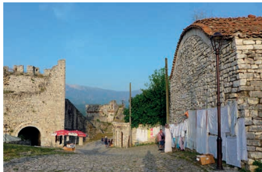
Wasgoed bij de vroegere wapenopslagplaats vlak na de ingang van het kasteel van Berat.

De citadel zou ooit het onvoorstelbare aantal van 42 kerken hebben geteld. Een van de meest opvallende die er nog is, is de 13de-eeuwse Kisha Shën Triadha, gebouwd tegen de heuvel van het hoogst gelegen stuk, de akropolis . De oudste is de Kisha e Shën Mary Vllaherna (zie foto p. 37), een kleine kerk met een patchwork van steensoorten en bouwwijzen, waarvan de fundamenten mogelijk zijn gelegd in de 5de eeuw. Je ziet in de buitenmuur onder andere de techniek van clausonage , vierkantjes van stenen ingesloten door tegels. De kerk kreeg haar huidige naam nadat Berat de aanval van de Angevijnen in 1281 had weten af te slaan. In het interieur zijn fresco's te zien van Nikola, de zoon van Onufri, uit 1578. Sinds de zomer van 2023 is de kerk voor bezoekers opengesteld.