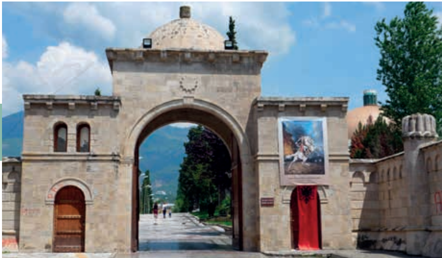
Toegangspoort van het Bektashi World Center in de Rruga Bajo Topulli aan de oostkant van Tirana.

genomen bouwwerk weinig te maken. Het werd ontworpen door de dochter en schoonzoon van Enver Hoxha als museum voor diens nalatenschap, maar heeft die status nooit gekregen. Na 1991 werd het gebouw herbestemd tot conferentie- en expositieruimte. Tijdens de Kosovo-crisis in 1999 deed het dienst als basis voor de NAVO en enkele hulporganisaties. En sindsdien, terwijl het monument verviel tot klimobject en decor voor horrorfilms, heeft afbraak of herbestemming zo'n beetje jaarlijks op de stedelijke agenda gestaan. Uiteindelijk werd de opdracht voor een nieuw ontwerp toegekend aan het Rotterdamse MVRDV, die van het brutalistische experiment een innovatieve techhub heeft gemaakt. Eind 2023 werd de selfiemagneet in het bijzijn van onder anderen Emmanuel Macron en Mark Rutte officieel geopend door premier Edi Rama.