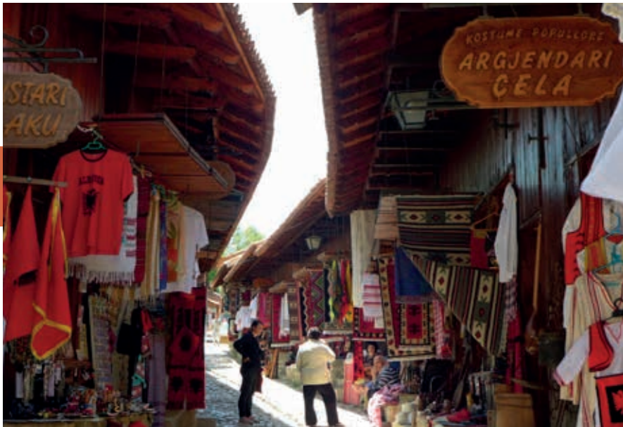
De bazaar van Krujë, die vanaf een uur of tien 's morgens tot 's avonds afgeladen is.

ligging van de plek kom je op een vrij directe manier in contact met het leven van toen. Vergeet niet jezelf in traditionele kleding te laten vereeuwigen.