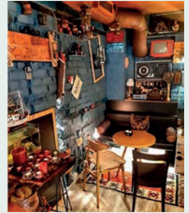
Interieur van de populaire Bar 18°.