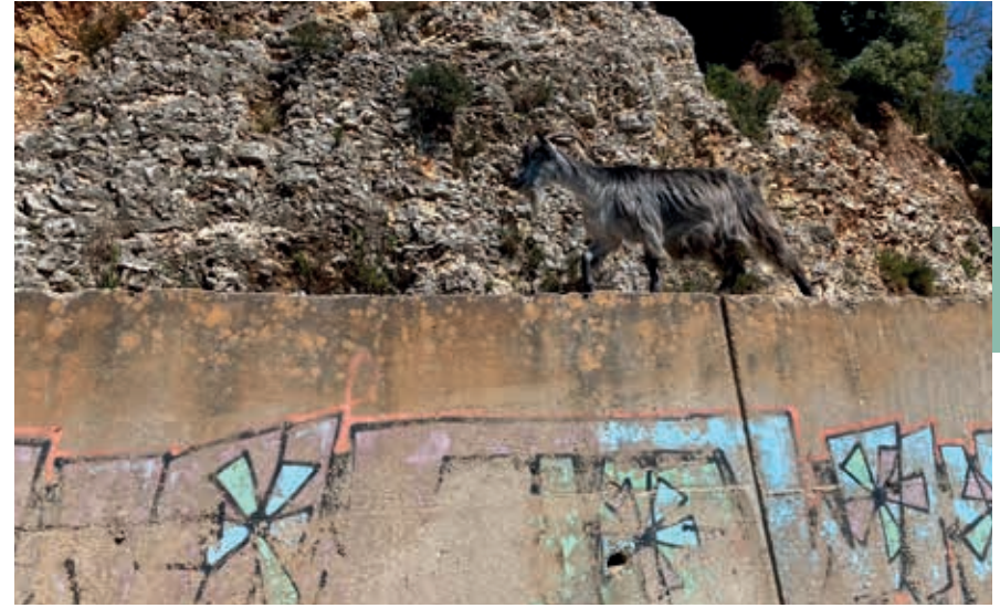
Gecamoufleerde geit in Himarë. In de molentjes herkennen we een Grieks nationalistisch sentiment.

In Vuno, het volgende dorp, vind je de verlaten resten van de Basiliek van Sint-Spiridon Vuno, een cultureel monument. De basiliek werd eind 18de eeuw gebouwd op oudere fundamenten. Je ziet behalve graffiti resten van fresco's en een zwaar aangetaste iconostase, decoraties waaraan destijds alle dorpingen meebetaalden, zo meldt een inscriptie. Ga rechtsaf richting strand en direct weer rechtsaf. Het mooie zandstrand van Jalë is nog een stuk verder naar beneden langs de hoofdweg. Aan de noordkant vind je het trendy Folie Marine en op ongeveer 1 km naar de andere kant de relatief stille baai Gjiri i Akuariumit waar het prachtig snorkelen moet zijn.