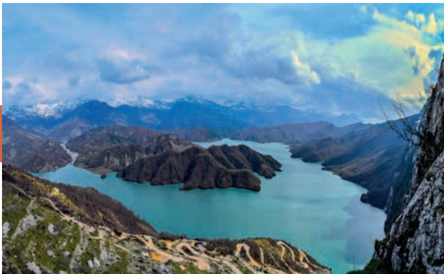
Het Bovilla Meer, een groot water-reservoir tussen Krujë en Dajt, dat in drinkwater voor Tirana voorziet.