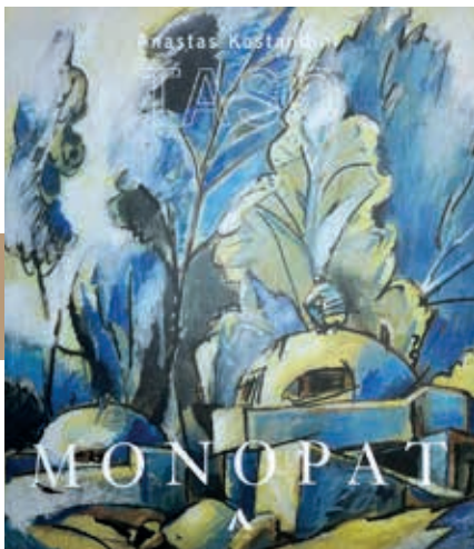
Boek met het werk van Taso. Op het afgebeelde schilderij Bunkëret uit 2001 is wel duidelijk wie en wat 'te kakken' staat.

klimaat van het communisme, dat alleen de utopische plaatjes wilde van een maatschappij in bloei. Ook van hem werd werk vernietigd. Zijn atelier toont een explosie van ideeën, beelden en fantasieën in olieverf, pastel en hout. Als hij thuis is, ontvangt hij je graag in zijn studio aan de Rruga 24 Maji.