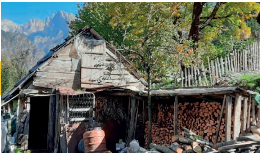
Schuurtje bij Guesthouse Mehmeti in Quku i Valbonës.

kapotte autobanden, zouden net voor Bajram Curri de afslag bij Dojan kunnen nemen voor een avontuurlijk tochtje naar Hotel Restaurant Chestnut Hill (Kodra e Gështenjave). Hier kun je eten en slapen met een heerlijk vrij uitzicht. In de buurt van het hotel loopt een wandelpad van 5 km naar een klein meer tussen de kastanjabomen door.