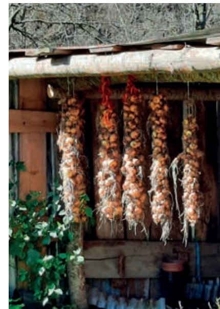
Uien die in de herfst te drogen hangen in Vermosh.

Terug naar de route vanuit Koplik, waar even buiten de stad langs de SH21 eenzaam in het vlakke landschap het gevangeniscomplex Burgu i Reçit opduikt, dat in 2018 in gebruik genomen werd en 780 cellen telt. Ongeveer 10 km na Koplik is er een afslag naar Razëm , een wat rommelige mix van