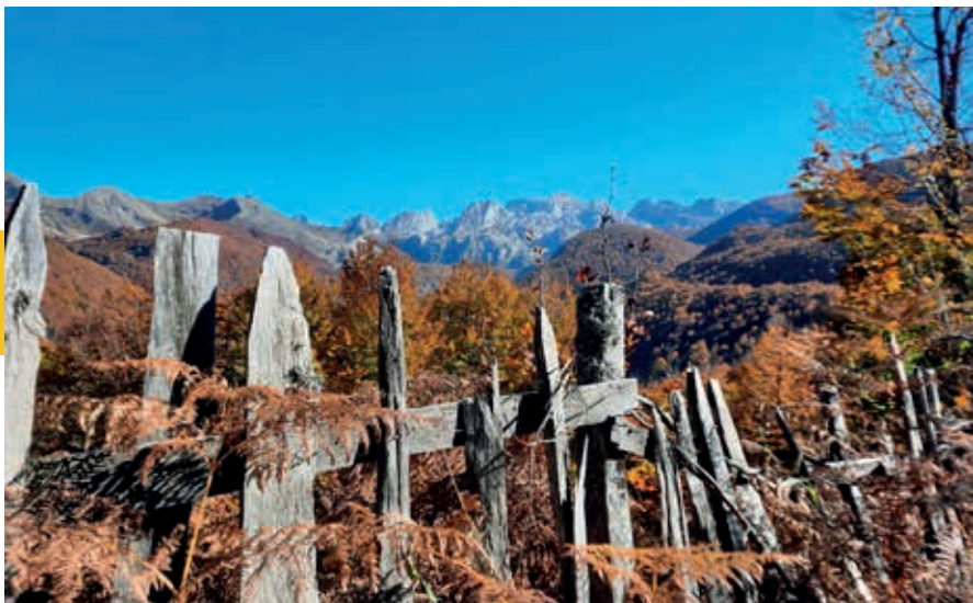
Uitzicht op de stille bergen en de 2057 m hoge Maja e Vajushës vanuit Lepushë.

Deze noordelijke punt van Albanië, waar je buiten de zomermaanden de ijzige adem van de bergen al kunt voelen, heet Kelmend en staat behalve om zijn bijna uitgestorven culinaire tradities bekend om zijn krijgshaftige bevolking. Veel land werd hier door buurlanden veroverd en weer terugveroverd. Ook Vermosh , aan het eind van de SH20, heeft altijd in de vuurlinie gelegen. Veel is het niet, enkele tientallen stenen huizen en boerderijen langs zo'n 10 km van de gelijknamige rivier op een hoogte van 1050 m tussen de bergen. Maar de sfeer is er een van een ruige eenvoud die je hart kan raken, zo getuigen ook de reviews van motorrijders die in de boomgaard van Guesthouse Peraj, mogelijk onder invloed van wat zelfgestookte raki, momenten vonden van puur en ongecompliceerd geluk.