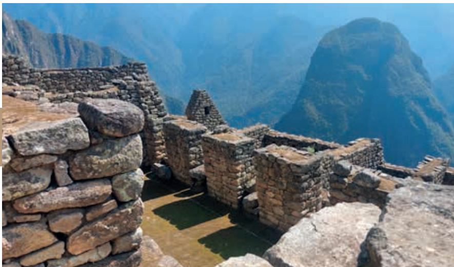
De stad wordt omgeven door een grillig landschap.

Urubambarivier rijden en vervolgens de trein naar Aguas Calientes nemen, maar een andere mogelijkheid is om de berg Llaqtapata te beklimmen (2700 m) en daarna pas de trein te pakken. Op de vijfde dag neem je dan de bus vanuit Aguas Calientes naar Machu Picchu.