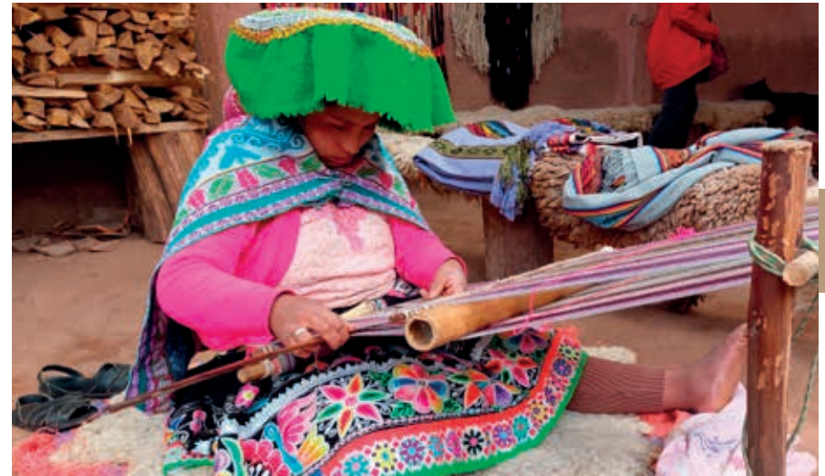
Een vrouw uit Chinchero zit aan een weefgetouw.

Het bijzondere van Ollantaytambo is dat een deel van de huidige bevolking nog in de oorspronkelijke huizen woont. De nauwe straten dragen nog