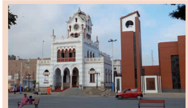
De verwoeste en de nieuwe de kerk van Pisco.

De excursie naar de eilanden vindt altijd 's ochtends plaats, waardoor de deelnemers vaak al vroeg bij hun hotel worden opgehaald. Wellicht omdat de dieren op en rond de eilanden daarmee maar een deel van de dag ge-