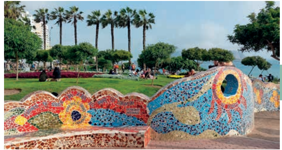
Het prachtige Parque de Amor aan de boulevard.

Aantrekkelijk is een wandeling over de kliffen boven de stranden, over de Malecón ofwel de boulevard van Lima, met mooie uitzichten over de baai van de stad. Vanaf Larcomar loop je daar van het ene mooie park naar het andere, zoals het Parque de Amor, het Parque Chino en het Parque de María Reiche waar plantsoentjes zijn aangelegd in de vorm van de Nascafiguren. Ook kom je langs tennisbanen, een skatebaan en is er zelfs een mogelijkheid om te gaan paragliden. Onderweg staan verschillende horecatentjes, waar je kunt genieten van de weidse uitzichten over de oceaan.