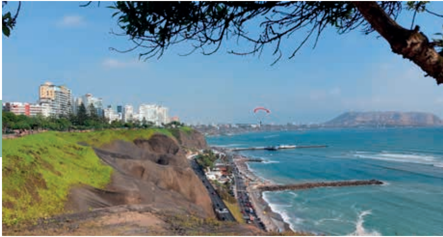
De indrukwekkende afgegraven Malecón.

sage met aan weerszijden vele pizzeria's, elk met een eigen terras, die bij elkaar een redelijk assortiment aan gerechten en drankjes serveren.