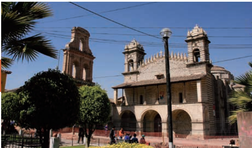
De kerk van Santo Domingo in Ayacucho. Aan de klokkentoren links werden slachtoffers van de inquisitie opgehangen.