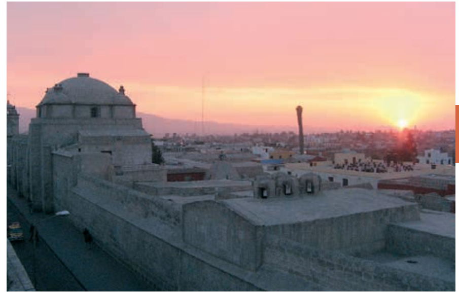
Zonsondergang boven Arequipa.

Weinig toeristen in Arequipa zullen een bezoek aan het Monasterio de Santa Catalina overslaan. Dit imposante klooster werd in 1579 in gebruik genomen. Het bouwwerk bestaat voornamelijk uit vulkanisch steen en bestrijkt ongeveer 20.000 m 2 . Door de vele aardbevingen werd de structuur van het klooster nogal eens aangetast. Uiteindelijk ontstond er een soort stadje met een indeling in verschillende wijken. De straten zijn vernoemd naar grote Spaanse steden en door de bouwstijl waan je jezelf in Andalusië. Het klooster had de functie om de dochters van de meest vooraanstaande families in de stad op te nemen. Om toegelaten te worden moesten de meisjes een forse bruidsschat betalen. Diegenen die zich na enkele jaren opleiding als novice tot non lieten wijden, kozen daarmee voor absolute afzondering. Met de familie mocht alleen nog via een traliehek, te bezichtigen vlak bij de ingang, gesproken worden en voor de rest was elk contact met de buitenwereld verboden. Daar stond tegenover dat de nonnen hun eigen dienstpersoneel (inclusief tot slaaf gemaakte vrouwen) hadden en ruime appartementen met eigen keukens en voorraadkast. Voor veel jonge vrouwen