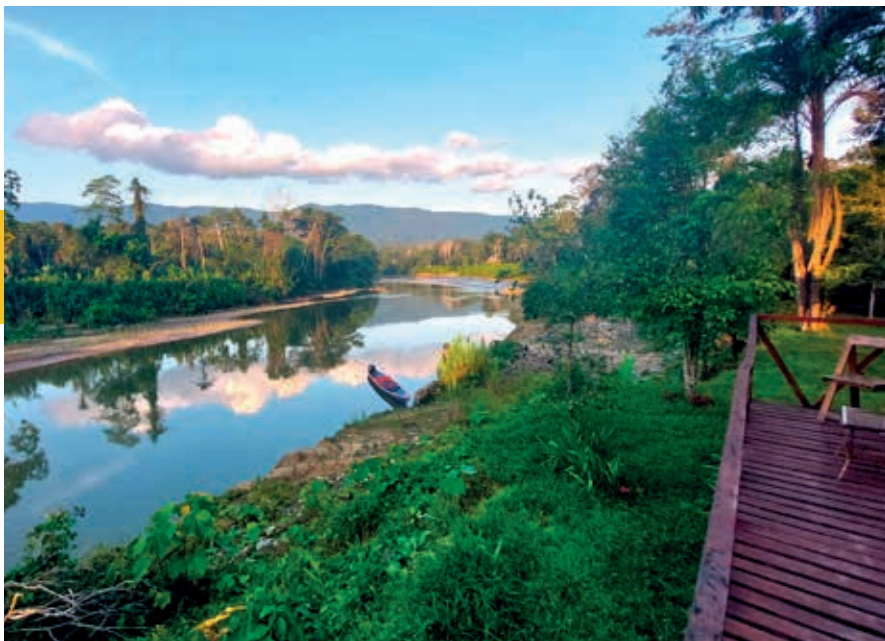
Uitzicht over de rivier vanuit een lodge in Parque Manú.

een enorme biodiversiteit die voor een deel nog niet is aangetast. Samen met de Zona Cultural en de Zona Reservada behoort het park tot de Reserva de Biosfera de Manú . Dit reservaat is door de UNESCO in 1987 tot Werelderfgoed verklaard.