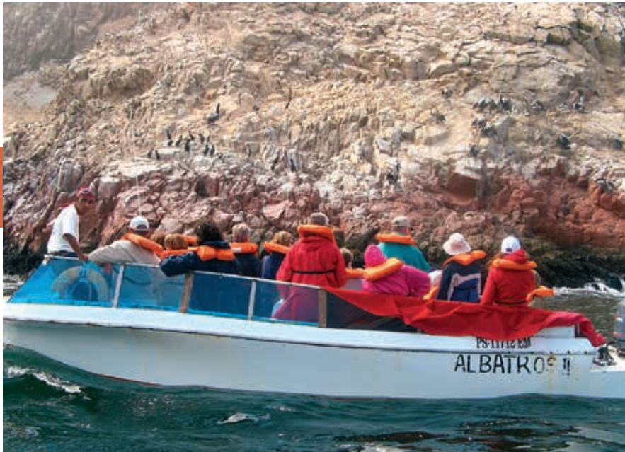
Met een bootje naar de Ballestaseilanden.

Er zijn hier nog steeds talrijke reisbureautjes die vooral excursies naar Paracas en de Islas Ballestas aanbieden. Opvallend zijn de motortaxi's, die je in Lima zelden ziet, maar die hier vanwege de aangename temperatuur goed dienstdoen. Verder is er een wandelpromenade, El Bulevar, die tussen de vele winkeltjes en restaurants aan weerszijden door voert.