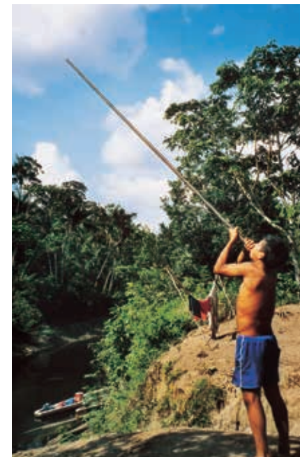
Urarinajongen met blaaspijp voor de jacht.

Met een bezoek aan de Zona Reservada (ook wel Zona Experimental) ben je duurder uit, maar krijg je ook meer te zien. Dit gebied is namelijk geheel gereserveerd voor onderzoek en toerisme. Het is een gebied met primaire bossen dat wordt doorsneden door de rivier Manú. Het is mogelijk om vanuit Cusco naar Boca Manú op de grens van de zone te vliegen, maar verder