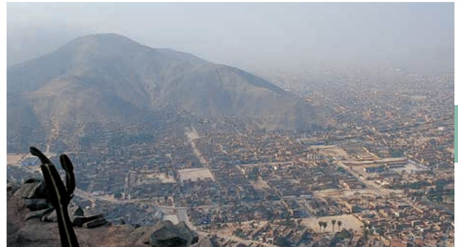
Altijd hangt de garúa boven Lima.

Hoewel het witte deel van de Peruaanse bevolking van oudsher in de kuststeden woont, heeft Lima een duidelijk multicultureel gezicht. Vooral in de pueblos jóvenes, de marginale woonwijken, wonen veel migranten die afkomstig zijn uit het binnenland. Het betreft hier zowel mestiezen uit de Andes als indianen uit het Amazonegebied. Daarnaast hebben in de loop van de tijd veel buitenlandse immigranten uit andere Latijns-Amerikaanse landen, maar ook veel Aziaten, hun plek in Lima gevonden. Onder hen waren er velen die hoopten op een beter leven. Door de enorme bevolkingsdruk was het echter lang niet voor iedereen mogelijk om een goed bestaan te creëren. Dit openbaarde zich jarenlang in de vorm van de informele sector die op grote schaal binnen de stad aanwezig was. Vooral het centrum van de stad werd overspoeld door ambulantes , zoals straatverkopers, schoenpoetsers, mensen die de bloeddruk opnemen, straatartiesten en geldwisselaars. En niet te vergeten de talloze informele taxi's die door particulieren gerund werden. Een groot deel van deze informele dienstenaanbieders is uit het straatbeeld verdwenen, verplaatst naar speciaal ingerichte marktplaatsen elders in de stad of doodgewoon verjaagd op straffe van hoge boetes. Alberto Andrade, de burgemeester van Lima in de jaren 90, schiep er een persoonlijke eer in om de binnenstad schoon te vegen. Dat de stad daarmee aan