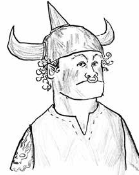
Snotsmoel Snotvlerk De beste van de klas in beukbal, Grofheid voor gevorderden, Zinloos geweld en alle andere dingen