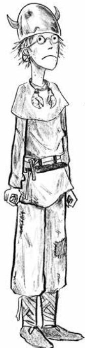
Hikkies beste vriend Vissenpoot