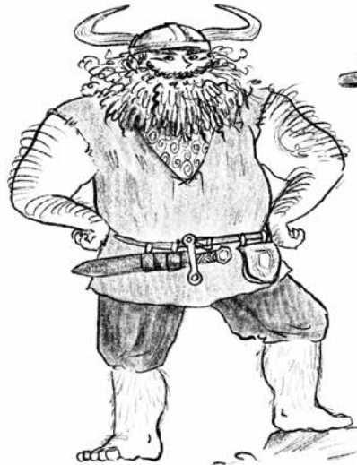
Stompus de Reus Hikkies vader en stamhoofd van de Vuige Vandalen (sterk, maar niet zo slim)