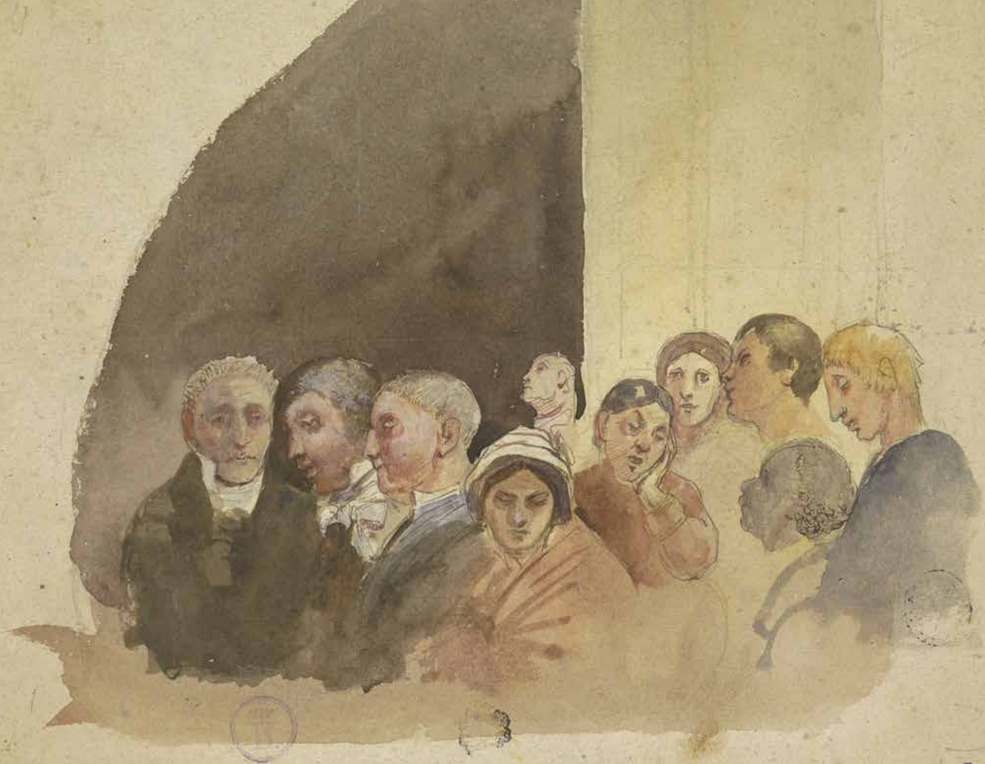
EUGÈNE LAERMANS (1864-1940) VERVEELDE TOESCHOUWERS BIJ EEN PUBLIEKE VOORSTELLING (ONGEDATEERD)