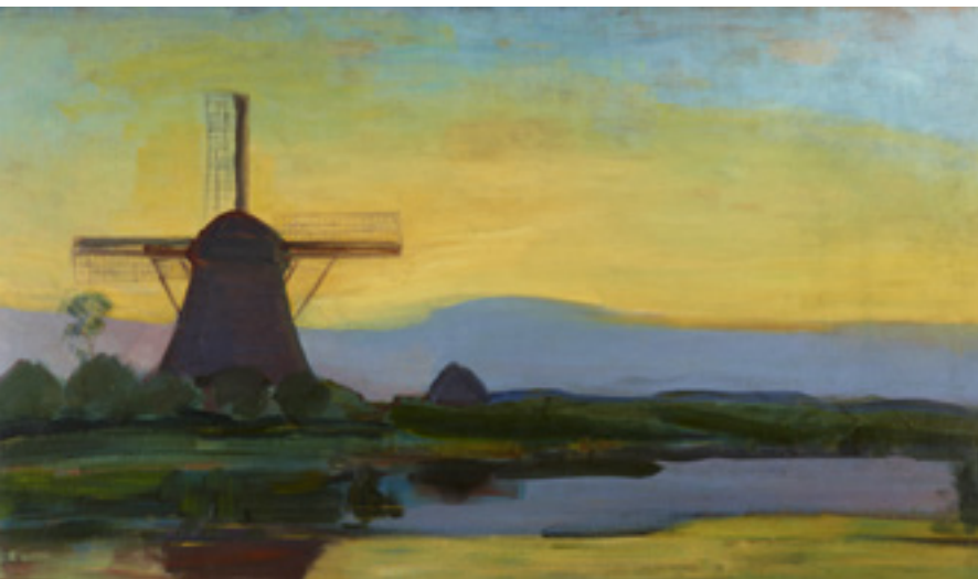
Oostzijdse molen bij avond, 1907-1908