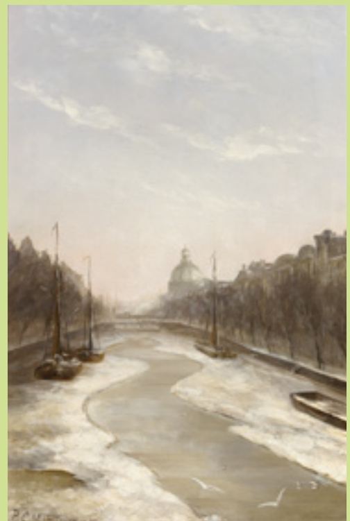
Het Singel, Amsterdam, 1893