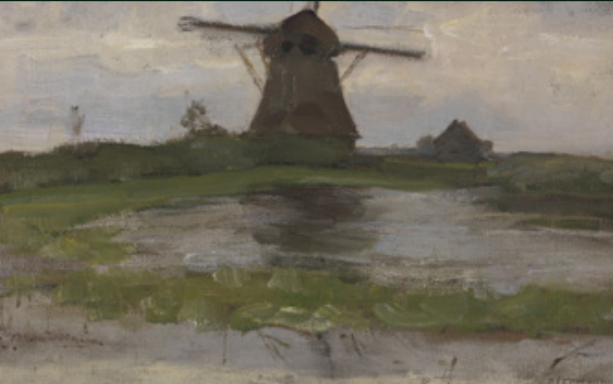
Oostzijdse molen, 1905-1906

Mondriaan begon als landschapsschilder. In zijn tijd stond Nederland nog vol molens. Hij heeft er veel getekend en geschilderd. Zie je hoe snel zijn stijl verandert?