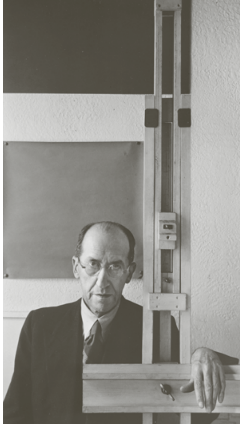
Mondriaan in 1942.

Wil je Mondriaan in Nederland nareizen? Kunstmuseum Den Haag heeft de grootste collectie Mondriaans ter wereld. www.kunstmuseum.nl/nl/collectie De plek waar Piet geboren werd, het Mondriaanhuis in Amersfoort, is nu ook een museum. www.mondriaanhuis.nl