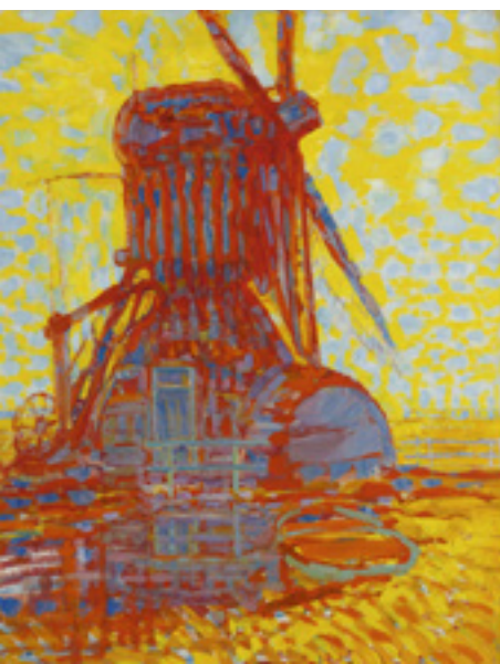
* Molen; Molen bij zonlicht, 1908

Mondriaans molen werd gebouwd in 1874. Hij bestaat nog steeds en is nog altijd in gebruik. Je kunt de Oostzijdse Molen bewonderen in Abcoude, aan het Gein, vlak bij Amsterdam. Weet jij waar hij voor diende?