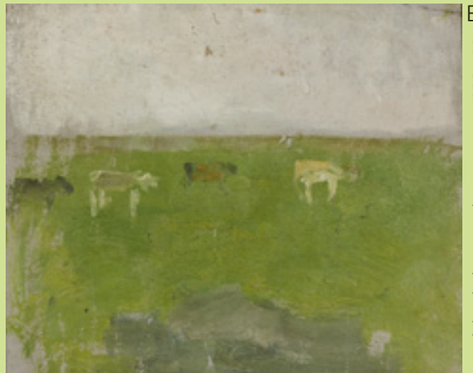
Weidelandschap met koeien, circa 1900-1901

Lente ..... Zomer ..... Herfst ..... Winter .....