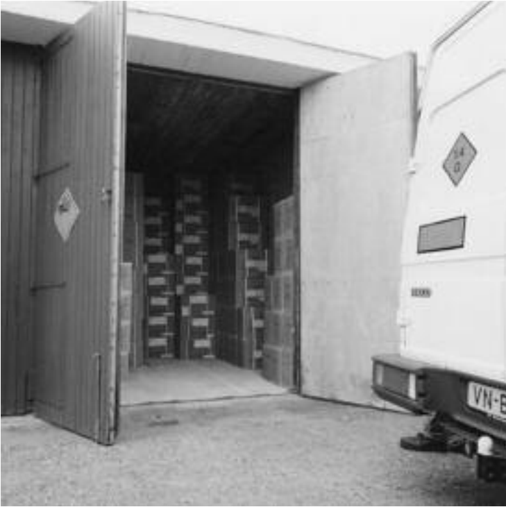
Een opslagbunker van SE Fireworks.

voor scherfwerking bij. Vuurwerk van de categorie 1.1 is het allerzwaarst. Voorbeelden zijn titanium shells (12 inch) en titanium salutes (3 inch). Dit zijn extreem zware vuurwerkbommen. Het 1.1-vuurwerk is vooral zo gevaarlijk omdat het tot een massa-explosie kan leiden.