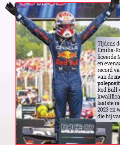
Tijdens de grand prix van Emilia-Romagna 2024 kwalificeerde Max zich als snelste en evenaarde daarmee het record van Ayrton Senna (BRA) van de meeste opeenvolgende polepositions in de F1 : 8. De Red Bull-coureur begon zijn kwalificatierace tijdens de laatste race van het seizoen 2023 en won 6 van de 8 races die hij vanaf pole startte.