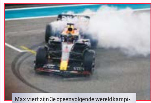
Max viert zijn 3e opeenvolgende wereldkampioenschap tijdens de grand prix van Abu Dhabi in 2023. Hij had de concurrentie vernietigd met de meeste F1-racezeges in een seizoen , 19, een verbazingwekkende 86% van de 22 grands prix.

In 2021 behaalde Max zijn eerste wereldkampioenschap door Lewis Hamilton in de laatste ronde van de laatste race van het seizoen in te halen. Sindsdien was Max niet meer te stoppen en won hij 15 races in 2022 en 19 in 2023.