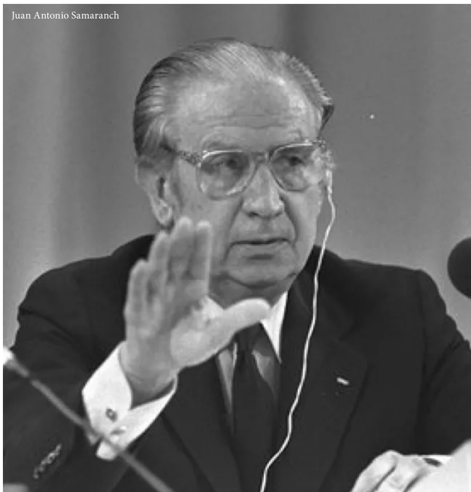
Juan Antonio Samaranch

Afkeer van corruptie dwingt de bonden er niet alleen toe om qua boekhouding hun fatsoen te houden. Met die publieke opinie sijn vaak ook politieke kwesties door in het ooit zo gesloten domein van de bobo's. Vroeger konden sportbonzen te pas en te onpas beweren dat sport en