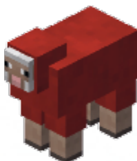
ROOD - 2 punten