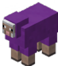
PAARS - 6 punten