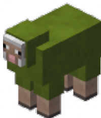
GROEN - 5 punten