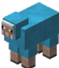
BLAUW - 4 punten