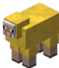
GEEL - 3 punten