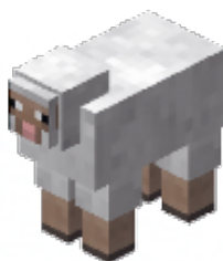
WIT - 1 punt

Elke wolkleur is een ander puntenaantal waard en de winnaar is de speler die aan het eind van het spel de meeste punten heeft. Zorg ervoor dat iedereen weet hoeveel punten elke kleur waard is. Je kunt de waardes hieronder aanhouden, of je eigen systeem verzinnen.