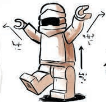
De klappende kraanvogel

Zij die de klappende kraanvogel op een verschrikte aap doen lijken, staan voor een grote uitdaging.