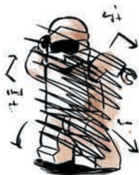
De aarzelende aap

Tijdens hun ochtendgymnastiek konden de ninja's zich niet concentreren. Daarom moeten ze trainen totdat ze weten hoe ze het beste hun vijand kunnen verslaan.