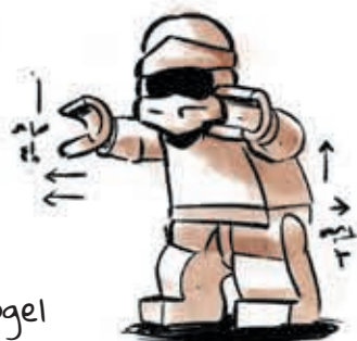
De knijpende krab