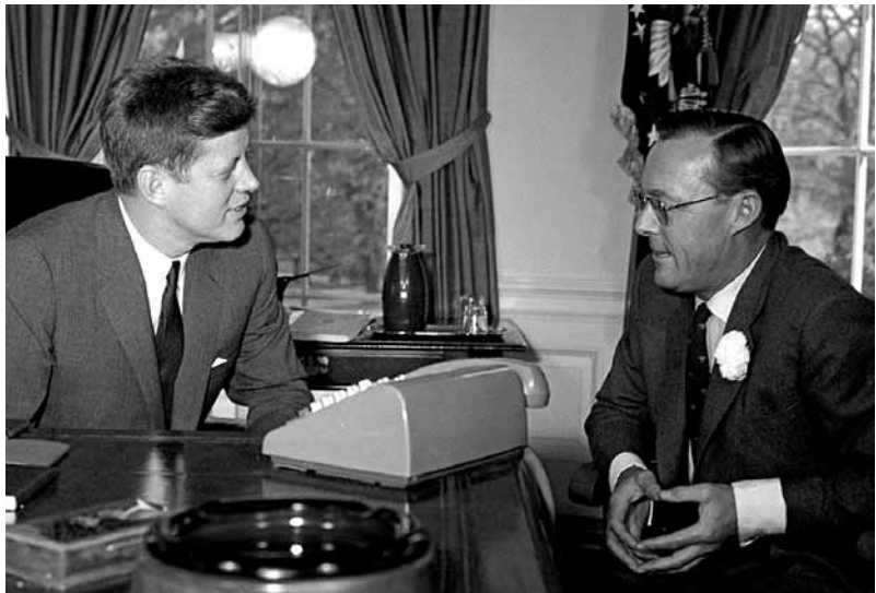
Prins Bernhard in 1961 op bezoek bij de Amerikaanse president John F. Kennedy.

Volgens onderzoekers ging de prins daarbij vooral uit van de belangen van het Nederlandse bedrijfsleven, dat schade ondervond van de slechte verhouding met Indonesië. De prins luisterde ook naar de mening van de top van de krijgsmacht, die Nieuw-Guinea slecht verde-