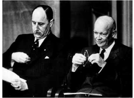
De Nederlandse minister mr. J.M.A.H. Luns van Buitenlandse Zaken (links) met de Amerikaanse president Dwight D. Eisenhower.

De Sovjet-Unie probeerde de Amerikanen af te bluffen. 'De regering van de Verenigde Staten moet weten dat de USSR niet zal blijven toezien en dat betekent een wereldoorlog', dreigde de Russische krant Pravda. 'De vraag is of de VS het risico van de totale vernietiging willen lopen voor de verdediging van de Nederlanders?'