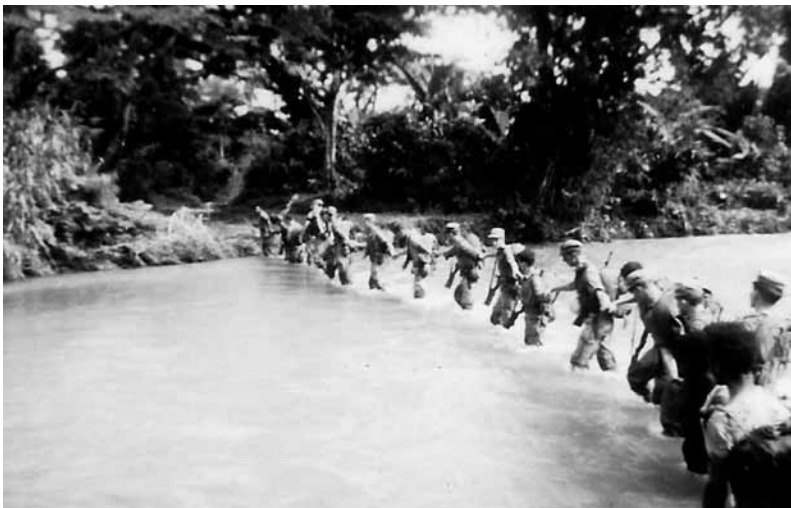
Patrouille op het eiland Japen (1959).

Tegen het eind van de jaren 50 versterkte en moderniseerde Indonesië zijn leger.