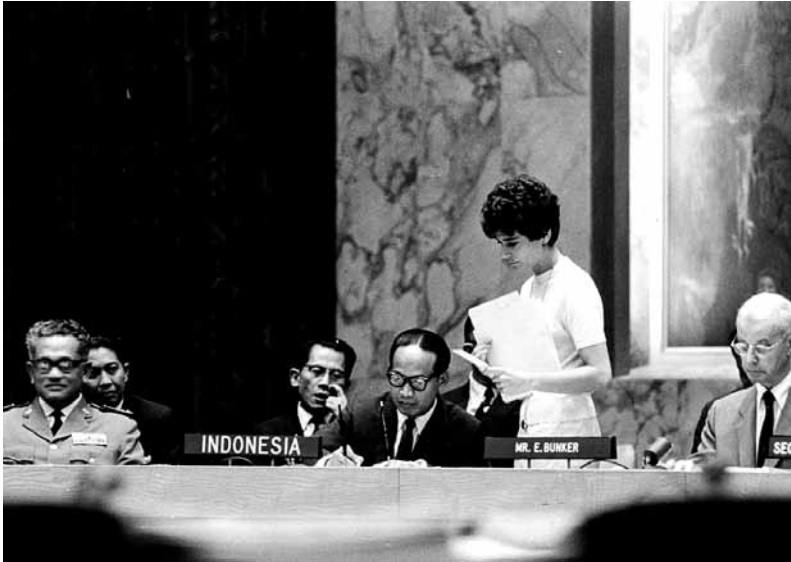
De Indonesische minister Soebandrio tijdens de ondertekening van het akkoord. Rechts Ellsworth Bunker, de diplomaat die de onderhandelingen leidde.