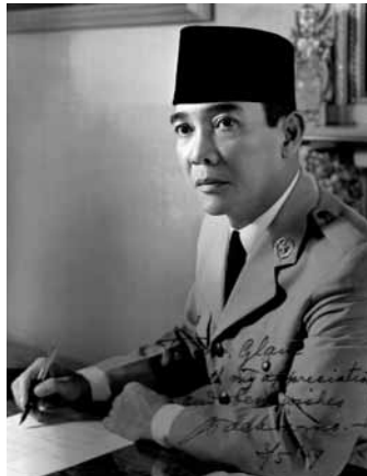
De Indonesische president Soekarno in 1959.

Het uitgangspunt om binnen een jaar na de soevereiniteitsoverdracht overeenstemming over Nederlands-Nieuw-Guinea te bereiken, werd dan ook niet gerealiseerd. Soekarno eiste het gebied echter op. Door in zijn lange toespraken voortdurend aandacht te vragen voor Nieuw-Guinea, hitste hij zijn volk op en probeerde hij de aandacht af te leiden van de corruptie, criminaliteit, economische achteruitgang, moslimopstanden en andere grote problemen waarmee hij in zijn land kampte.