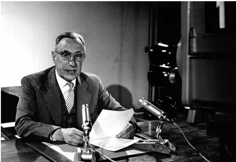
Kort nadat het akkoord tussen Nederland en Indonesië betreffende Nieuw-Guinea was ondertekend, richtte de Nederlandse minister-president prof. dr. J.E. de Quay zich via radio en televisie tot zijn volk om bekend te maken dat Nieuw-Guinea werd afgestaan. Via radio Nederland Wereldomroep was de toespraak ook op het omstrede eiland zelf te beluisteren.