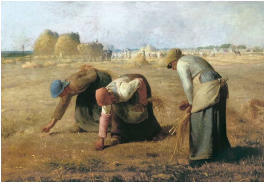
Jean-François Millet Arenleesters

Een paar jaar later, in 1873, wordt Vincent overgeplaatst naar het Londense filiaal van Goupil. Hij gaat eerst nog langs Brussel (de stad waar Theo werkt, ook voor Goupil) en Parijs, waar hij het Louvre, het Luxembourg en de beroemde tentoonstelling Salon de Paris bezoekt. In de Engelse hoofdstad hecht hij minder belang aan zijn werk en komt de innerlijke kwetsbaarheid die zijn bestaan zo tragisch tekenet naar buiten. Mede vanwege zijn karige inkomen leidt de jonge Vincent een monotoon en teruggetrokken leven. Hij bezoekt overigens wel musea en galleries, en tijdens lange wandelingen langs de Theems maakt hij schetsen en ontwerpen – zijn eerste artistieke uitingen – die hij meteen weer vernietigt. Maar hij lijdt vooral onder een hevige teleurstelling in de liefde, die hem versombert en tot een soort mysticisme bezielt dat gaandeweg in een authentieke religieuze toewijding overgaat. Ook met zijn overplaatsing naar Parijs (eerst tijdelijk en dan vanaf mei 1875 definitief), nog altijd als werknemer van Goupil en ook weer dankzij de bemoeienis van ‘oom Cent’, overwint hij deze inzinking niet.