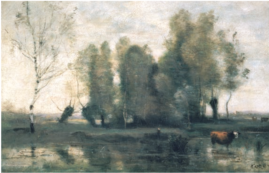
Jean-Baptiste-Camille Corot Bomen in het moeras

1855-1860, olieverf op doek, 25,5 x 38 cm Sint-Petersburg, Hermitage