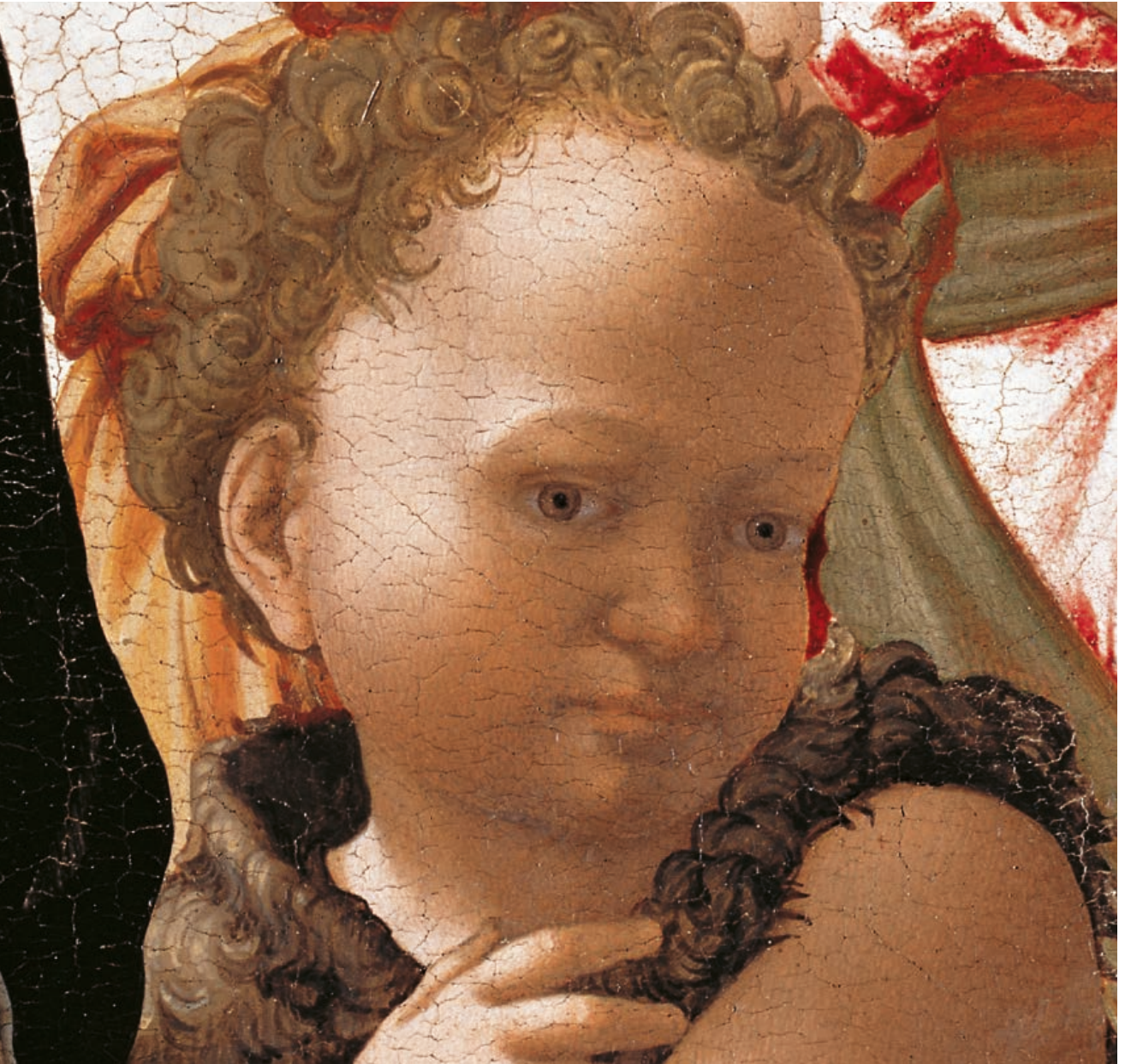
circa 1497, tempera op paneel, 105 x 76 cm , Londen, National Gallery