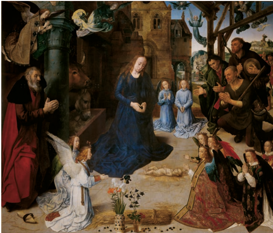
Hugo van der Goes Portinari-triptyek, middenpaneel