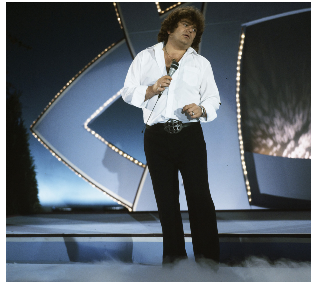
(Boven: Tijdens de benefietavond 'Een Gebaar' voor Amnesty International in theater Carré, mei 1983.) (Onder: In Op volle toeren , 1982, het televisieprogramma van de TROS dat het Nederlandse levenslied promoveert (maar volgens sommigen een smartlappenprogramma was).)