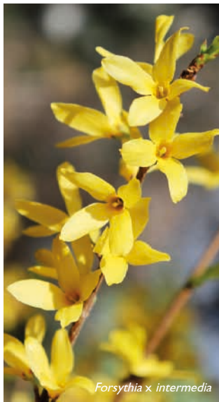
Forsythia x intermedia

Vroeg in het voorjaar is een Chinees klokje niet te missen. De struik is dan overdekt met gele bloemen. Het is een wat slordig groeiende struik die het beste na de bloei flink teruggesnoeid kan worden om een goed model te houden. Door de uitgebloeide takken eraf te knippen wordt de groei van nieuwe scheuten gestimuleerd die het volgende jaar bloeien. Na de bloei is het een saaie struik zonder verdere sierwaarde. Van de zes soorten komen er vijf oorspronkelijk in China, Japan en Korea voor. Forsythia x intermedia ontstond al in 1878 uit een kruising van Forsythia suspensa en Forsythia viridissima . Van deze kruising werden veel cultivars ontwikkeld. Forsythia x intermedia 'Spectabilis' bloeit rijk en wordt het meeste gekweekt. Forsythia x intermedia 'Densiflora' heeft grotere bloemen, maar bloeit iets minder rijk.