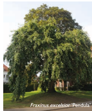
Fraxinus excelsior 'Pendula'

Fraxinus ornus , pluimes, Fraxinus americana , Amerikaanse es, en Fraxinus pennsylvanica , zachte es, zouden minder gevoelig zijn. Fraxinus excelsior 'Pendula' is een langzaamgroeiende boom met sterk afhangende takken die 8-10 m hoog wordt. Fraxinus excelsior 'Jaspidea', goudes, wordt 10-12 m hoog, heeft gele twijgen en geelgroen uitlopende bladeren die lichtgroen worden en een opvallende goudgele herfstkleur. De 15-20 m hoge smalbladige es, Fraxinus angustifolia 'Raywood', verkleurt in de herfst bijzonder mooi oranje tot paarsrood.