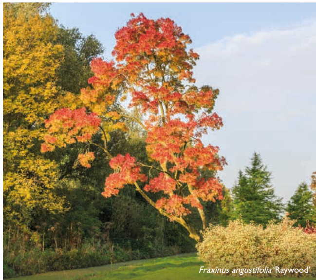
Fraxinus angustifolia 'Raywood'

De gewone es, Fraxinus excelsior komt in heel Europa in het wild voor. De boom kan 30-40 m hoog worden en is bladverliezend. De bladeren bestaan uit 7-13 deelbladjes en ze bloeien voordat ze in blad komen. Essen lopen laat in het voorjaar uit in opvallende zwarte bladknoppen. Na de bloemen verschijnen de gevleugelde vruchten die door de wind verspreid worden. De es laat zich net