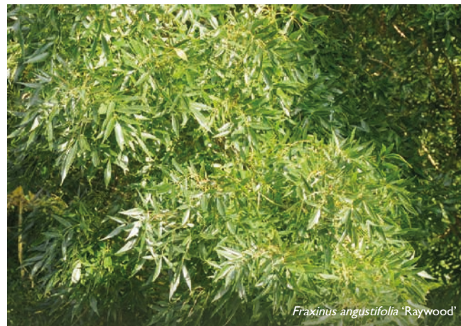
Fraxinus angustifolia 'Raywood'