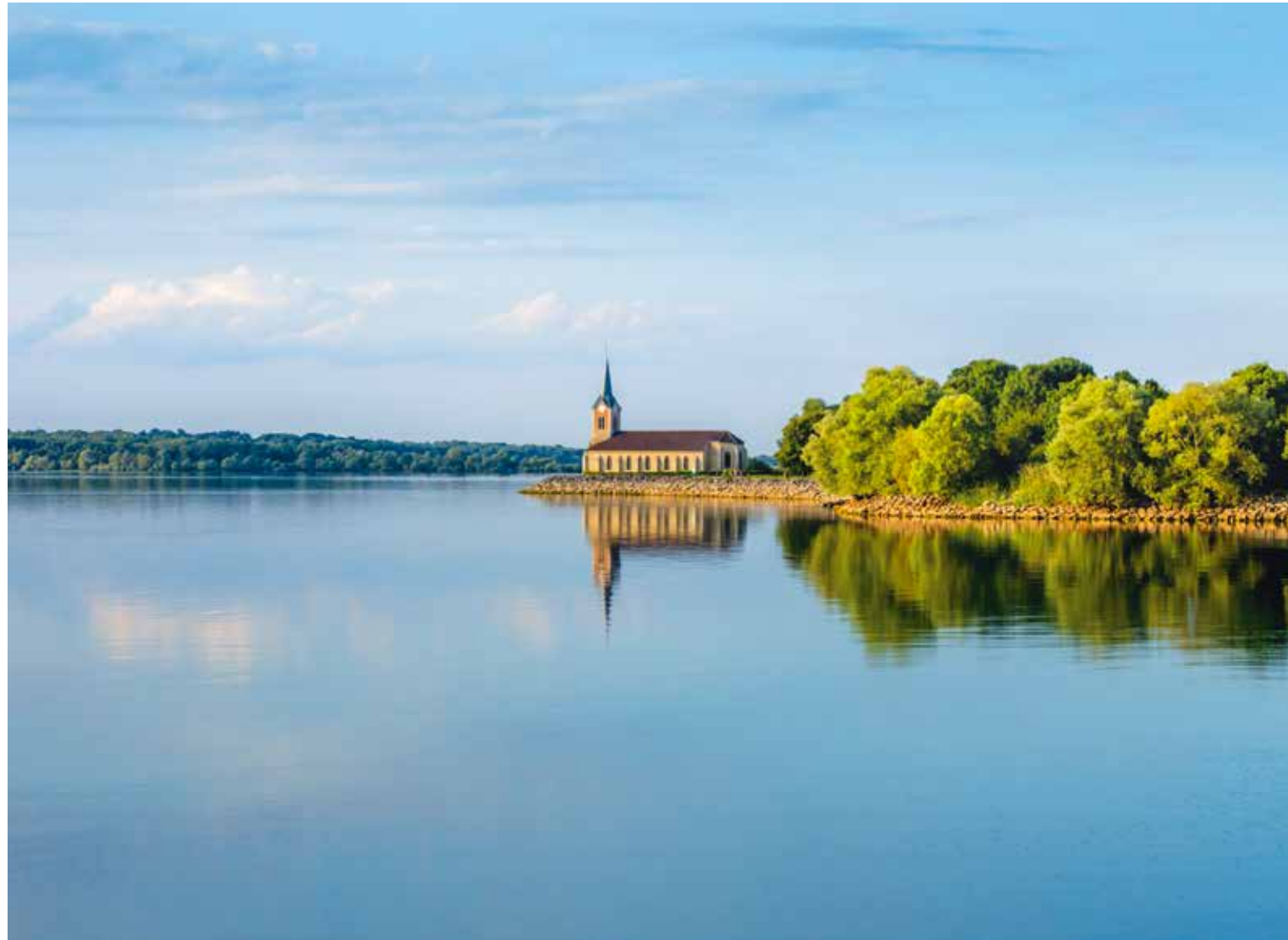
Boven: Het Lac du Der-Chantecoq even voorbij Vitry-le-François.