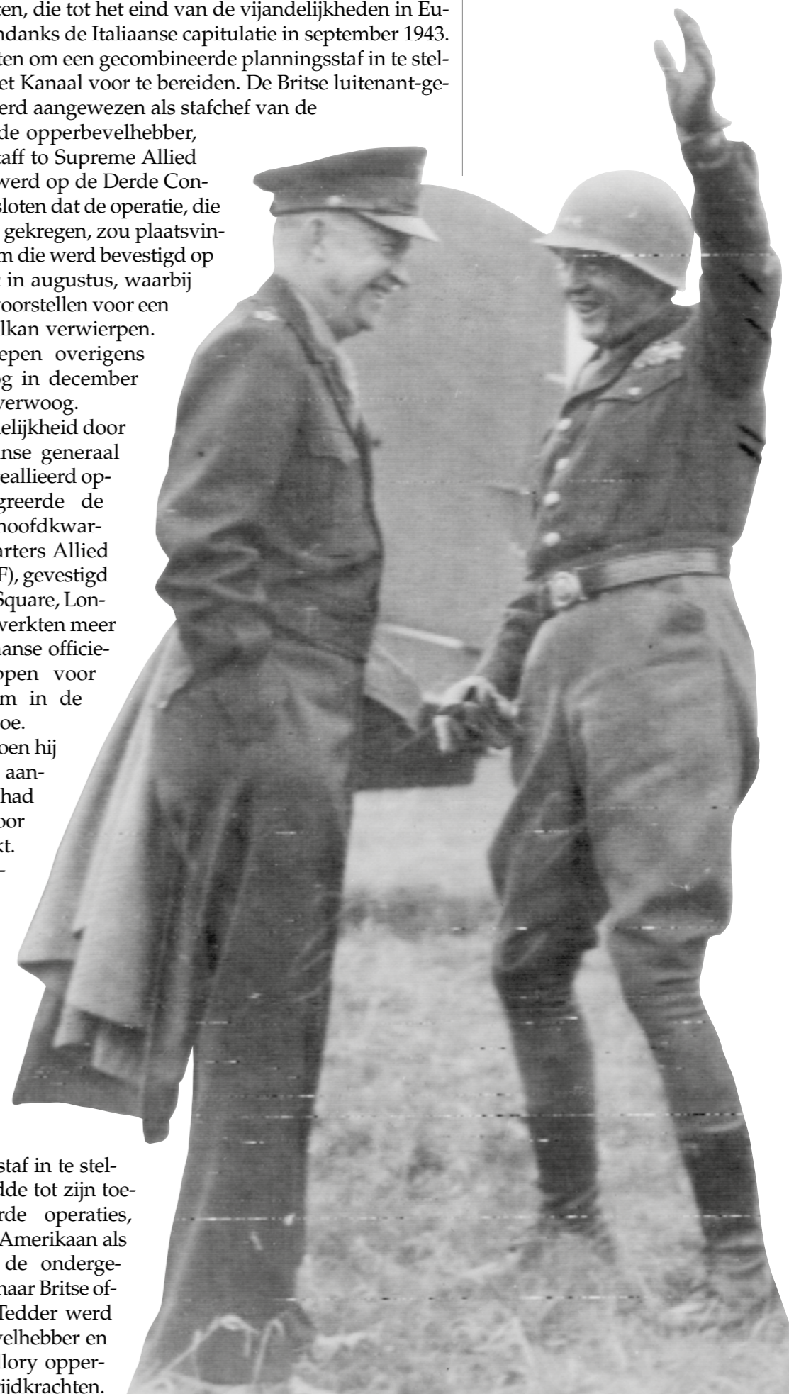
Rechts: Eisenhower en generaal George S. Patton, commandant van de fictieve Amerikaanse 1ste legergroep in Zuidoost-Engeland. Deze 'legergroep' moest de Duitsers laten denken dat de invasie bij Calais zou plaatsvinden.

Eisenhower was 53 jaar toen hij als opperbevelhebber werd aangesteld. Als brigadegeneraal had hij aan de eerdere plannen voor Operatie Roundup gewerkt. Hij stond bekend om zijn persoonlijke charme en vermogen om samen te werken met geallieerde leiders en commandanten, en dat had hem ook al de juiste man gemaakt als opperbevelhebber bij de invasie van Noord-Afrika. Hij was toen verantwoordelijk voor het idee om een op alle niveaus geïntegreerde Brits-Amerikaanse staf in te stellen, en het succes ervan leidde tot zijn toepassing bij alle geallieerde operaties, inclusief Overlord. Met een Amerikaan als opperbevelhebber gingen de ondergeschikte bevelhebbersposten naar Britse officieren. Luchtmaarschalk Tedder werd plaatsvervangend opperbevelhebber en luchtmaarschalk Leigh-Mallory opperbevelhebber van de luchtstrijdkrachten.