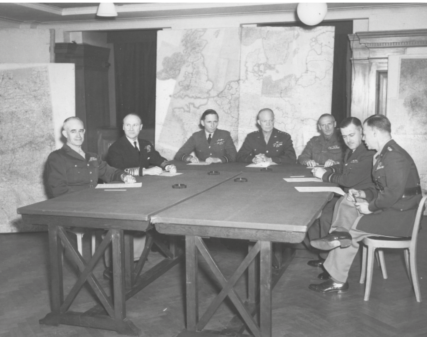
Boven: De geallieerde legerleiding in februari 1944. V.l.n.r.: luitenant-generaal Omar Bradley, commandant van de Amerikaanse grondstrijdkrachten, admiraal Bertram Ramsay, commandant van de geallieerde marine, luchtmaarschalk Arthur Tedder, plaatsvervangend opperbevelhebber, generaal Dwight D. Eisenhower, opperbevelhebber, generaal Bernard Montgomery, opperbevelhebber van het Britse leger, luchtmaarschalk Trafford Leigh-Mallory, opperbevelhebber van de geallieerde luchtmacht, luitenant-generaal W. Bedell-Smith, stafchef.

nederlaag die Rommel in november 1942 bij El Alamein leed tegen het Britse 8ste leger, en in mei 1943 waren de troepen van de asmogendheden uit Afrika verdreven. Operatie Torch gaf de geallieerden een waardevolle ervaring met het plannen en uitvoeren van een grote amfibische landing, en het Amerikaanse leger maakte zo kennis met wat het betekende om tegen ervaren Duitse troepen te vechten.