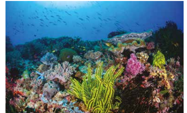
De Koraaldriehoek in de Grote Oceaan

De enorme Koraaldriehoek in Zuidoost-Azië, een zeegebied in het westen van de Grote Oceaan. In het ecosysteem leven 600 soorten rifkoralen, zes van de zeven soorten zeeschildpadden die de wereld kent en meer dan tweeduizend soorten rifvissen!