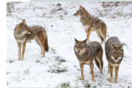
Een groep coyotes

zoogdieren zoals hazen, maar coyotes kunnen ook een volwassen hert neerhalen en jagen ook in roedels.