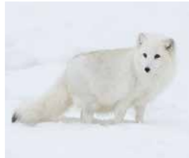
Poolvos met wintervacht

De bruingrijze vacht van de poolvos wordt in de winter sneeuwwit. Dat kan zijn omdat het dier zich zo beter kan verschuilen in de ijzige winters van het noordpoolgebied. Of het dier maakt geen melanine aan (natuurlijke huidkleuring), zodat er isolerende lucht in de holle ruimtes in de haren kan doordringen, wat als isolatie werkt.