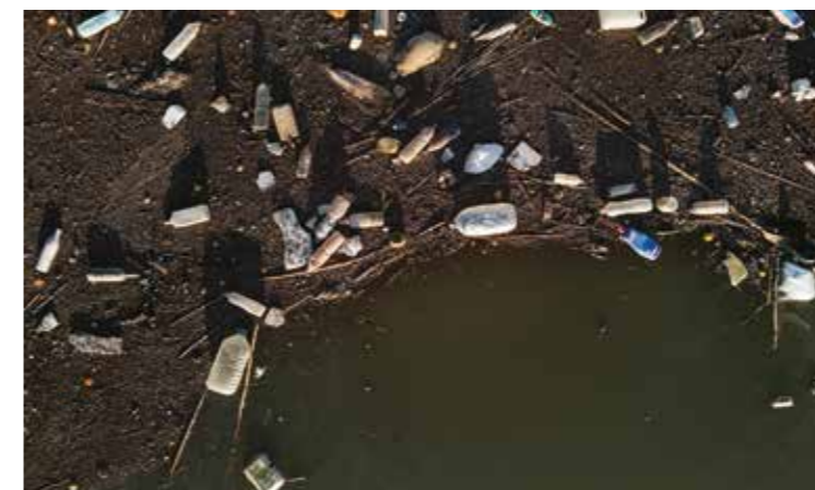
Een natuurlijk ecosysteem bedreigd door afval van de mens

Al eeuwenlang heeft de mens zich bewogen binnen ecosystemen. Maar doordat er steeds meer mensen zijn dreigen veel ecosystemen te verdwijnen. Grote stukken natuur moesten plaatsmaken voor landbouw, woningen of fabrieken. Maar als er delen van een ecosysteem worden weggehaald of toegevoegd, kan het veranderen van grootte en vorm en van de manier waarop het werkt. Door toedoen van de mens dreigen veel ecosystemen zelfs helemaal te verdwijnen.