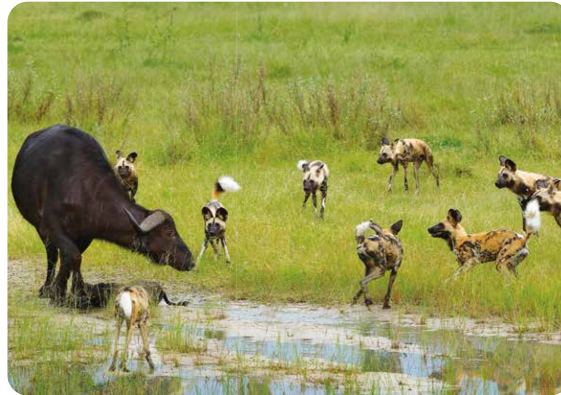
Wilde honden omsingelen een buffel en haar kalf in Zuid-Afrika.