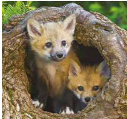
Vossenwelpen in een holle stam