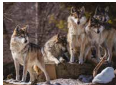
Een roedel wolven

In gebieden waar ze op veel grote dieren kunnen jagen, kan een roedel (groep) tot 30 wolven tellen. Als wolven in een roedel jagen, kunnen ze prooien doden die veel groter zijn dan zijzelf, zoals elanden. Elke roedel heeft een territorium, dat ze verdedigen tegen andere wolven.