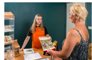
Medewerker sport en recreatie.