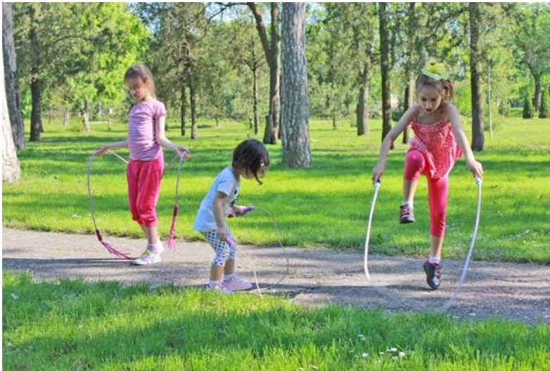
Kijken naar de grove motoriek.

Bij spelgedrag kijk je naar de manier waarop een kind met andere kinderen omgaat. Speelt het kind samen of naast elkaar. En hoe gaat dat spelen dan, beleeft het kind er plezier aan? Je kijkt ook of spelgedrag passend is voor de leeftijd van het kind. De ontwikkeling van de motoriek houd je in de gaten door te kijken naar fijne en grove motoriek van het kind. Hoe beweegt het kind en is dit passend voor zijn leeftijd? Grove motoriek is de ontwikkeling van de grote bewegingen, zoals lopen, kruipen en rollen. Fijne motoriek betreft de kleinere bewegingen, zoals knippen met een schaar of een veter strikken.