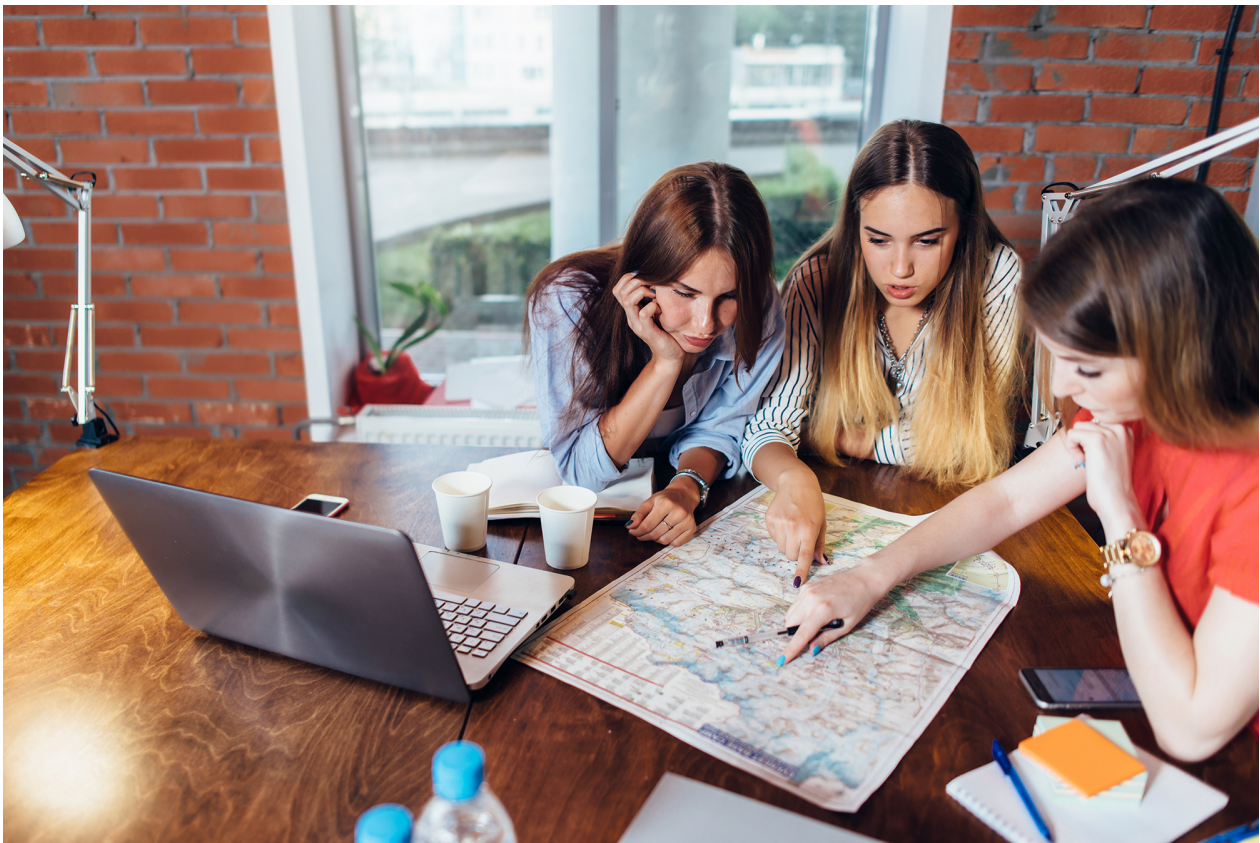
Op avontuur in het buitenland.